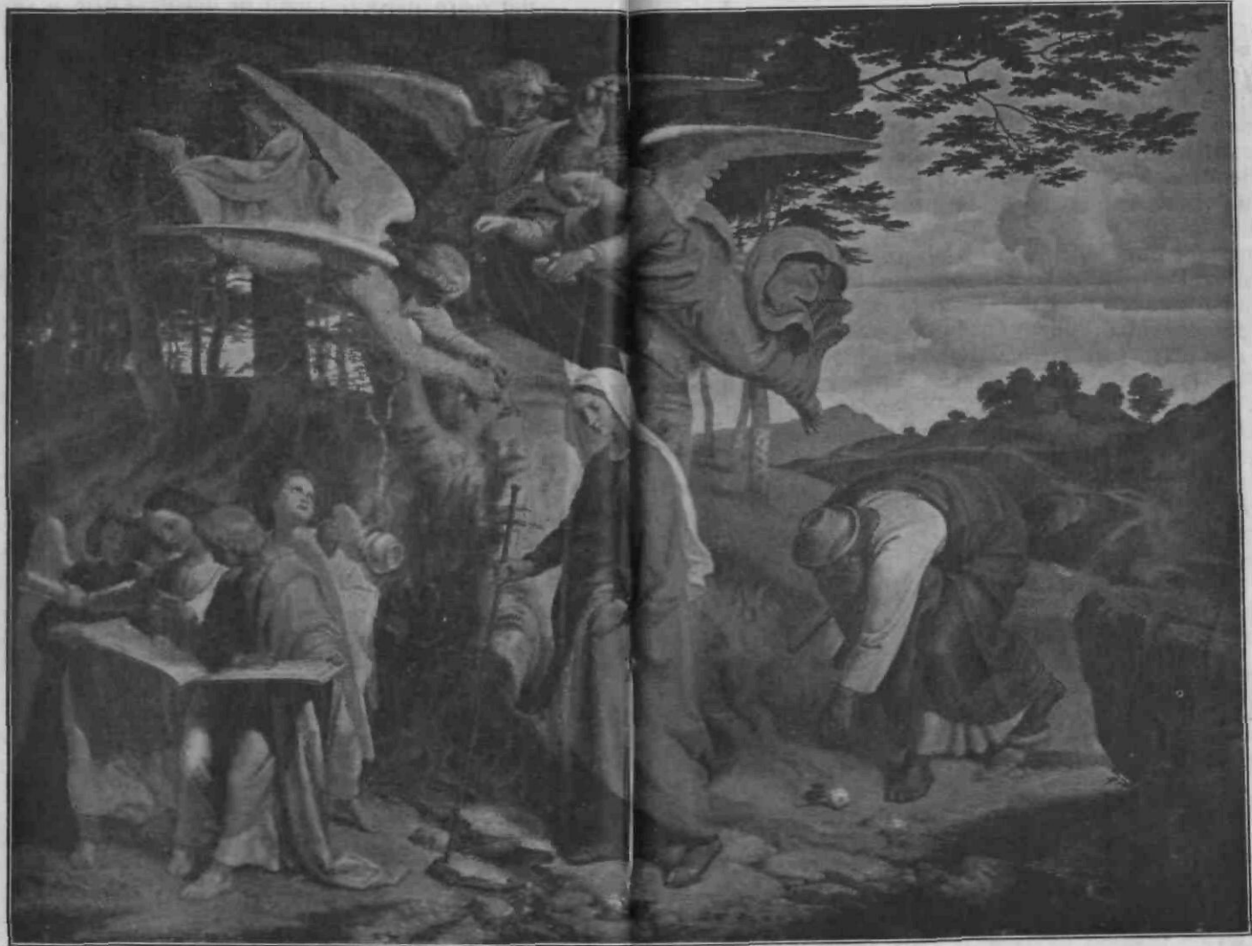
Angeli spremljajo svojo nebeško Kraljico.