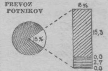
DELEŽ POSAMEZNIH VEJ PROMETA V PREVOZU LETA 1954

Podobno je tudi s prevozom blaga: 78% prevoza opravljajo železnice. Na cestni promet odpade 9%, na rečni 5%, na pomorski pa 8%. To je najboljši dokaz kako velik pomen ima železniški promet za razvoj našega gospodarstva. Hkrati pa iz teh podatkov vidimo da druge vrste prometa, zlasti rečni in cestni, še niso tako razvite, da bi lahko prevzele ustrezajoči del prevoza, zlasti v tistih primerih, kadar sta prevoz s tovornimi avtomobili ter rečni ali pomorski prevoz rentabilnejša ali iz kakršnihkoli razlogov ugodnejša od železniškega.