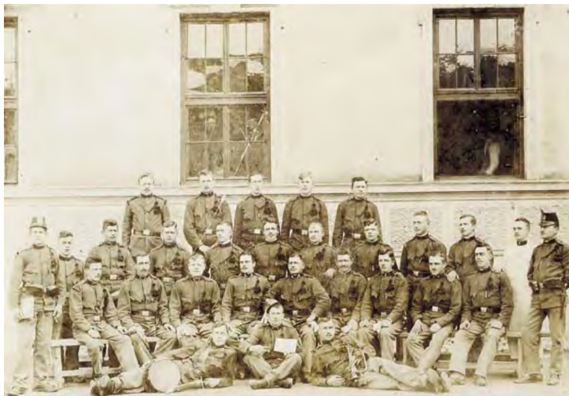
Društveni dom v Domžalah je bil med letoma 1914 in 1917 najprej kasarna za vojake, poslane na različne fronte prve svetovne vojne, pozneje pa je bila v njem dvakrat bolnišnica.

Tretji korpus je na začetku vojne štel 100.000 mož, od tega je odšlo na bojišče 30.000 Slovencev. Na vojnih območjih je Avstro-ogrška na začetku vojne premogla okrog 100 polkov, Slovenci so v večji ali manjši meri služili v 50 polkih od te stoterice. Od vseh polkov je bil najbolj znan 17. pešpolk, ki so ga zaradi pretežne zastopanosti Slovencev v njem poimenovali kar polk 'Kranjski Janezi'. Polk je imel že od začetka nekakšnega botra, predstojnika ali od oblasti postavljenega ugledneža. Imenovali so ga za 'imejitelja'. Prvi imejitelj 17. k. u. k. pešpolka Kranjskih Janezov je bil Ritter von Milde, drugega pa je kot odlikovanje cesar Karel I. (nasledil je umr-