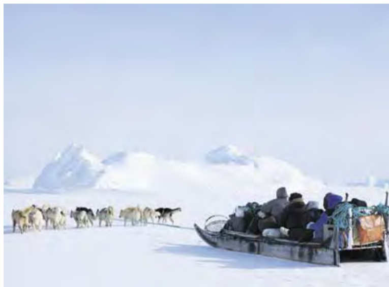
Posnetek iz filma Vanishing Point

letos prvič tudi na Ptujju zvrstilo 50 ur raznovrstnega programa, ki je na vsa festivalska prizorišča privabil razveseljivo množico ljubiteljev gibljive slike in prvinskih doživetij v objemu gora.