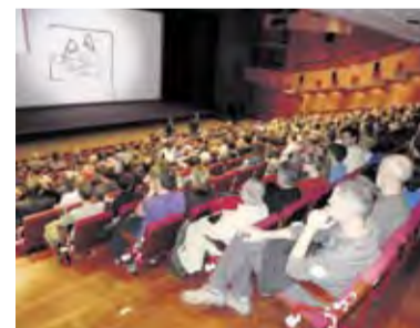
Dober obisk, polna Linhartova dvorana CD

resnično zgodbo o običajnih ljudeh, ki so opravili neobičajno stvar. Prosto voljno so se javili in reševalno ekipo, vendar niso prostovoljno postali heroji. Napor, ki so ga prestali, je še dolgo vplival na njihovo življenje. Zelo realističen film brez komercialnosti in senzacionalizma.