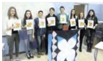
Zmagovalne ekipe turnirja

V četrtek, 6. marca, popoldne so se na Osnovni šoli Rodica v prijateljskem srečanju med seboj pomerili mladi domžalski debaterji. Enajst ekip je razpravljalo o tem, ali nas osnovna šola dovolj pripravi na življenje.