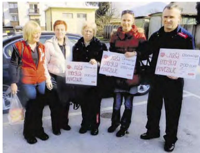
Delavci Petrola pred predajo zbranih sredstev malčkom dupliškega vrtca

kajšnji meri prispevata ne le k naši avtomobilski preskrbi, pač pa z videzom poslovnega prostora in površin, ki ju obdajajo, tudi k zglednemu okoljevarstvenemu mestnemu okolju. V tem smislu v Domžalah prednjači Bencinski servis II ob kompleksu Breza, ki namenja veliko skrb urejenim parkovnim površinam, hortikulturi in sploh videzu objekta, ki v svoji primarni naravi sicer ni posebej izstopajoč v okolju našega mesta.