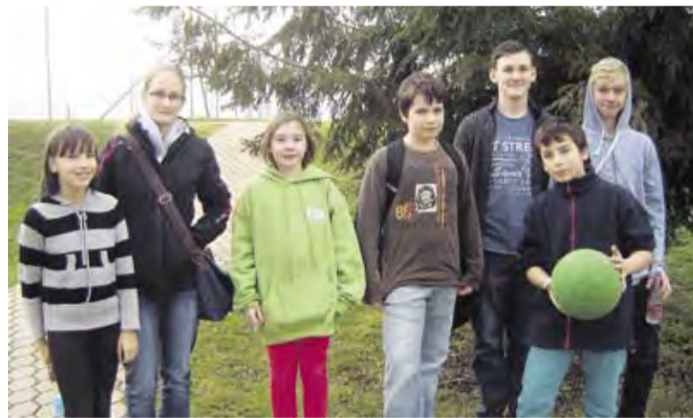
Šahovski podmladek Domžal