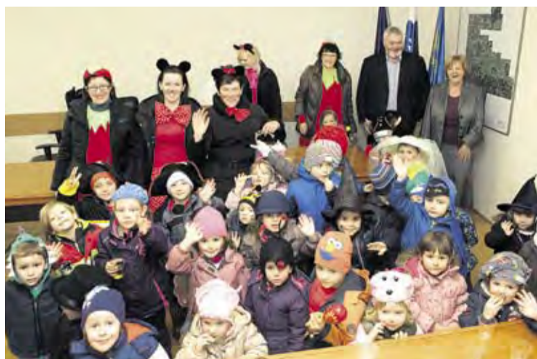
Obisk vrtca Urša na Občini Domžale

kurenti iz Ormoža in skupaj z najmlajšimi maskarami odganjali zimo. Seveda pa niso manjkali tudi slastni krofi, s katerimi so se posladkale majhne in malo večje maskare.