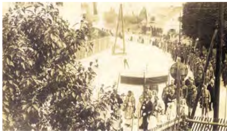
V času prve svetovne vojne se je vseh cerkvenih slovesnosti, procesij, spominskih in drugih prireditev v Domžalah udeleževalo tui vojaštvo. Na fotografiji: Procesija skozi Domžale v obdobju prve svetovne vojne.

Vojna je kmalu zaznamovala tudi življenje zunaj bojišč. Slovenski vojaki so za cesarja in habsburško monarhijo