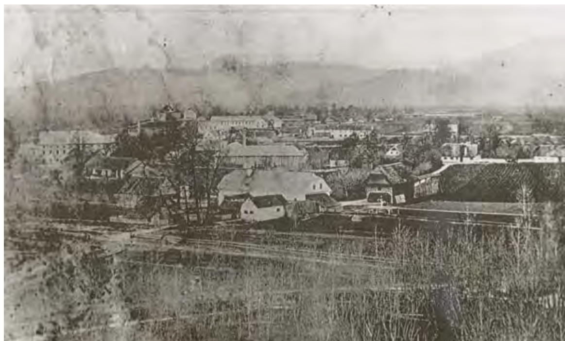
Prva fotografija Domžalah. Posnel jo je tirolski tovarnar Tomaž Oberwalder v letu 1875, le leto po tem, ko je bila ustanovljena šola v Domžalah.

Ko je bila leta 1864 v Domžalah ustanovljena redna osnovna šola, se je za službo učitelja prijavil in jo tudi dobil. 15. decembra 1864 so ga postavili na delovno mesto učitelja in šolskega vodje v Domžalah.