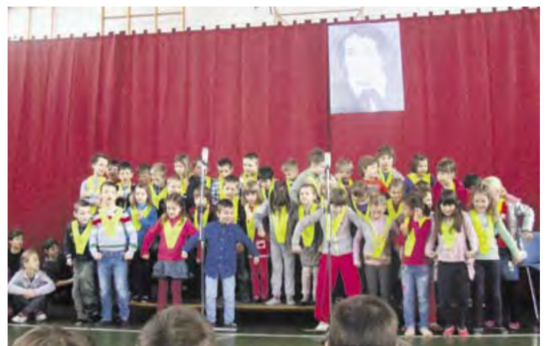
Otroški zbor med nastopom