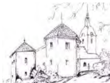
V enem od dveh obrambnih stolpov nekdanjega tabora na Goričici je bila prva učilnica za domžalske šolarje.