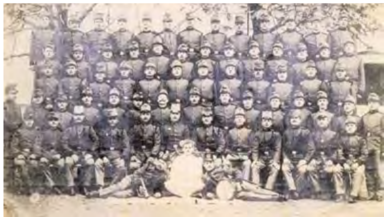
Tudi sicer so se v Domžalah na poti na vojaško fronto velikokrat ustavljali različni vojaški oddelki. Na fotografiji 27. pešpolk cesarske armade, ki se je ustavil v Stobu.

lega Franca Jožefa) 27. novembra 1916 imenoval svojega, tedaj štiriletnega sina Otta Habsburškega. Že kot otrok je poznejši 'imejitelj' spoznal, da so Slovenci, tj. Kranjci, odlični vojaki.