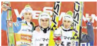
Jernejeva zmaga v Sapporu

SSK SAM IHAN Še posebej ponosni smo na našega člana Jerneja Damjana. V poljskih Zakopanah na ekipni tekmi za svetovni pokal v smučarskih skokih je slovenska reprezentanca, skupaj z Jernejem Damjanom (drugi tekmovalci Peter Prevc, Robert Kranjec in Jurij Tepeš), zmagala. Na prvi tekmi za svetovni pokal v japonskem Sapporu je Jernej Damjan skočil na 2. mesto. Na drugi tekmi v Sapporu pa mu je uspelo tisto, kar si je dolgo želel – zmagati!