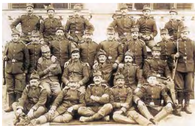
Vod Kranjskih Janezov na ruski fronti v Galiciji leta 1915

umirali v mnogih polkih. Iz Gorice in Maribora je odšel v vojne vihre 47. pehotni polk, iz Celja je v avgustu odšel v Galicijo 87. pehotni polk, v katerem je ob koncu vojne služilo kar 84 odstotkov naših ljudi, v 97. pešpolku pa je bila polovica vojakov Primorskih Slovencev. Vojne razmere so goltale vse te tisoče v vojaška oblačila obleče-