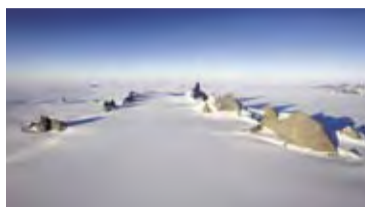
Posnetek iz filma The Last Great Climb

Le nekaj dni po ugasnitvi olimpijskega ognja v Sočiju je z razglasitvijo najboljših filmov ugasnila tudi osma svečka mednarodnega festivala gorniškega filma Domžale. Kar prehitro je minilo pet gorniško navdihnenih dni med 24. in 28. februarjem 2014, ko se je na velikih platnih in odrskih deskah v Ljubljani, Celju, Domžalah in