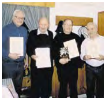
Prejemniki društvenih priznanj za udeležbo na športnih igrah DVI Slovenije