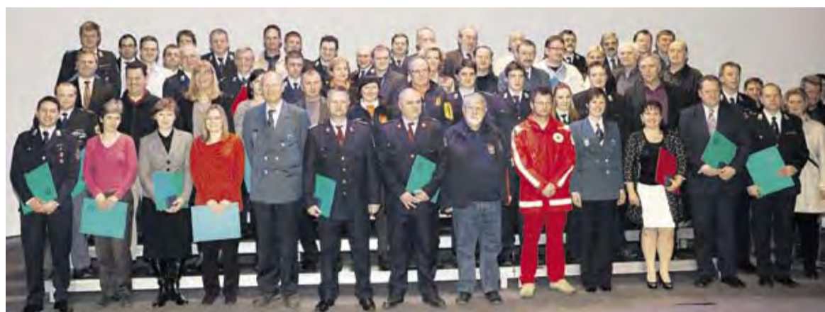
Prejemniki priznanj CZ na regijski prireditvi v Kamniku