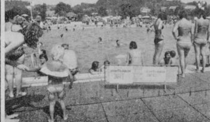
Kljub opozorilom in napisu »zaprt« je bil bazen poln kopalcev

Medobčinsko društvo slepih in slabovidnih Ptuj vabi svoje člane, da se udeležijo tovariškega srečanja slepih in slabovidnih, ki bo na DONAČKI GORI, 12. septembra 1981. Člane, ki so pa zmožni dobre hoje posebej prosimo, da se udeležijo pohoda na vrh Donačke gore, ki bo isti dan, to je 12. septembra. Prijave sprejemamo v naši pisarni ali po pošti. Avtobus bo odpeljal v soboto, 12. septembra ob 7. uri izpred gostilne Beli križ. Tovariško srečanje slepih in slabovidnih in pohod planincev na vrh Donačke gore bo v vsakem vremenu. Prevoz in topli obrok je brezplačen.