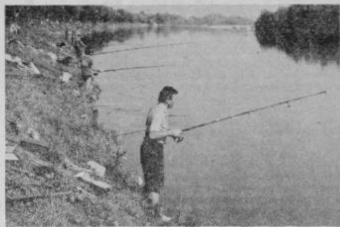
Članska tekmovalna trasa v B sektorju, med ekipnim tekmovanjem v lovu rib s plovcem; bo potegnili ali ne?