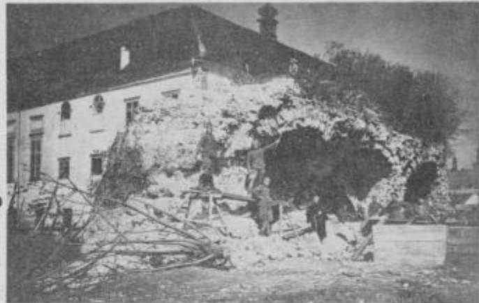
Rušenje utrd pri minoritskem samostanu. V letih 1928—32 so se v Ptujju poslednji lotili razstreljevanja obzidja. Odstranili so pentagonalno bastijo in del zidu pri minoritskem samostanu in okrnili mesto za srednjeveški zaključek na vzhodnem delu. Fototeka kulturnozgodovinskega oddelka št. 588

Utrjevalna dela, ki naj bi mesto Ptuj zavarovala pred Turki, so se začela leta 1549. Prva faza utrjevanja je zajela mesto in je trajala do leta 1558. Italijanski gradbeniki so imeli nalogo, da takratno obzidje ojačajo in prilagodijo novemu načinu bojevanja. Stari visoki in vitki stolpi so bili dobra obramba pred puščicami, pred zadetki iz topov pa niso bili varni. Novi načini vojskovanja so zahtevali čokate in masivne stolpe in bastije. Kot prva stavba v novem utrbenem sistemu je leta 1551 zrasel Dravski stolp, ki je bil opremljen s puškarnicami, topovi pa so bili nameščeni na platuju pod streho. Temu sta sledila oba Vodna stolpa pri dominikanskem samostanu. Staremu polkrožnemu župniškemu stolpu so dodali pravokotno ozidje. Najbolj ogrožena linija v mestu je bil njegov vzhodni del. Tega so zavarovali z dvema pentagonalnima bastijama pri novih vratih in pri minoritskem samostanu. Tako je bilo mesto zavarovano z ojačanimi utrdami, ki so vklepale tudi domini-