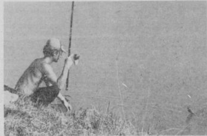
Domačin Zvone Petek po uspešnem prijemu podusti