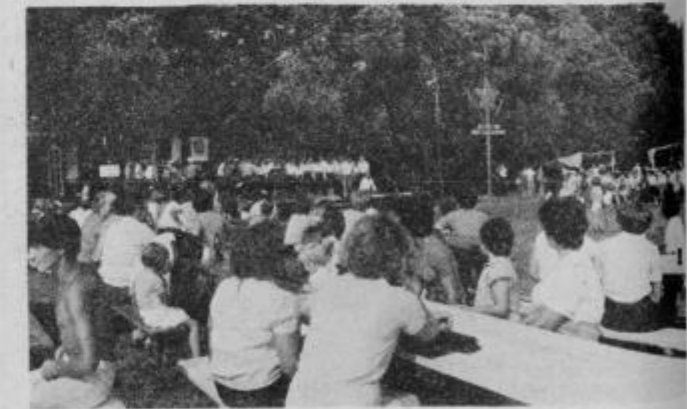
Osnrednja prireditve je bila na igrišču, posebej pripravljenem za to priložnost