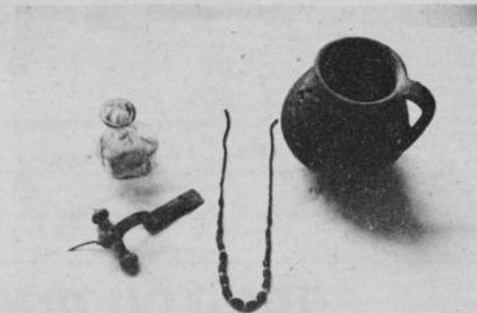
Pridatki v rimskem grobu (steklena solznica, fibula, ogrlica, vrč)

Kontinuiteta naselitve se opaža še v mlajša obdobja kasne bronaste dobe, tu smo odkrili grobne najdbe na prostoru sedanje stavbe, večji del jih je pa še pod zemljo; tako da gre naselitve od pribl. 2000 do 900 pred našim štetjem.”