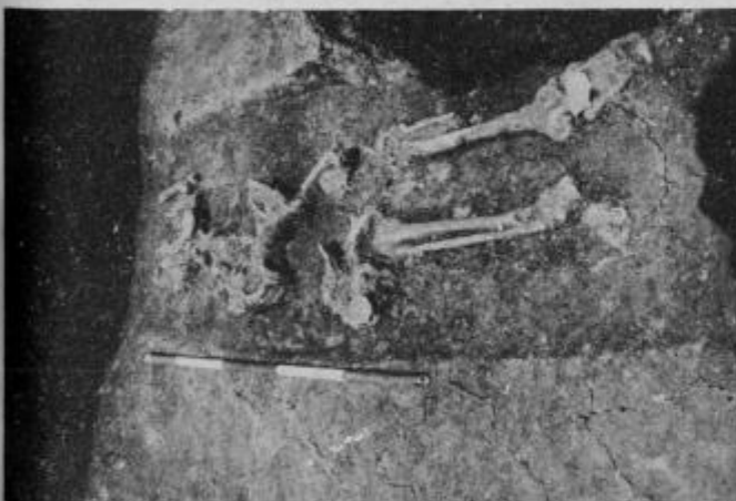
Pogled na skeletni grob

Pribl. 80 m severno od antičnih stavb so našli žgano rimsko grobišče. Za razliko od ostalih grobišč, kjer so bili navadno mešani — torej skeletni in žgani grobovi, so na tem grobišču samo žgani. So različnih vrst, od prosto vkopanih žar, ki so