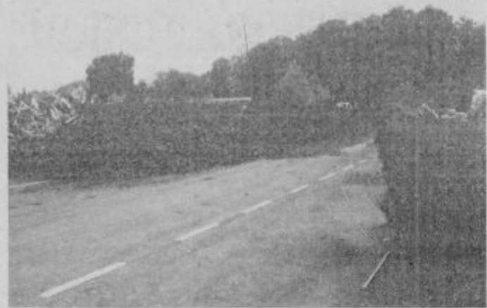
Zdaj se zaloga, toda koliko časa še?

Že od začetka leta so bile napovedi glede oskrbe s premogom precej neobetavne. Bosanski premogovniki zahtevajo visoke soudeležbe pri modernizaciji svojih zmogljivosti, trgovska podjetja iz Slovenije, ki se ukvarjajo s prodajo premoga sredstev za sovlaganje nimajo, pa tudi iz