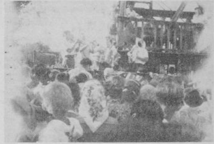
Na eni od prireditev po osvoboditvi pri lesenem stolpu na vrhu Gomile