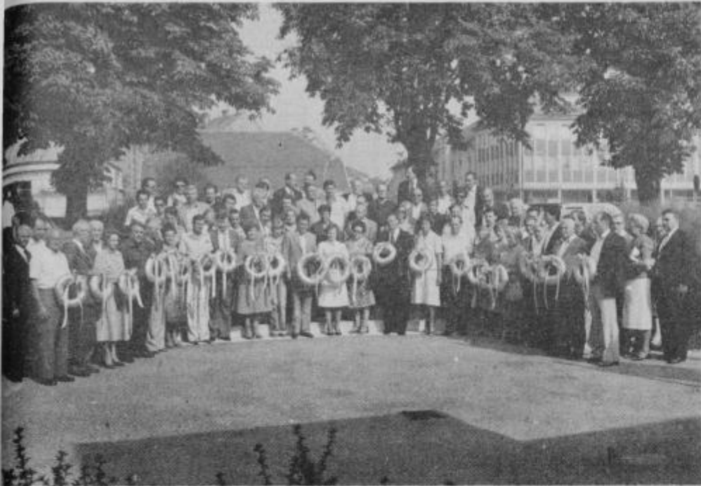
Člani delegacij in drugi udeleženci žalne seje pred domom Franca Krambergerja v Ptuj