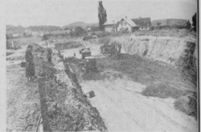
Tudi zemeljska dela, tik pred pričetkom gradnje, so že opravljena.

„Izhodišče za blokovno gradnjo metra neto stanovanjske površine je 18.890 din, medtem ko bodo ostali stroški znašali okrog 2.000 din po kvadratnem metru. Torej bi po teh podatkih sodili, da bo veljal