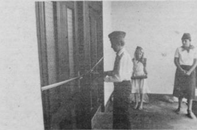
Učenci so odprli vrata nove šole.