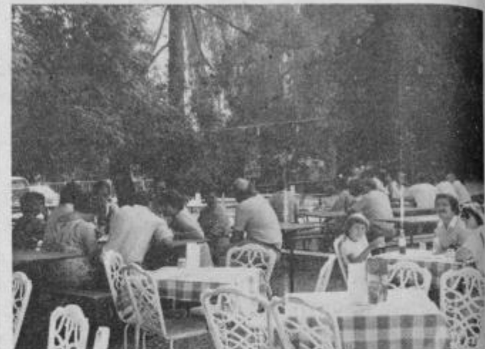
Srečanje se je pričelo v popoldanskih urah, največ gostov pa je prišlo zvečer

Kulturno in športno društvo Maribor iz Hildna je pod pokroviteljstvom mestne konference SZDL Maribor v soboto na Borlu izvedlo srečanje naših delavcev na začasnem delu v tujini. Med prijetnim vzdušjem, ki so ga pripravili