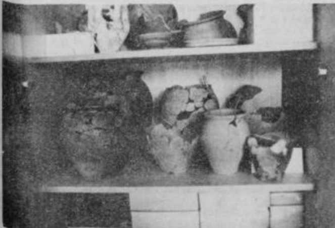
Nekaj lepo ohranjenih keramičnih posod