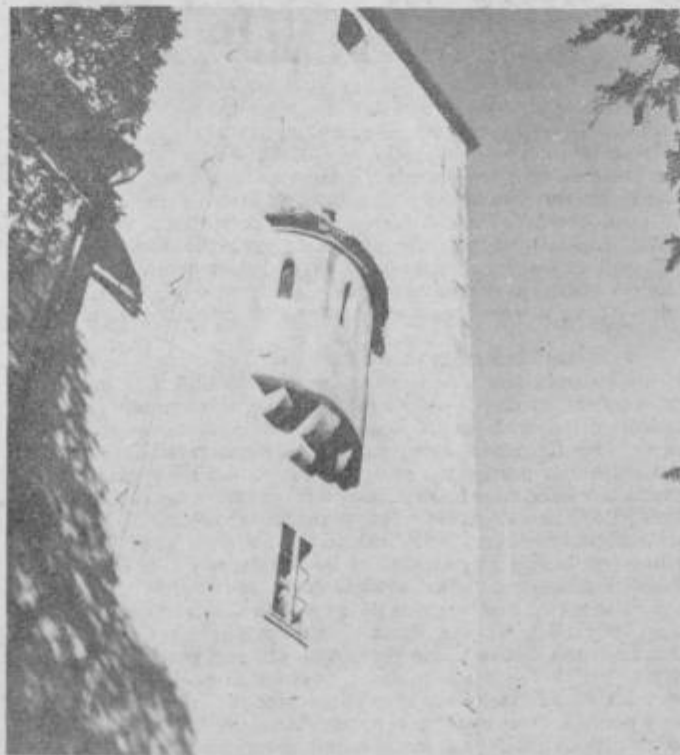
Grad Ormož: Apsidalna konzola iz 13. stoletja na grajskem stolpu