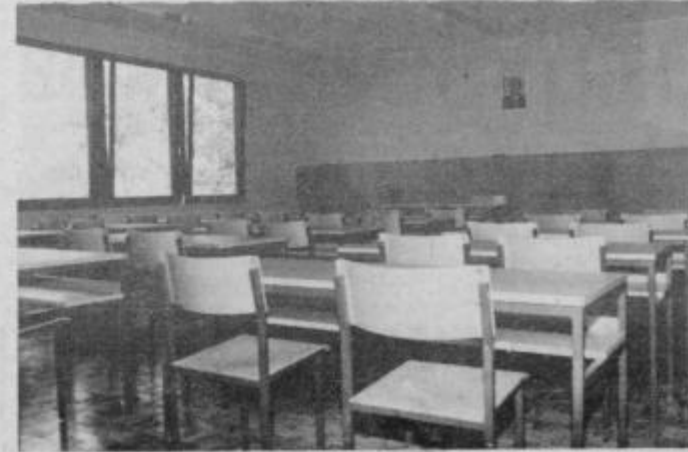
Pogled v notranjost šole.