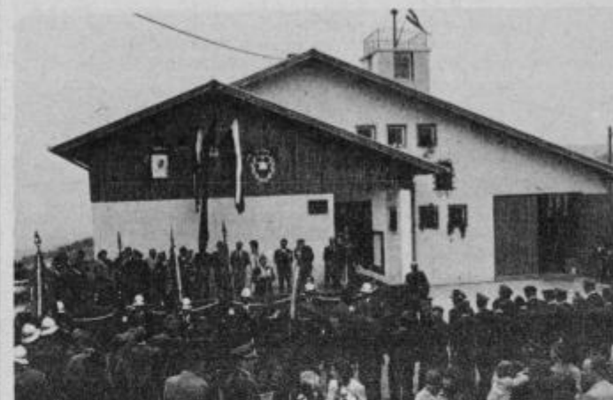
Iz osrednje svečanosti na Šmartnem.

Gasilsko društvo Šmartno na Pohorju se v zadnjem obdobju uvršča med najaktivnejše na območju občine Slovenska Bistrica, kar velja tako za pridobivanje novih članov kot za dosežene rezultate na