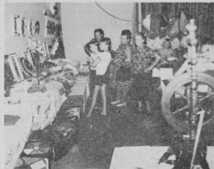
Z razstave ročnih del

Koordinacijski odbor za kulturo, izobraževanje in družabno življenje krajanov pri KK SZDL Heroja Lacka Rogoznica je v nedeljo 2. avgusta delovne ljudi in občane povabil na družabno prireditev Veseli