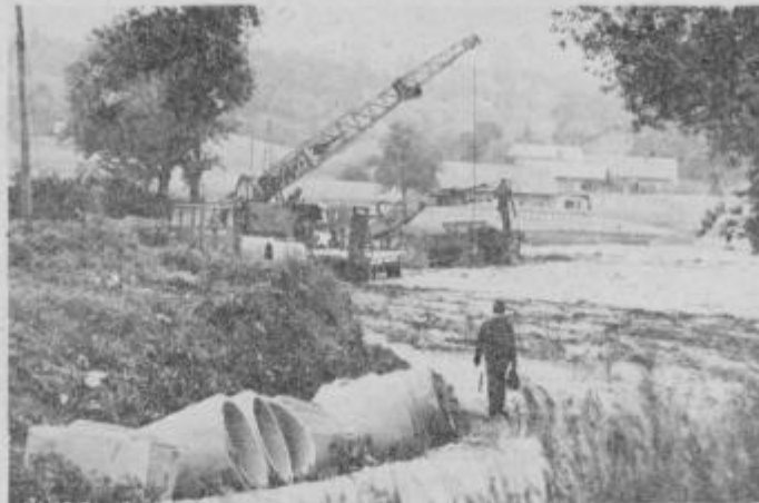
Pred gradnjo je potrebno opraviti vsa zemeljska dela.

„Vsako leto opravimo precej dela. Glede na naše možnosti — predvsem na obseg sredstev — ni mogoče urediti kar se da. Obnavljamo sode, strehe, kanalizacijo — to so posegi, ki veljajo precej denarja. Če pa jih ne opravimo, tudi stanovanj ne bo moč urediti v teh starih hišah. Vedeti moramo, da je vsak poseg opravljen le s soglasjem Zavoda za spomeniško varstvo.