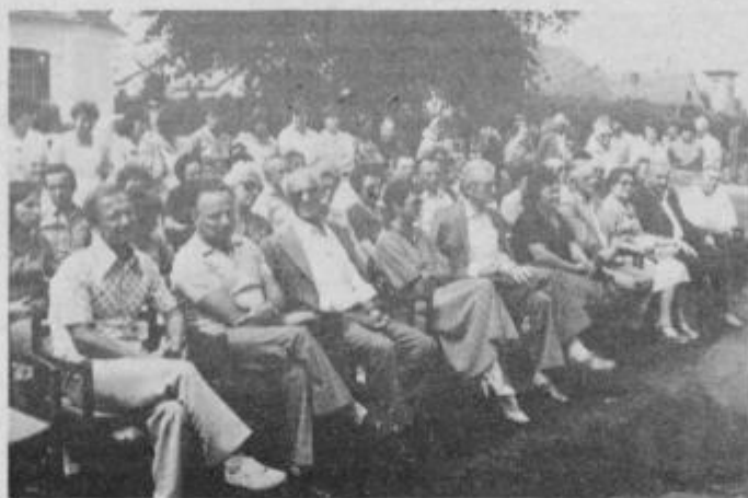
Na slovesnosti ob otvoritvi prizidka k domu upokojencev v Muretincih so se zbrali številni predstavniki in gostje.