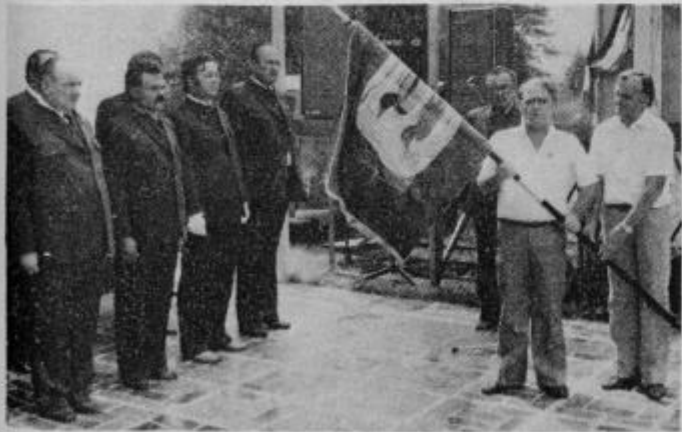
Pod pokroviteljstvom DO Emona Merkur Ptuj in Mesokombinata Petrutina Ptuj so razvili lovski prapor. Razvijata ga predstavnika pokrovitelja.

Ze v zadnji številki Tednika smo poročali o veliki delovni zmagi članov LD Ptuj, ki so 1. in 2. avgusta organizirali vrsto prireditev, razvili svoj lovski prapor in odprli svoj novi lovski dom, v katerega so vložili nad deset tisoč ur prostovoljnega dela. Danes še objavljamo dva posnetka te slovesnosti.