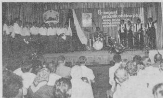
V kulturnem programu so poleg ptujške godbe nastopali tudi člani moškega pevskega zbora in ansambla Tornado iz Majšperka.

Tita in Kidriča. Tako so obudili spomin na najtežje dni naše polpretekle zgodovine in se na svojstven način, skupaj z udeleženci slovesnosti, poklonili spominu na padle borce, aktiviste in ostale žrtve narodnoosvobodilnega boja.