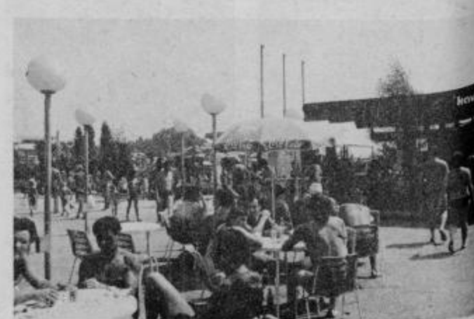
V Ptujске topliče prihaja vedno več obiskovalcev od blizu in daleč

gradnja pa bi se potem pričela v prvi polovici leta 1982.