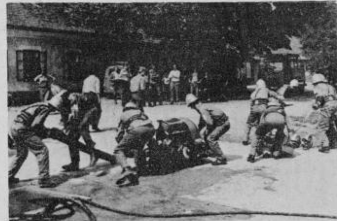
Boj s sekundami...