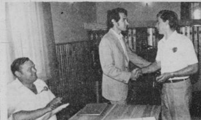
Podpisali so listino o pobratenuju

aktiv TVD Partizan je podelil priznanja ob jubileju, ob koncu pa so najboljšim s športnih srečanj podelili pokale in priznanja (o tem poročamo posebej).