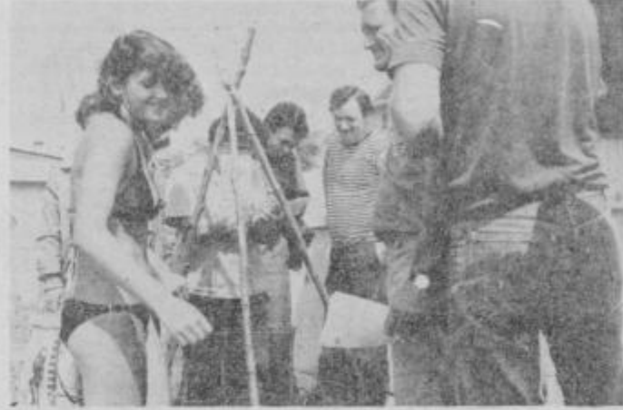
Pri tehtanju je šlo tudi za grame