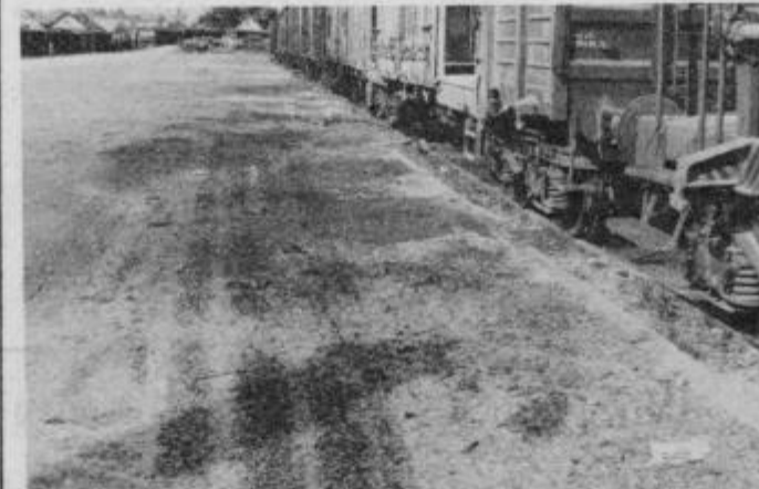
Od raztresene koruze se hranijo jate golobov.

Lansko leto smo bili boj pod geslom: „Nobeno zrno ne sme ostati na polju.“ Organizirana je bila široka družbena akcija. Zagodilo nam je izredno slabo jesensko vreme, odpovedala je vsa mehanizacija. Boj je bil hud. Danes pa žal ugotavljam, da ta boj izgublja svojo pravo vrednost tudi na železniški postaji.