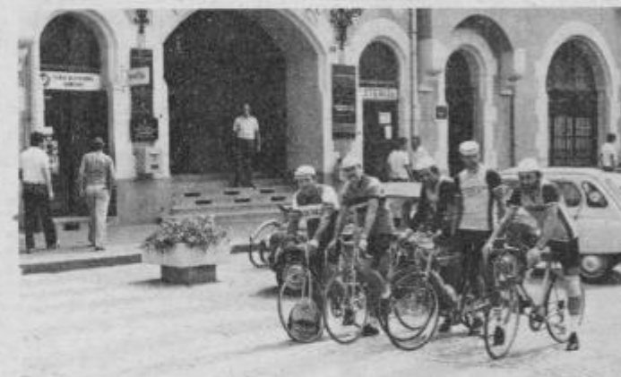
Kolesarji ob kratkem postanku v Ptuj

ca—Kop—Velenja—Soštanja—Vrnskega—Kamnika—nazaj v Ljubljano. V programu je tudi osvojitve petih gorskih vrhov: Sorca, Korenjsko sedlo, Pokljuka, Kope na Slovenj Gradcem in najza-