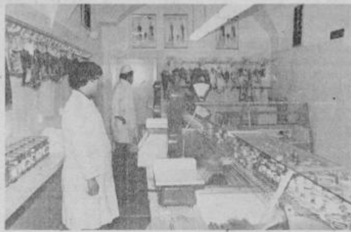
Nova podoba košakove mesnice

sno od zagotovitve potrebnih sredstev. Tudi za sedanjo preureditev je bilo potrebno veliko angažiranja, da so se pridobila sredstva.