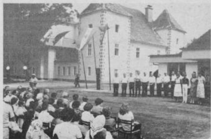
Kulturni program so izvajali člani moškega pevskega zbora društva upokojencev Ptuj, recitatorji OŠ Gorisnica in mladi folkloristi iz Cirkovc.