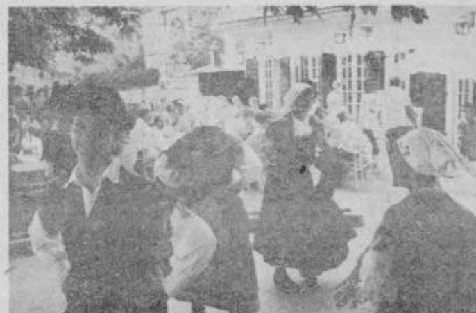
Ob zaključku prvenstva na ploščadi grajske restavracije so bili tekmovalci najbolj veseli folkloristov iz Markove in kurentov, ki so prišli z njimi.