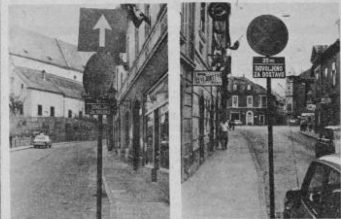
Prometna znaka, ki sta mnoge olajšala za 300 dinarjev.

Na začetku Bežjakove ulice v Ptujju stoji znak, ki prepoveduje parkiranje in ustavljanje v dolžini tridesetih metrov, dovoljuje pa ustavljanje oziroma parkiranje vozilom, ki skrbijo za dostavo blaga v tamkajšnje trgovske lokale. Voznik je pustil svoje vozilo precej višje od 30-metrskega pasu v prepričanju, da je ravnal pravilno, saj si je iz časov opravljanja soferskega izpita dobro zapomnil, kaj pomeni opisani prometni znak. Na njegovo presenečenje ga je ob vrnitvi čakala ob avtomobilu miličnica in vljudno zahtevala tristo dinarjev. Ker je voznik