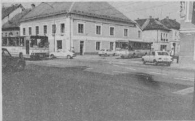
Križišče Titove in Kolodvorske ceste črna točka bistriškega prometa.

Križišča cest v občinskem središču Slovenska Bistrica postajajo v zadnjem obdobju pravi prometni zamašek, tako za tiste, ki potujejo skozi to mesto kot za tiste, ki cestne prometnice koristijo vsak dan tudi po večkrat. Težava je toliko večja, ker je skozi središče mesta speljana republiška cesta, ki kljub hitri cesti ni veliko razbremenjena, glede na promet za kakršnega je bila ob rekonstrukciji predvidena.