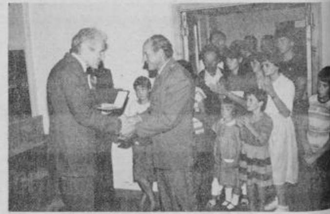
Komandant garnizije JLA „Dušan Kveder-Tomaž“ sprejema plaketo in čestitke

obrambe ter družbene samozasčite in podružbljanju nalog na tem področju, hkrati pa je pristno in uspešno sodelovanje garnizona JLA „Dušan Kveder-Tomaž“ Ptuj tudi dragocen prispevek h krepitvi bratstva ter enotnosti med narodi in narodnostmi Jugoslavije.