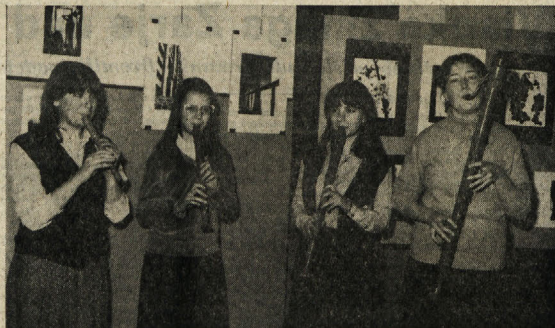
V Trebčah so odprli fotografsko razstavo Foto Trst 80. Na otvoritveni slovesnosti je nastopil tudi kvartet kljunastih flavt Glasbene matice