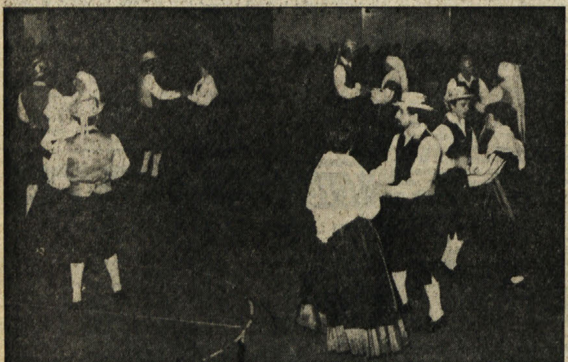
Na prazniku škroto in čarovnikov v dverani SZ Bora pri Sv. Ivanu je nastopila tudi Tržaška folklorna skupina «Stu ledi»