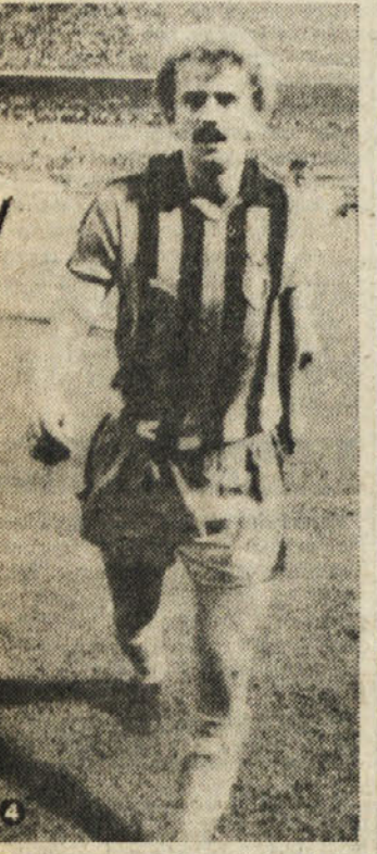
Prohaska je v nedeljo dosegel prvi prvenstveni gol za Inter

Naj omenimo še, da je sodniški par še enkrat več izredno nerodno uporabljal piščalko, kar je izrazilo sicer zelo nešportno reakcijo s strani