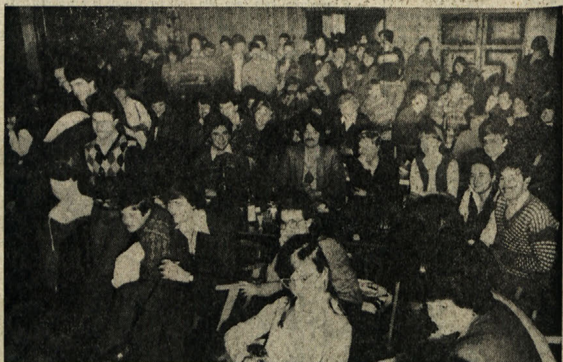
Slovenski študenti so priredili v soboto po ustaljeni tradiciji brucovanje, to je priložnost za zabavo, pa tudi za medsebojno spoznavanje