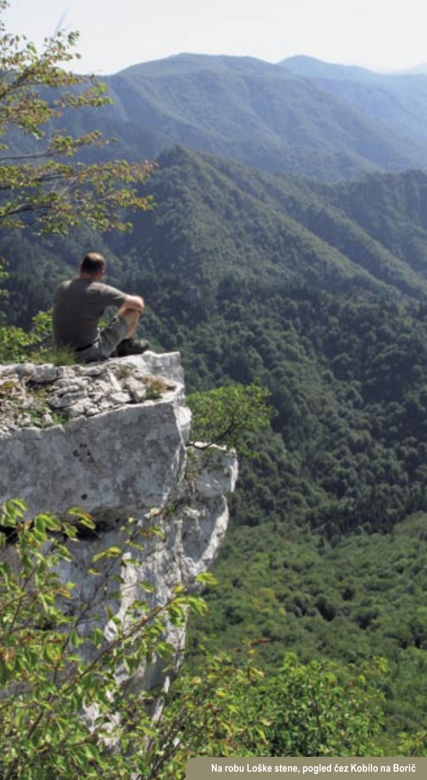
Na robu Loške stene, pogled čez Kobilu na Borič