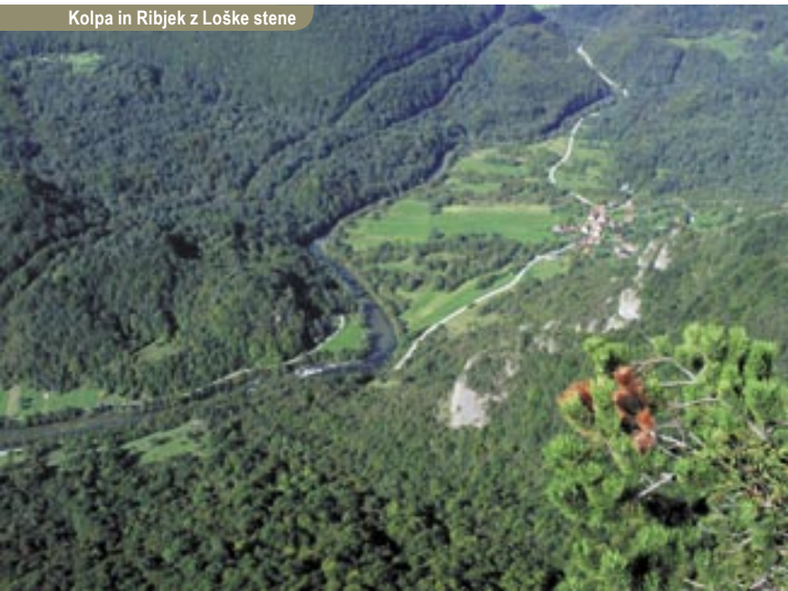
Kolpa in Ribjek z Loške stene