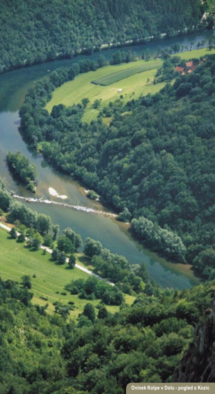
Ovinek Kolpe v Dolu - pogled s Kozic