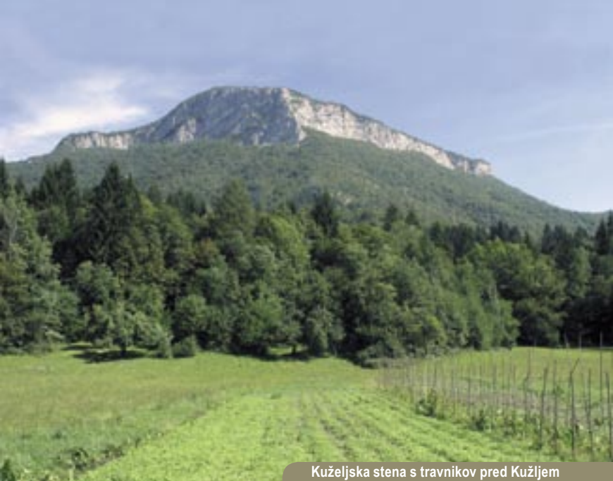
Kuželjska stena s travnikov pred Kužljem

Ob robu stene se po razbitem svetu v rahlem spustu odpravimo proti severozahodu, kjer nas prav kmalu navduši imenitno okno. Lep kamnit most se pne čez odprtino in skozi jo v dolini vidimo obe vasi - naš in hrvaški Kuželj. Nadaljujemo v isti smeri do nekoliko ravnejšega predela nekdanje vasice Rake. Samoten svet, ki pa je nekoč premogel celo trto v zavetnih pobočjih. Izpod ostankov vasice se nad Račkim potokom stezica zložno, silno udobno spušča v dolino. Do vasi je nekoč vodil kolovoz in seveda ni smel biti strm, še danes je pot široka.