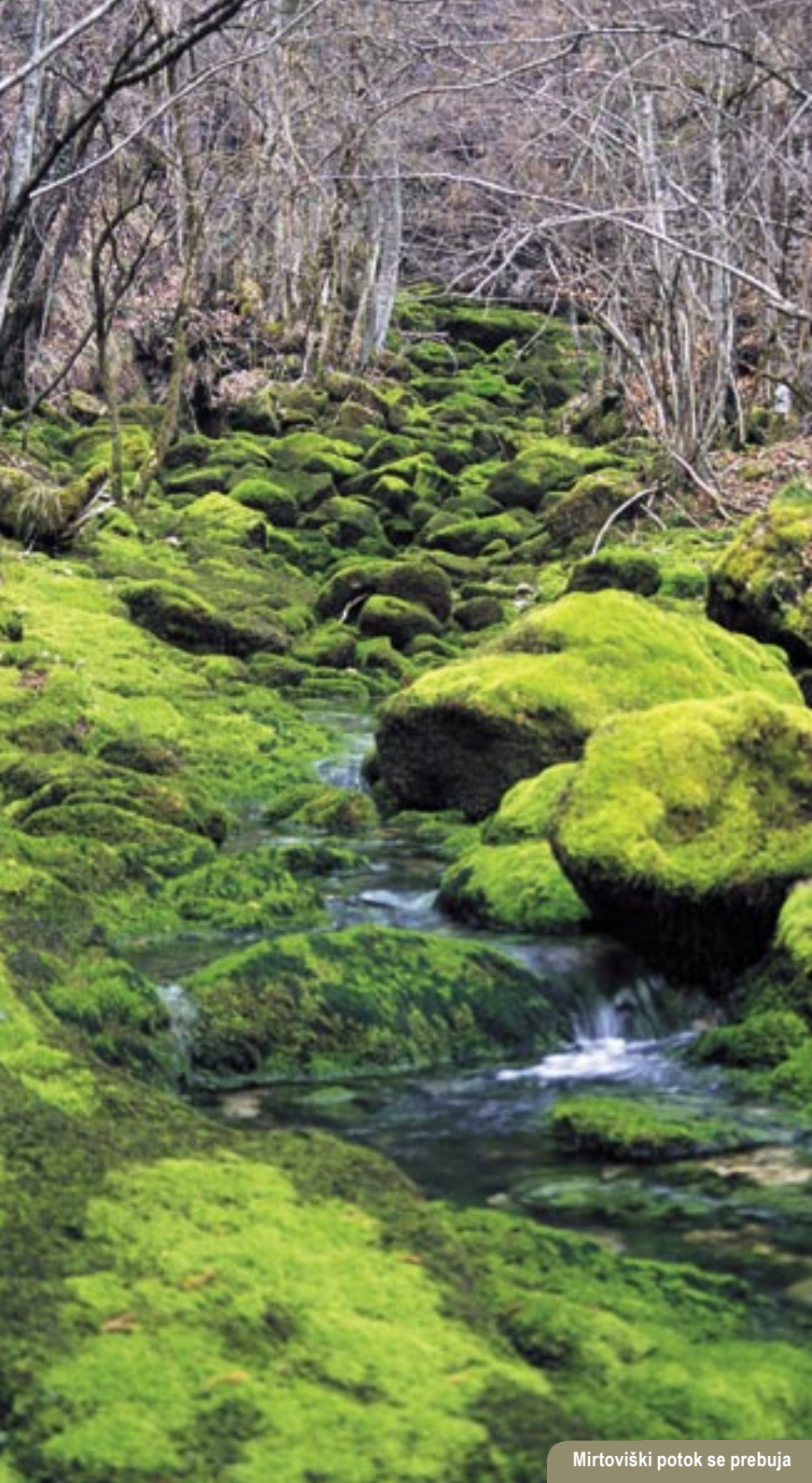
Mirtoviški potok se prebuja