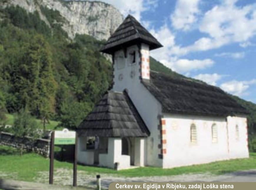
Cerkev sv. Egidija v Ribjeku, zadaj Loška stena

levi se spet zasveti rob stene, do katerega nas loči le nekaj korakov skozi gozd – in vredno se je potruditi. Na bližino sten nas na tej poti sicer opozorijo ponavadi že kriki krokarjev. Bujne trave nas opozarjajo na previdnost, pod nami pa zija globina, še posebej nas navdušijo stebri in izjemen skalni stožec, na »tilniku« ves poraščen s samotnimi borovci.