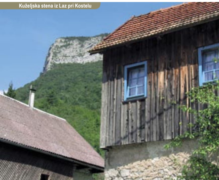
Kuželjska stena iz Laz pri Kostelu

Opis: Pot začnemo v vasici Potok pri Fari, 500 metrov pred mejnim preходом Petrina. Markacije nas povedejo skozi Jakšiče navzgor po asfaltni cesti in mimo samotnih hiš zaselka Planina v gozd. Po širokem kolovozu se vzpenjamo v breg pod Planinsko steno in po nekaj zavojih v dobri uri pridemo na ravnejši svet zapuščene Stružnice. Na manjšem travniku je gozdarska koč, tja gor je nekoč vodila tudi žičnica. Markacija sledi gozdni cesti večinoma po ravnem do naslednje čistine z drugo gozdarsko koč. Takoj za koč krene stezica levo v breg in po krajšem vzponu privede naravnost na vrh Kuželjske stene. Pred nami kot iz letala zazija praznina, globoko spodaj se pokaže zelenomodri trak Kolpe, na hrvaški strani zagledamo Risnjak. Do vrha smo iz doline potrebovali dobri dve uri.