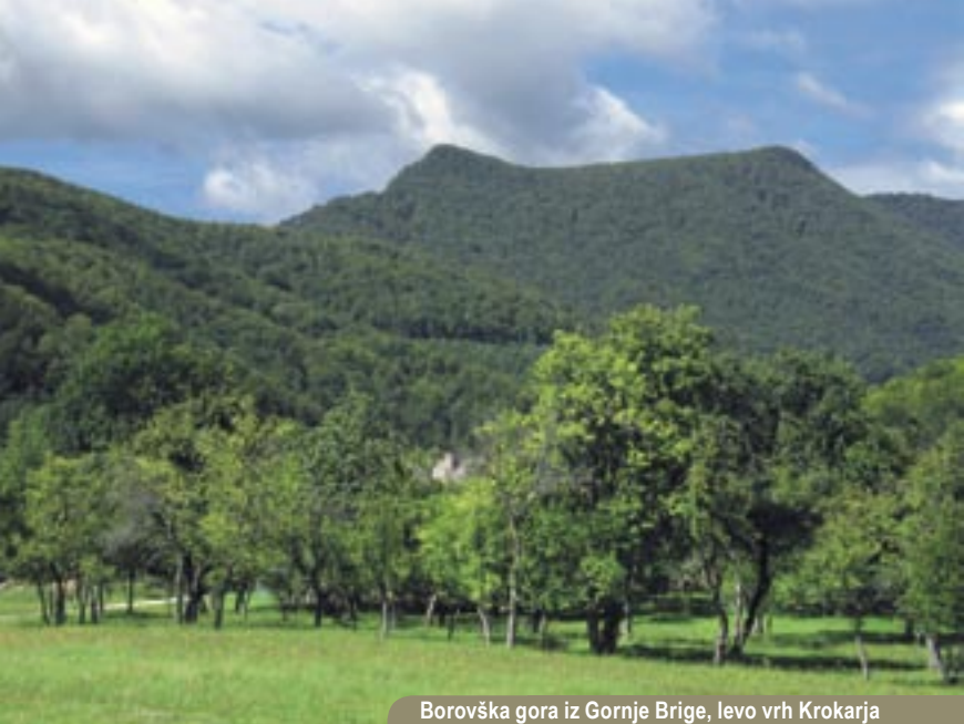
Borovška gora iz Gornje Brige, levo vrh Krokarja

daljnovid, na tistem mestu je pri povratku (če se bomo vrnili po isti poti) možen spust naravnost v Mirtoviški potok. Stezica se od sedla večinoma drži grebena in prekorači Vršak, višje gori pa izraziti vrh Kobile. Hodimo po zračnem slemenu, na levi so pod nami divje razbrazdane sledi potoka Sušica, vse bolj se nad nas sklanjajo tudi navpične stene Krokarja. Desno je globoko pod nami slutiti povirje Mirtoviškega potoka, na drugi strani pa že vidimo Krempe. Stezica se po poldrugi uri hoje »utrudi« in nas poševno povede proti sedlu med Krokarjem in Krempe. Nekaj previdnosti tod ni odveč, saj pod nami pobočja strmo padajo v Mirtoviški potok. Končno nam v lice zapiha severni veter, saj smo na prepričanem sedlu. Le še četrta ure potrebujemo, da smo na vrhu Krempe. Nekoliko pred vrhom nas povabi štrleč skalni nos, da pogledamo na prehojeno pot – z vrha je ne bomo dobro videli, ker je že precej zaraščen. Do vrha Krempe smo iz doline potrebovali dve uri in pol hoje.