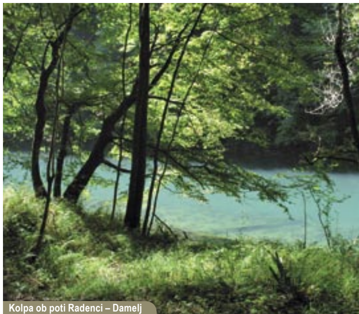
Kolpa ob poti Radenci – Damelj