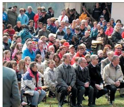
Iz prve vrste so si prireditev ogledali častni gostje.

okoliško prebivalstvo je v popoldanskih urah odhajalo domov, gostje pa so se pri obedu zadrževali v farovžu Sv. Križa, Sv. Helene in Pr Krač v Dolskem ter nazdravljali zvestobi slovanski do naše svetle cesarske hiše. Ko so v večernih urah odhajali z brodom preko Save na železniško postajo Laze, so jih na desnem bregu pozdravljali kresovi in preden so se odpeljali proti Ljubljani ugotavljali, da bi s postaje na Lazah moral biti viden na levem bregu Save postavljen spomenik matematiku, znanstveniku in vojaku, našemu baronu Juriju Vegi.«