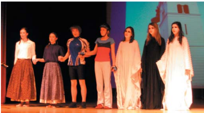
Učenci turističnega krožka na koncu nastopa

Glavna prireditev se je začela ob 14. uri, ko so učenci šol v avli Kulturnega doma predstavili svoje razstave, ob 15. uri pa so se šole predstavile še z odrskimi predstavami. Delo je vseskozi spremljala komisija, ki je v zaključku festivala razglasila dobitnike bronastih, srebrnih in zlatih priznanj. OŠ Jurija in OŠ Dob sta si prislužili zlati priznanji. Na državno tekmovanje, ki bo 20. in 21. aprila v Bovcu pa se je uvrstila OŠ Dob.