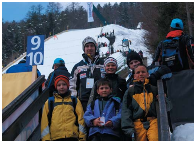
Mladi rod moravških skakalcev v Planici na zaključku svetovnega pokala v smučarskih skokih

Šola si v primeru objektivnih okoliščin pridržuje pravico do spremembe terminov napovedanih dejavnosti.