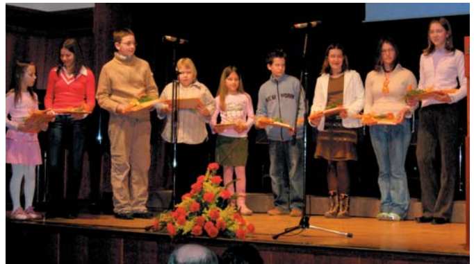
Nagrajenci za izbrana likovna in literarna dela na temo Moj kraj in Kako sem povezan z Jurijem Vego.

bom še naprej na vseh področjih kot do sedaj, dokler bo služilo zdravje, me bo veselilo druženje in se bom dobro počutil.