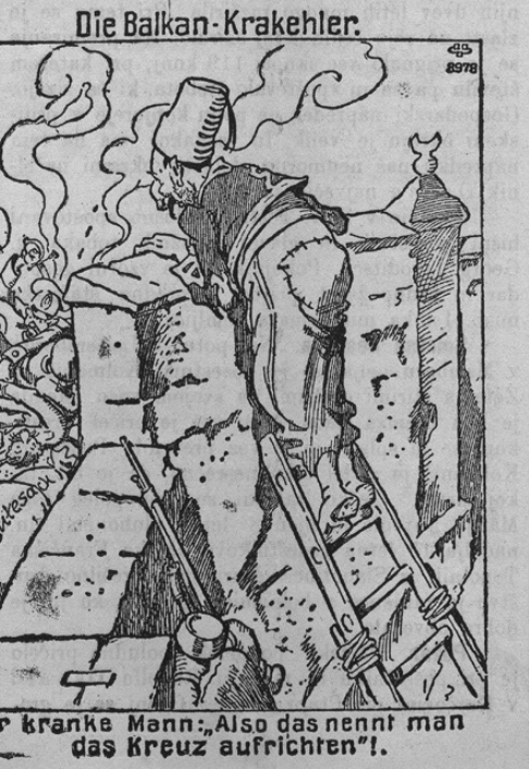
Der kranke Mann: Also das nennt man das Kreuz aufrichten!.

Turek se smeji . . . Prinašamo danes politično šalo, ki prav primerna za sedanje dogodke na Balkanu. Prva balkanska vojna začela se v znamenju križa, kakor so Srbi, Turci, Grki in Črnogorci strmelemu križu naznanjevali. Vrgli so Turka iz Srbije. In zdaj? Zdaj se bijejo med seboj za plen, zdaj so raztrgali svojo postavo, zdaj držijo drug drugega pri grlu, zdaj se medseboj še mnogo bolj divje borijo . . . Križ je znamenje krščanskega bližnega. V tem znamenju so se pa sedanji vojni. Zdaj pa, ko je križ nad znanostjo zmagal, razbili so bivši zapovedniki sami križ in z njegovimi kosi raztrgali drug po drugem . . . To žalostno stanje karikira naša slika. Ob zidovju v mesecu vidimo na lestvi Turka stati in se ozirajo gledati; tam onkraj se pa za 5 metrov in pobijajo krščanski zavezniki med seboj, za plen, za zemljo, ki so jo z njihovimi močmi ugrabili Turku. Po krvi tečejo. Turek na lestvici pa . . . „Torej to se pravi križ postaviti.“