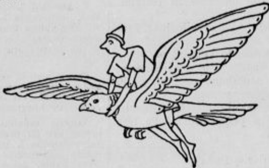
Golob se je vzpel in v par minutah je priletel tako visoko, da se je dotikal skoro oblakov.

Privoščila sta si še malo prigrizka in se opremila, potem pa naprej! Drugo jutro sta dospela na morskobalo.