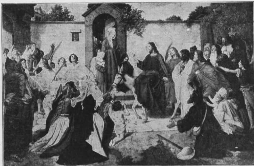
Hozana sinu Davidovemu!

Dva dni po tem slavnostnem sprevodu je šel učenik, bilo je na večer, zopet po poti iz Jeruzalema v Betanijo. Sam je šel in videlo se mu je, da je globoko zamišljen. Zlati žarki zahajajočega solnca so obsevali njegovo glavo in se igrali s kodri njegovih las. Tihota je vladala po