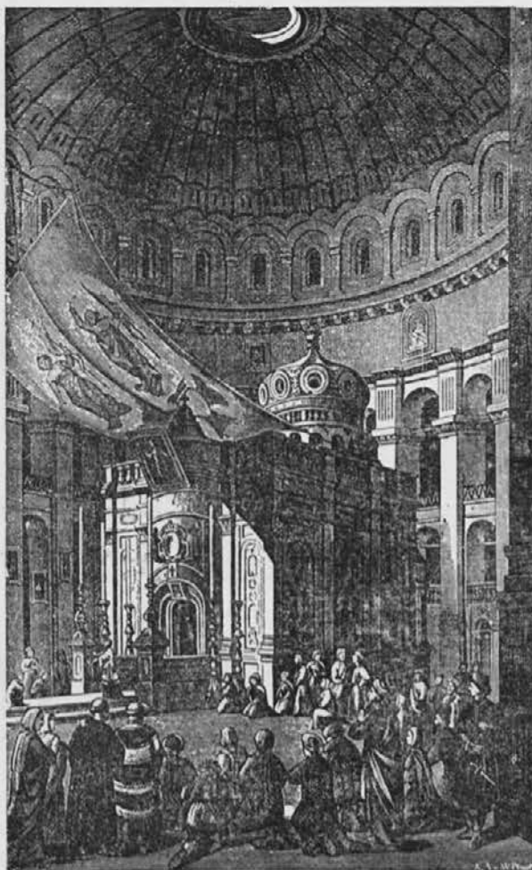
Cerkev božjega groba.

nauka. Vsled napovedi Jezusove je bil razdejan Jeruzalem in sedanji kristjani, pomneč besed Kristusovih so zbežali iz Jeruzalema onostran Jordana. Toda kma-