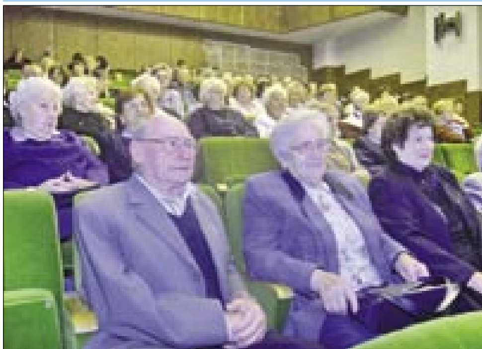
Gledalci so bili najbolj navdušeni nad programom Mladinskega pevskega zbora iz Litije