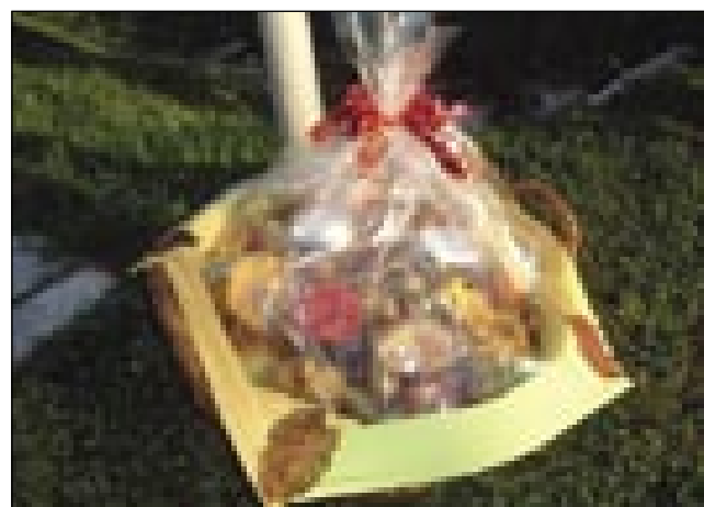
Košar iz Števanovec z domanjimi dobrautami

Mlajši so se dobro gora najšli, nika so nej zabrajali, so lepau baugali skaus dva dni, ranč tak gimnazijci. Bili so vrli, ka zvōjn nji hvali njive stariše pa školnike tū. S strani Slovenske zveze se vsejm nastopajočim, mentorom, harmonikari lepau zahvalimo za lejpi program. S strani vsej nas, steri smo leko uživali gostoljubje vodstva društva, se pa lepau