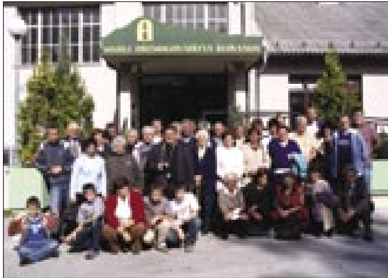
Sakalauvčarge pred muzejom v Velenji

7. oktobra je sakalovska slovenska samouprava organizirala izlet v Slovenijo. 47 ljudi se je