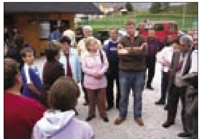
Gasilci iz Doliča so se dosta trüdili za nas

Gorenje pošilajo te aparate po cejloj Europi. V Šoštanjji je termoelektrarna, stera dava 40 procentov elektrike, stero nüca Slovenija. Po ogledi smo šli v cerkev sv. Mihaela, tam so nas župnik mešo služili, mi smo pa spejvali. Ta cerkev je tö stara, trikrat je bila obnovljena. Gnauk so go Törki porüšili, drugič go je požar vničo, od tretjim pa je bila v drugi bojni poškodova-