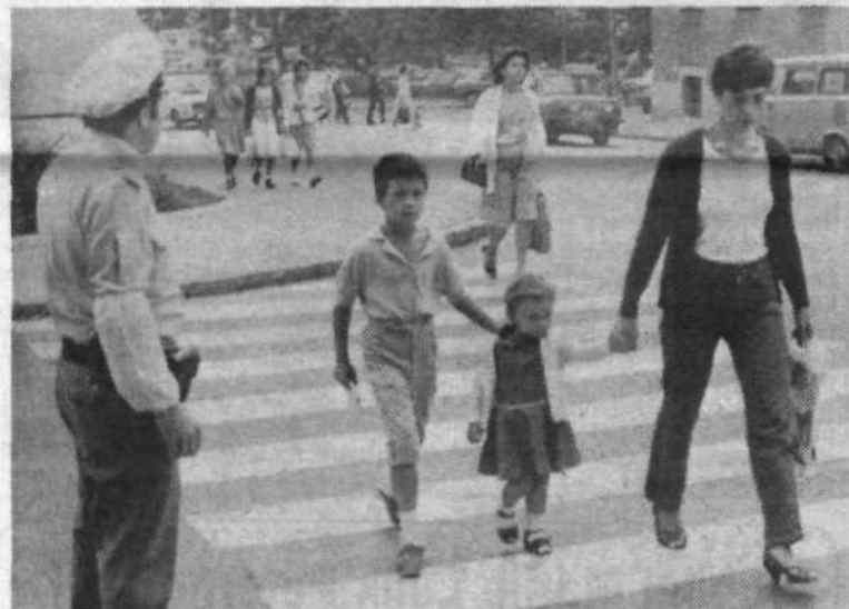
Na prvi šolski dan so bili na nogah vsi, ki lahko kakorkoli poskrbijo za varnost naših najmlajših. V številnih krajevnih skupnostih so milicnikom priskočili na pomoč tudi pripadniki civilne zaščite.

OBČINSKA RAZISKOVALNA SKUPNOST LJUBLJANA CENTER