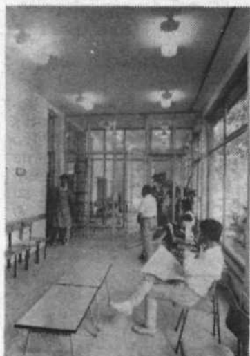
Ambulanta Prule je skoraj povsem obnovljena, medtem ko se ambulante Mirje doslej še niso pritaknili kljub temu, da je sklep nedvoumen: obnovljena bi morala biti do letošnjega septembra.