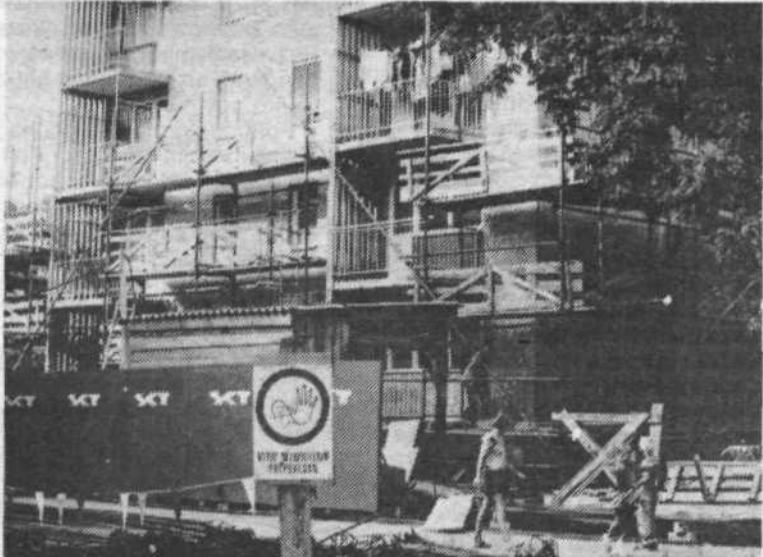
Ko so odprli temelje in odkopali omet, se je pokazalo, da je stanje še znatno slabše, kot so kazale zunanje razpoke in poškodbe. Odkrili so celo mesta brez malte oziroma betonskega veziva in ni čudno, da je nekdo ob takem odkritju v vhodni veži napisal z velikimi črkami »Sramota!«.

»Sele ko so decembra leta 1983 s tem seznanili predsednika občinske skupščine in predsednika izvršnega sveta naše občine ter ko sta delegaciji za skupščino stanovanjske skupnosti in za skupščino občinske skupščine s tem seznanili nekajkrat naj-