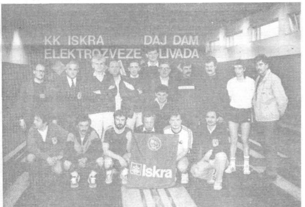
Člani reprezentance Ljubljane s kegljači SOZD Iskra

V Kegljaškem klubu Iskra – Elektrozeve, ki je za zdaj edini tovrstni klub v naši občini (trenutno šteje 167 članov), z vso resnostjo skrbijo tudi za svoj podmladek. Prav na začetku letošnjega leta je stekla šola kegljanja za pionirje in mladince, ki jo vodi jo fantje, ki so opravili poseben seminar za trenerje.