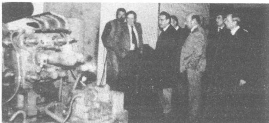
Predstavniki občinske skupščine, izvršnega sveta, družbenopolitičnih organizacij, OZ ONIKS so si ogledali obratovalnice štirih zasebnih obrtnikov. V pretežno sodobno opremljenih prostorih, tako kot pri Lampiču, so lahko spoznali, da je le s prehitvajanjem splošnega razvoja mogoče dosegati dobre rezultate. Žal pa jih v zadnjem času močno duši pomanjkanje surovin ter počasno plačilo dela s strani naročnikov.