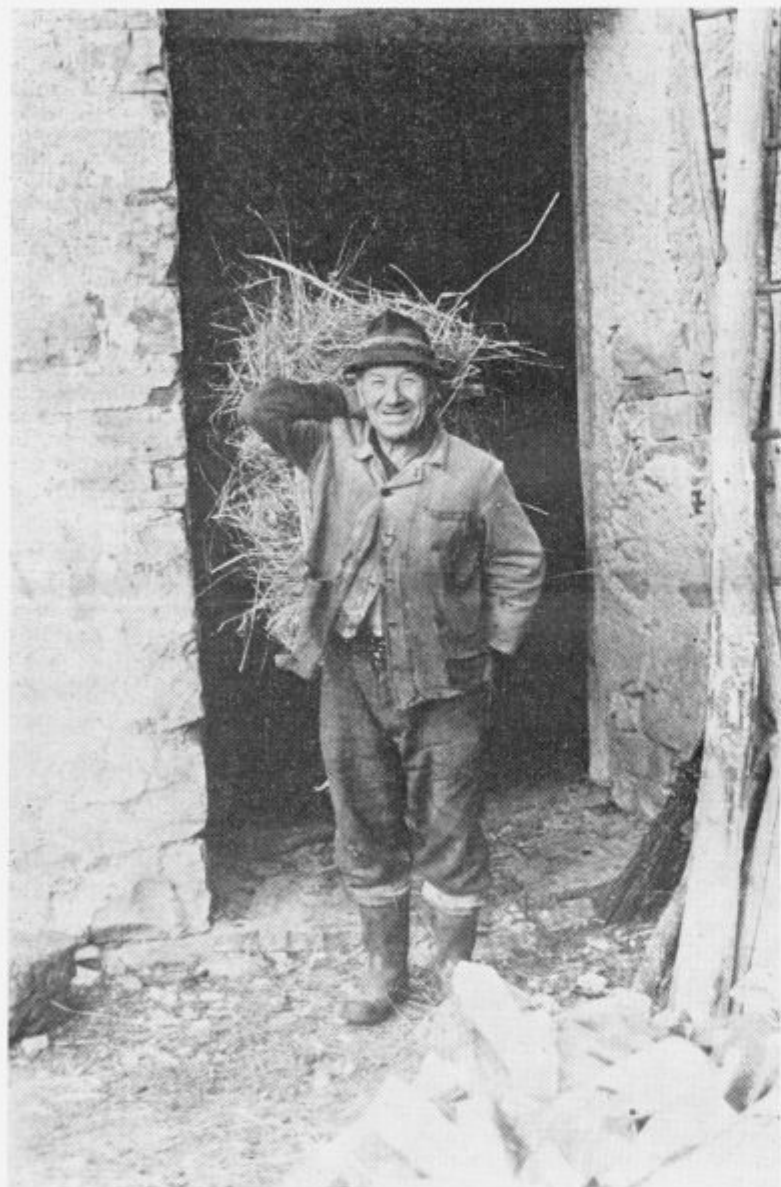
Mož iz Doljnega Zemona s košem sena na ramah

Domov prihajajo največ poleti, ko je toplo, da se oddahnejo in da pogledajo, kako in kaj se živi