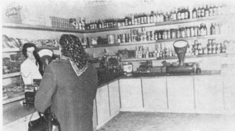
Trgovsko podjetje »Preskrba« iz Sežane je pred kratkim odprlo v Podgradu novo sodobno trgovino in delikateso. V kratkem bo svoje prostore v tem kraju še razširilo