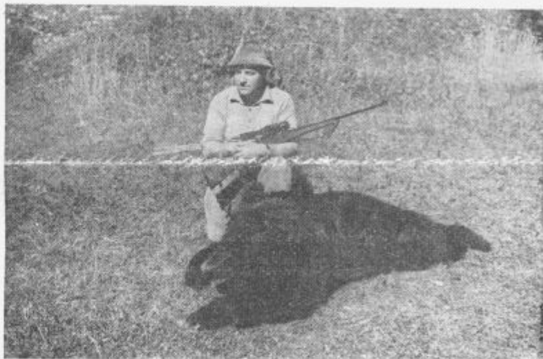
Lovec z uplenjenim medvedom — 200 kg težko zverino

kar je precej manj kot lani in veliko slabše od optimističnih (Nadalj. na 2 str.)