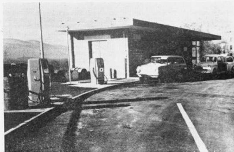
Nova bencinska črpalka podjetja Istra-Bene iz Kopra v Podgradu