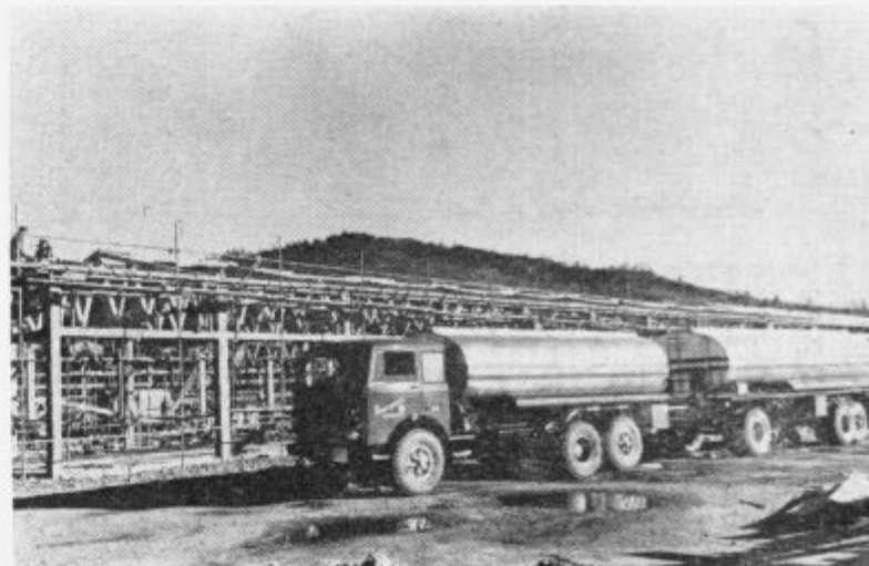
Nova servisna dvorana za popravila avtomobilov Transporta Ilirska Bistrica, ki bo pod streho in usposobljena za delo čez zimo. Gradbena dela in oprema bosta veljala okrog 800 milijonov S din

opravlja prevozne usluge in popravila vse vrste motornih vozil — iskreno čestita ob dnevu republike vsem delovnim kolektivom, svojim poslovnim prijateljem in prebivalcem občine Ilirska Bistrica.