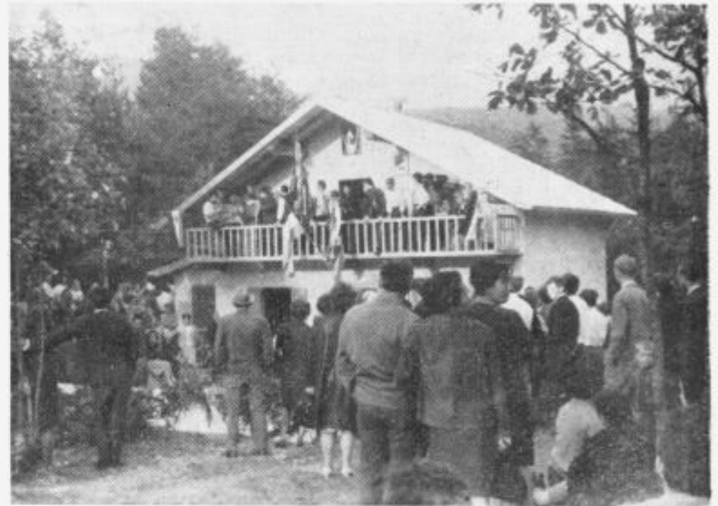
Nova lovska koča »Devin« nad Koritnicami

številne pripombe slišijo v trgovini od kupcev. Povedati moramo resnico, da se prav v tej trgovini lahko sporazumete v tistem jeziku, v katerem pač to želite, se prijazno pogovorite, poleg tega pa so vam pripravljene nuditi potrebne nasvete pri nakupu enih ali drugih predmetov. V nadaljnjem pogovoru nam je zastopnik firme povedal tudi to, da so nekateri časopisi prinesli netočne podatke, da se tu prodaja medenina namesto zlata, da teže ne odgovarjajo, kar pa seveda ni res, saj je naš ponos, če zadovoljimo kupca, ker vemo, da bodo dobro postreženi kupci privabili še druge. Poslovni prostori prodajalne, ki je gotovo ena od največjih v Trstu, je zelo lepo in okusno opremljena in urejena, zaradi velikega prometa pa razdeljena na dva oddelka, od katerih je eden v prvem nadstropju, eden pa v drugem.