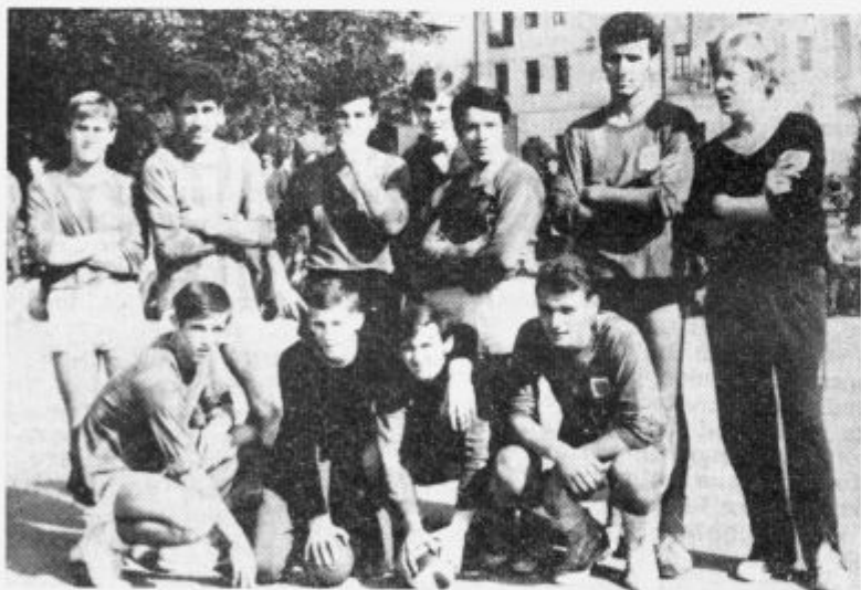
Rokometiški Topola, ki se uspešno bore za točke v svoji podzvezni ligi.

Cesta na Snežnik se, kakor pravijo smučarji in drugi, podira. Zdaj bi morda njeno popravilo veljalo malo, čez leta pa bo veliko.