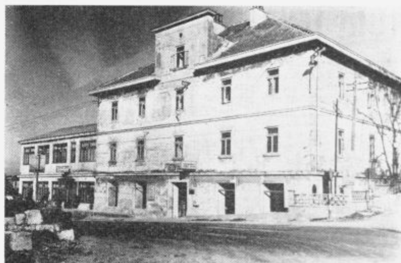
Objekt v Podgradu, ki bi se lahko s primerno investicijo preuredil v hotel s 70 ležišči. Rentabilnost bi bila zagotovljena, stroški bi znašali okrog 100 milijonov S din. Kdo bo investitor?

Mnenja smo, da tu ne bi smelo biti nobenih ovir in zadržkov, če se oba partnerja enako vrednotita. Ne bi pa bilo prav, če bi zaradi tega, ker trenutno družbeni sektor ne razpolaga s potrebnimi sredstvi, onemogočali zasebno pobudo, ki nas bo lahko samo razbremenila pri številnih problemih, ki jih imamo pri naši turistični izgradnji. Letos smo imeli nekaj primerov, ko so zasebni gostilničarji s potrebnimi dokumentacijami zaprosili pri bankah za kredite, s katerimi bi uredili že obstoječe obrate, toda žal nitj en zahtevek, ki je bil vložen, ni bil rešen, nitj niso prosilci dobili od bank ustreznih odgovorov. Odgovori so bili le osebni, kj so pa temeljili na tem da trenutno banke ne razpolagajo s potrebnimi sredstvi za kreditiranje zasebnega sektorja gostinstva, čeprav so le-tj ponudili izredno dobre in sprejemljive pogoje tako glede višine obrestne mere, kot tudi glede roka vračanja kredita. Prav bi bilo, da bi o tem začeli že zdaj razmišljati, tako da bi lahko pravočasno ukrenili to, kar se ukreniti še da, kajti v nasprotnem primeru bo teh iniciativ vedno manj, problemi pa seveda iz leta v leto večji. Omogočimo vsakomur, kj želi vložiti svoja lastna sredstva za napredek turizma, spremenimo predpise, ki so preveč togi in vsestransko razvijamo naš domači turizem!