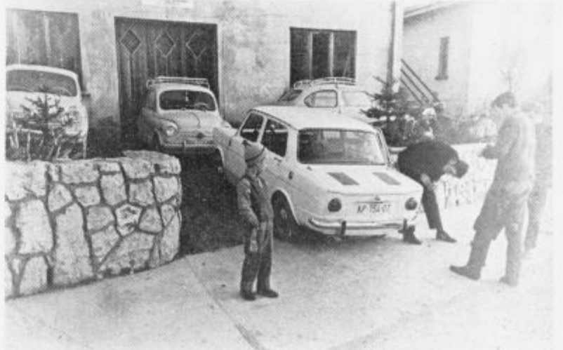
Avtomehaničnih delavnic je še zmeraj premalo v Ilirski Bistrici