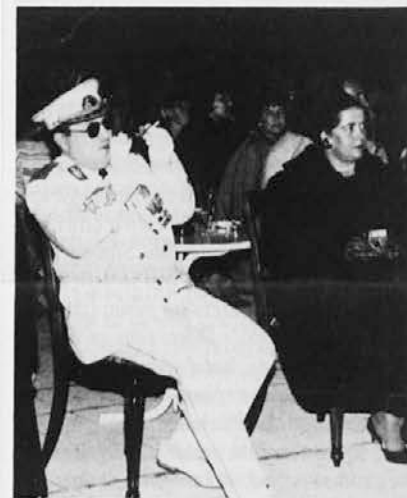
»Maršal« s sporogo Jovanko

V Gorici je po nekajkratnem prenašanju zaradi slabega vremena le bil izpeljan letošnji Pajk's show, ki je dejansko osrednja goriška letna satirična prireditev. Na tem srečanju se namreč dobijo skorajda vsi slovenski goriški veseljaki, ki se norčujejo iz sebe in naše in vaše manjšinske stvarnosti. Da bi zabava bolj uspela so medse letos povabili maršala Tita, ki je prišel v spremstvu Jovanke z belim mercedesom. Presenetljiva podobnost igralke Jovanke je sprva kar nekako zasenčila slavnega »maršala«, ki je bil zelo dober, saj se je za obisk v Štandrežu pripravil in je pokazal, da pozna tudi zamejsko stvarnost, kar za vse slovenske prave politike ne moremo reči. Med enim potegom