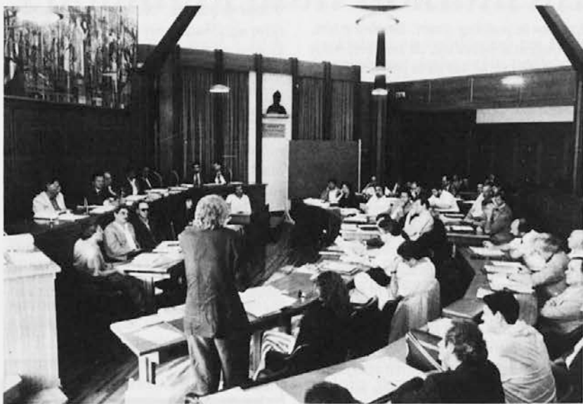
Goriški občinski svet tik pred razpustom