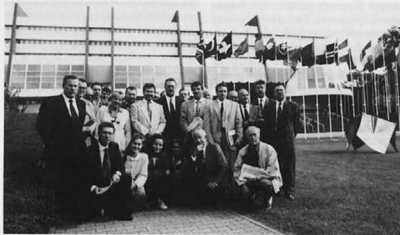
Slovenski predstavniki pred sedežem Sveta Evrope v Strasbourgju