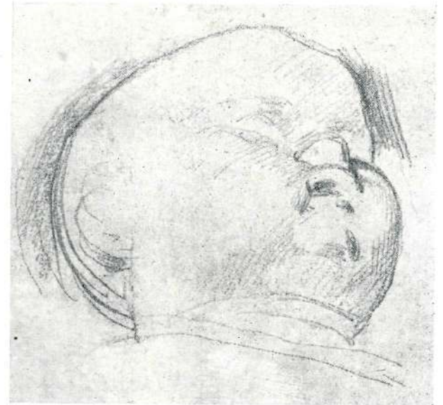
9. Študija otroške glaviče za sliko sv. Martina.

Kako se je bavil z oblikovanjem bolnice, sem omenil že zgoraj pri označevanju celotne kompozicije. Posebnih študij imamo — dosedaj — osem. Vse se drže temeljne ideje, da naj bolnica leži pred