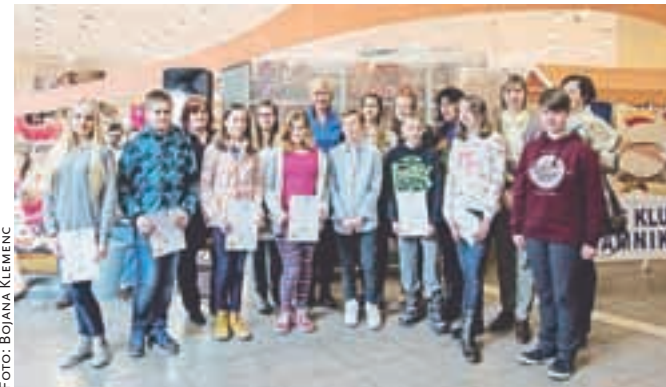
Vsi sodelujoči kamniški učenci so na odprtju razstave Plakat miru – Mir povezuje prejeli priznanja.

V organizaciji Lions kluba Kamnik je v Qlandiji Kamnik potekalo odprtje razstave Plakat miru.