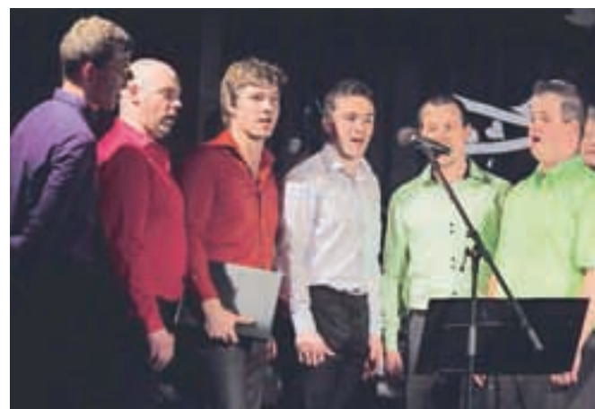
Ob dnevu žena in na gregorjevo so v Lazah nastopili Šmartinci.

Večer je vsekakor poskrbel za posebno energijo, ki jo lahko pričara le kombinacija mladosti, ubranega petja ter poleta ljubezni in topline, česar ni manjkalo niti na odru niti v dvorani. Občinstvo je bilo enotnega mnenja: »Hochemo še in še velikokrat!«