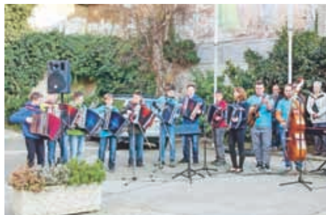
Meh so na široko raztegnili učenci Šole harmonike Martina Vodlana.