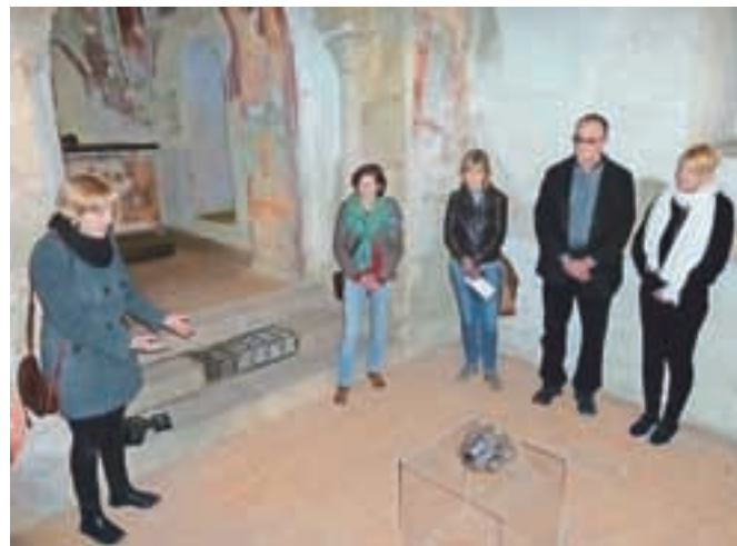
Malograjska kapela s svojim ambientom navdušuje tudi umetnike.