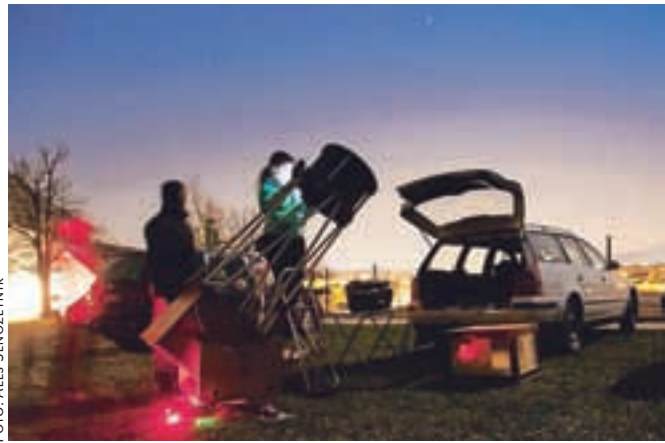
Tradicionalno spomladansko javno opazovanje nočnega neba na Zapricah je tudi letos privabilo veliko obiskovalcev.

Člani Astronomskega društva Komet in Raziskovalno-astronomskega krožka GSŠRM Kamnik so pred dnevi pripravili tradicionalno spomladansko javno opazovanje nočnega neba na Zapricah, ki ga pripravljajo že petnajst let.