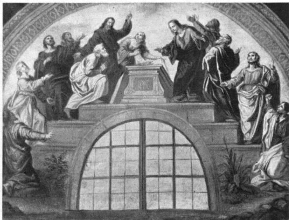
15. avg.: Apostoli ob Marijinem grobu. Nekdanja freska M. Langusa v frančiškanski cerkvi v Ljubljani.