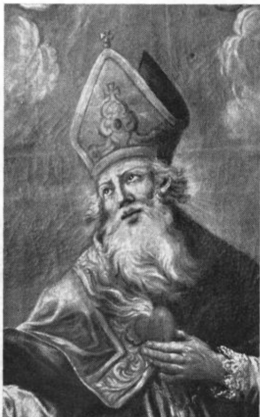
28. avg.: Sv. Avgustin. Reinwald. Uršulinke, Ljubljana.

gacija zahteva cele ljudi, ki svoje globoko versko prepričanje izžarevajo tudi na zunaj. Vsak kongreganist in vsaka kongregacija mora biti kakor močan motor živahnega katoliškega gibanja, živa celica božjega kraljestva, vnet apostol za vsako dobro stvar.