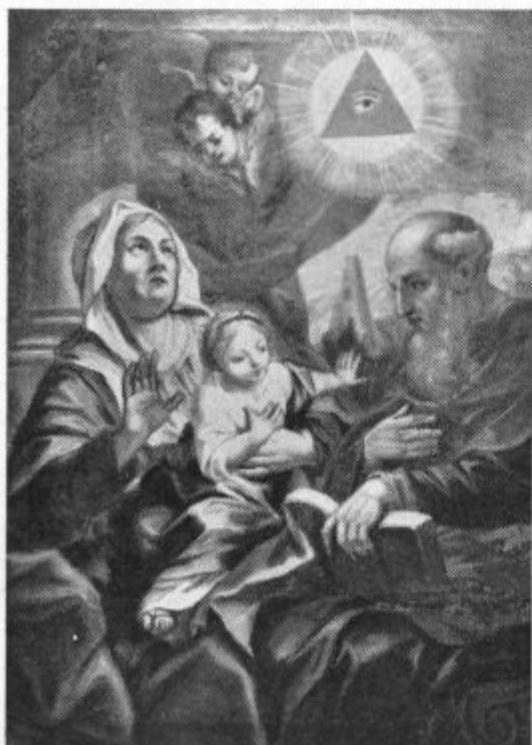
16. avg.: Družina sv. Joahima. Uršulinke, Ljubljana.