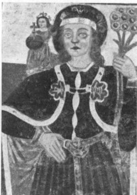
16. avg.: Sv. Krištof. Poznogotska freska pri Sv. Urbanu nad Trato.

To naj velja posebej našim možem in fantom in našim izobražencem. Zakaj če je sv. Avguštin, ki je bil tako odličen in prosvetljen duh, kazal tako nežno ljubezen do Matere božje, potem je gotovo, da češčenje Matere božje ni nekaj mehkotnega, nekaj sentimentalnega, nekaj,