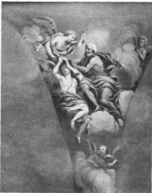
21. sept.: Sv. Matej. M. Langus. Ljubljanska stolnica.

sinko na mizo in sname s težavo križ s stene. »Kaj pa vendar počenjaš?« ga nahruli oče. »Božjega Zveličarja bom odnesel,« se odreže dečko, »da ne bo prisiljen poslušati teh ljudi, ki tako grdo preklinjajo.«