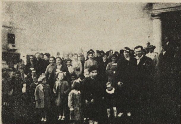
Pred cerkvijo na Saavedri. 1. avgusta oblet- nica slov. maše.

Tedaj ko je vse drugo odreklo spet postane dober stari Bog!