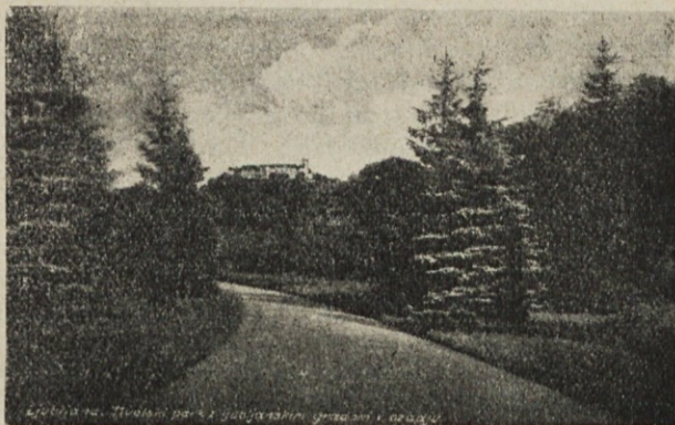
Pogled na Ljubljano, srce Slovenije.

Kmalu po izbruhu svetovnega vojnega požara v Evropi je bilo tudi vsem trezno mislečim Slovincem jasno, da je prišel tudi za slovenski narod veliki čas, ko bi se dala izvojevati narodna svoboda. Vsi smo bili takoj prepričani, da bo Avstrija propadla.