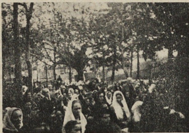
V Lurdu se je zbralo 30. maja 700 Slovencev.