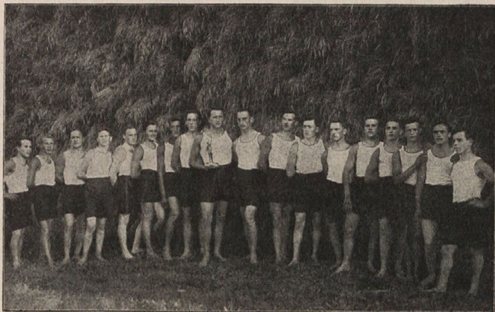
Zmagovalci s slafetne tekme ljubljanskega orlovskega okrožja v Šmarju 31. avg. 1927 — vsi člani odseka „Ljubljana-Sv. Peter“.

Nehote preide velika telovadska volja in zatajevanje samega sebe tudi na druge duševne lastnosti. Človek uvidi, da je treba tekrovati tudi v delu: če sem študent, hočem biti prvi, če sem kosec, hočem največ nakositi. Baš naša društva na deželi nam pričajo, da so telovadci taki: s svojo pridnostjo se uveljavijo na odru, v pevskem zboru ali kjerkoli. Velik greh je lenoba, ki se pa tudi da odpraviti s telesnimi vajami. Da telovadec tudi lenobe ne pozna, se kaže v tem, da ne prespi nedeljskega popoldneva, temveč gre s tovariši ali na izlet ali v telovadnico. Dolgčas je znamenje duševno-telesne bolezni, lenobe. Je telovadcu kdaj dolgčas? Kadar je duševno izmučen, gre na igrišče, ko ga noge bolijo, čita knjigo in tako se vrti kolo življenja. Največja vzgojna vrednost telovadbe je namreč v tem, da zaposluje človeka in mu izčrpa energijo, ki bi jo sicer porabil sebi v škodo.