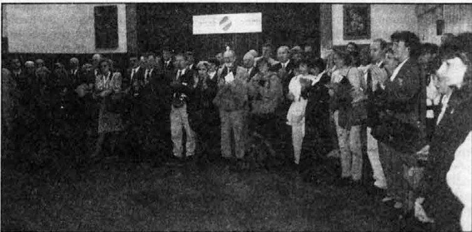
Eno izmed srečanj Zbornice v prostorih Slomškovega doma