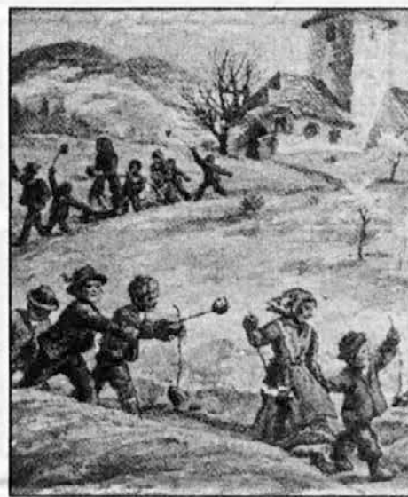
M. Gaspari: Z velikonočnim ognjem domov

"Jezus je od smrti vstal Od njega britke martre Nam je se veseliti Nam hoče k tróštu biti Kyrie eleison..."