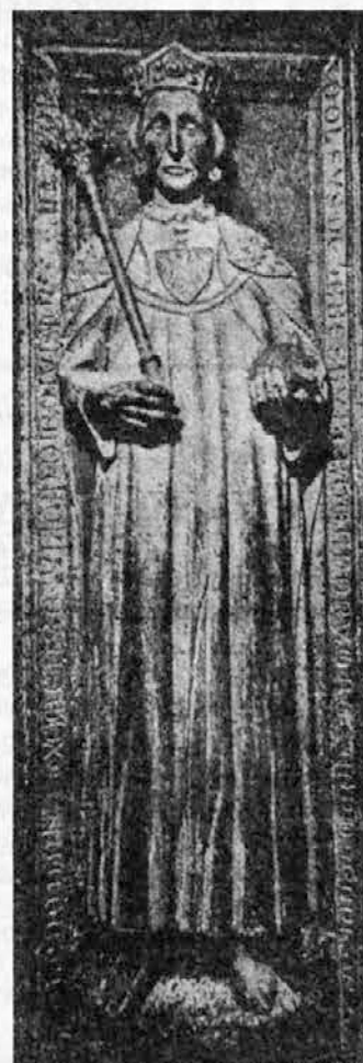
Nagrobni spomenik Rudolfa Habsburškega

Cesar je nato podelil vojvodino Avstrijo in Štajersko z grofijo Kranjsko leta 1282 svojima sinovoma Albrehtu I. in Rudolfu II. Vojvodino Koroško pa je dal v fevd Majnhardu Goriško-Tirolskemu (so ga ustoličili) kot nagrado za pomoč v boju s češkim kraljem. Ko so čez nekaj desetletij izumrli tudi grofje Goriški, so dobili tudi to vojvodino Habsburžani.