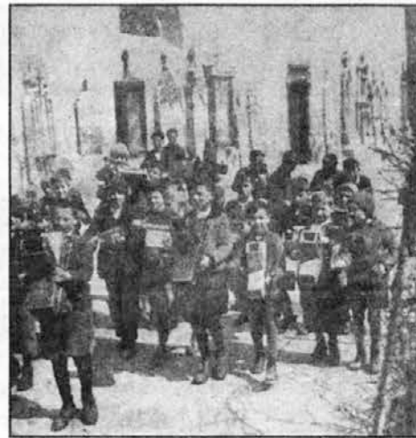
Ragljači iz Tržiča