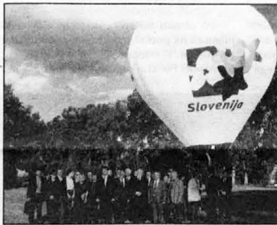
Obisk delegacije Gospodarske zbornice iz Slovenije

Med delo navzven spadajo tudi stiki, ki jih je zbornica gojila do sličnih ustanov v ZDA in Kanadi. Uradno se je udeležila tudi prvega srečanja Slovenskih gospodarstvenikov z vsega sveta, ki ga je septembra 1999 v Ljubljani organiziral Svetovni slovenski kongres. Zbornica je tudi posredovala informacije in stike ter spodbujala člane k udeležbi pri trgovski delegaciji, ki jo je v Slove-