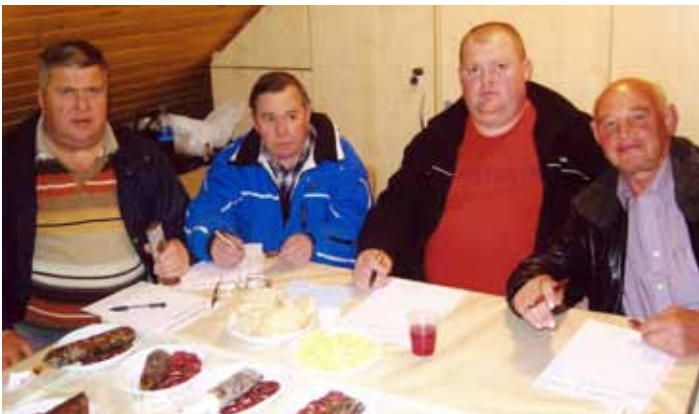
Člani ocenjevalne komisije