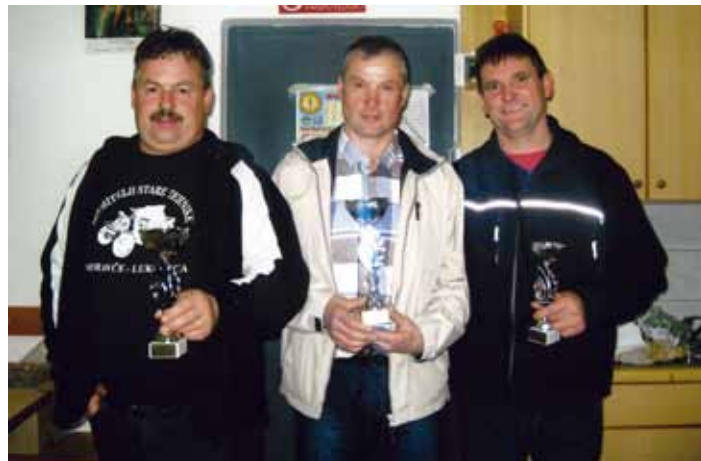
Najboljši Zlatopoljski šahisti

Zimski šahovski turnir je tudi letos doživel svoj zaključni epilog v marcu. Prve igre so se začele takoj po novem letu, razburljiva srečanja pa so se nadaljevala vse do marca, ko je bila odigrana še zadnja šahovska partija.