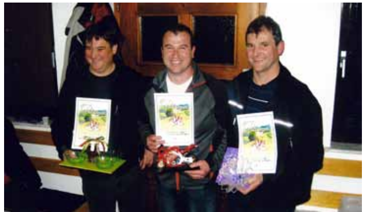
Nasmejani obrazi po razglasitvi