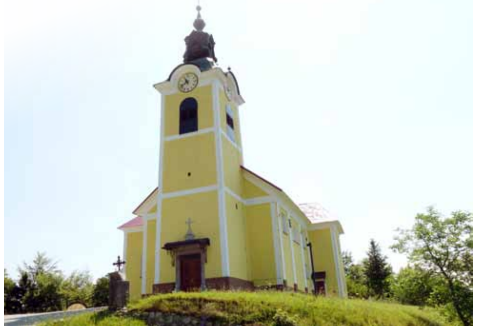
Župnijska cerkev Karmelske matere božje v Česnjicah, avtor: Stojan Majdič