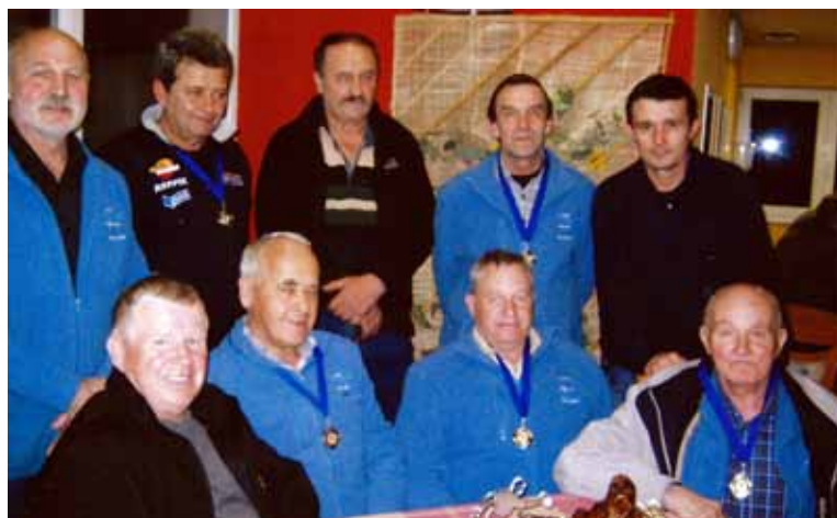
Skupna slika prevojskih veteranskih balinarjev