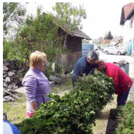
Takole nastaja butara