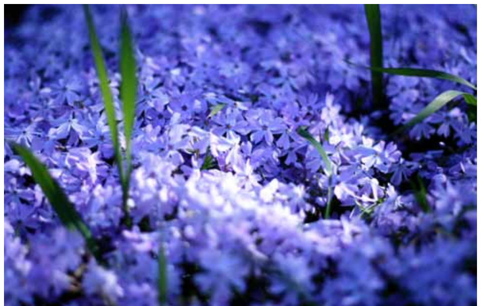
Narava se je odela v pomladne barve

ROKOVNJAČ je glasilo Občine Lukovica. Brezplačno ga prejemo vsa gospodinjstva občine Lukovica; odgovorni urednik: Leon Andrejka; uredniški odbor: Milena Brađač, Vincenc Jeras, Jaka Kersnik in Marko Juteršek; ustanovitelj: Občina Lukovica, Stari trg 1, 1225 Lukovica, tel. 01/729 63 00, gsm: 051 365 992, jezikovni pregled: Primož Hieng; spletna stran: www.lukovica.si , e-mail: rokovnjac@lukovica.si ; produkcija: IR IMAGE, Medvedova 25, Kamnik; trženje oglasnega prostora: IR IMAGE, Medvedova 25, Kamnik; naklada: 1.950 izvodov. Glasilo sodi med proizvode, za katere se obračunava 8,5 % DDV (Ur. l. RS št. 89/98). Rokovnjač je vpisan v evidenco javnih glasil Ministrstva za kulturo RS pod zaporedno številko 1661 in v razvid medijev Ministrstva za kulturo RS pod zaporedno številko 380. Uredništvo si pridržuje pravico do krajsanja besedil glede na tehnične in materialne možnosti. Nenaročenih člankov ne honoriramo. Članki v rubriki pisma bralcev in politika niso lektorirani. Na naslovnici: Narava se prebujajo