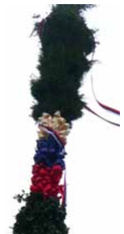
Vrh butare v barvah slovenske zastave