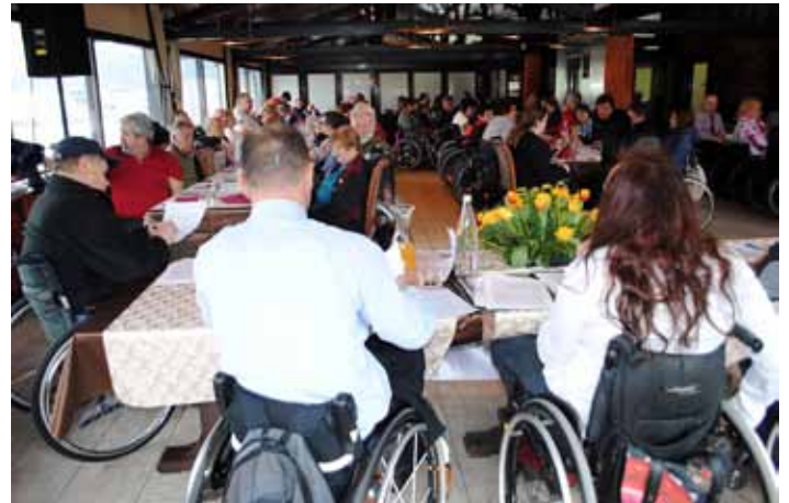
Društvo združuje člane 38 občin.