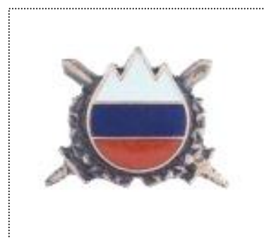
•bronasti znak najboljšega vojaka