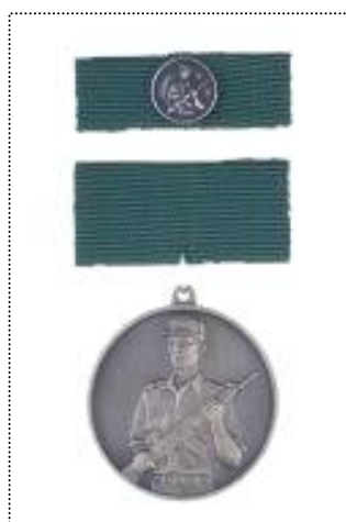
• srebrna medalja najboljšega vojaka