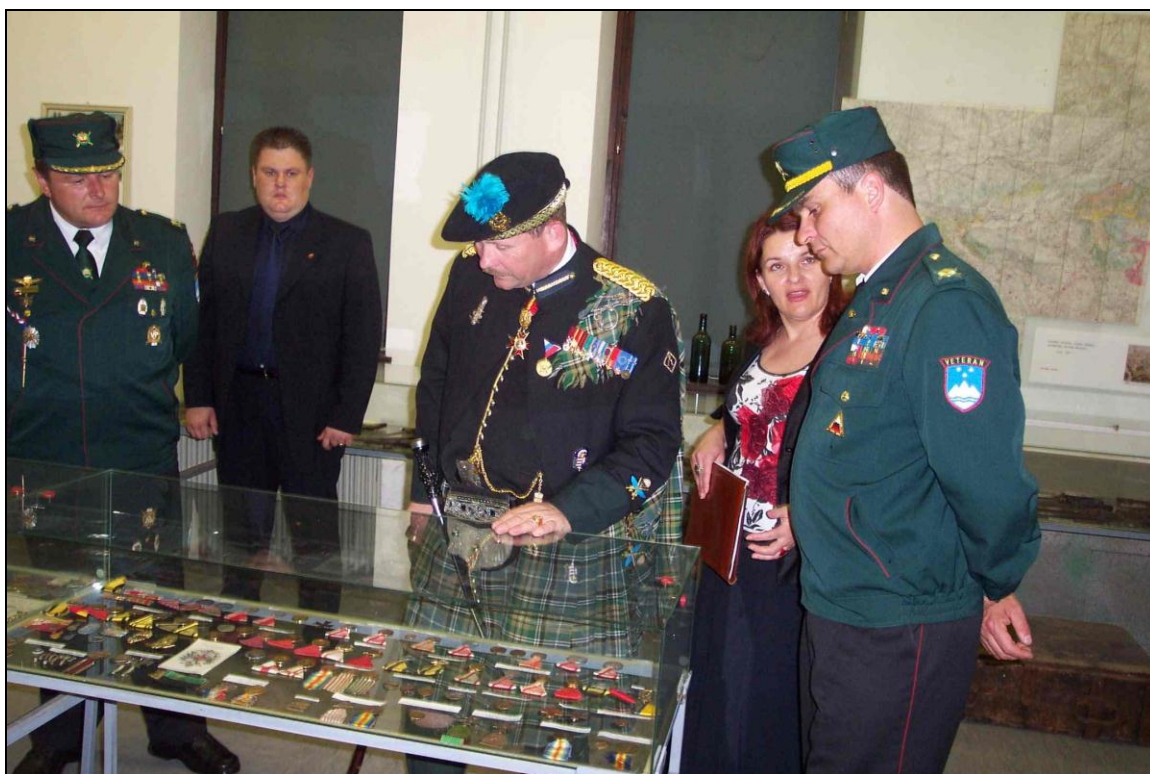
Med ogledom muzejske zbirke v Vipavi