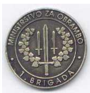
1. brigada SV