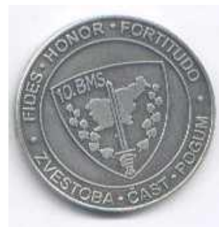
10. bataljon za mednarodno posredovanje