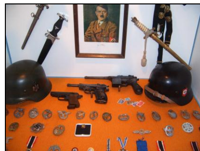
Fotografije iz vojaškega muzeja Idrija lasnik je Slavko MORAVEC