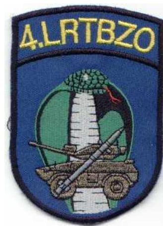
4. LRTBZO – Cerklje ob Krki