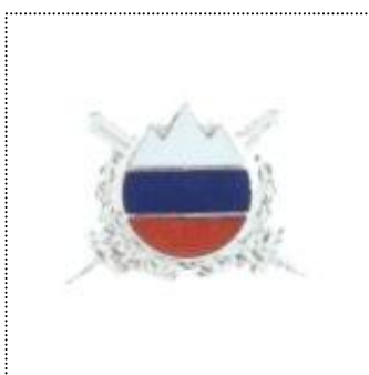
•srebrni znak najboljšega vojaka