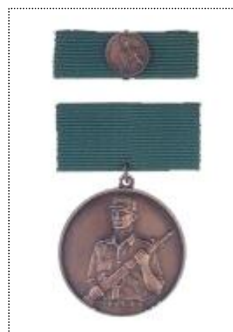
• bronasta medalja najboljšega vojaka