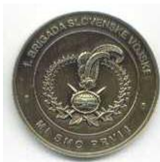
1. brigada SV