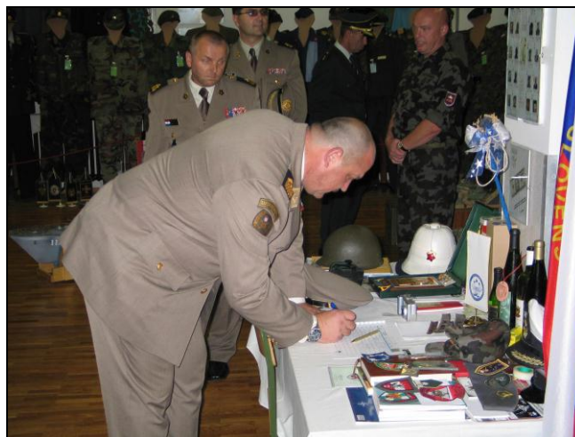
g. general se vpiše v knjigo gostov