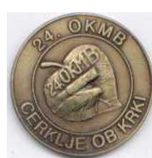
24. OKMB - Cerklje