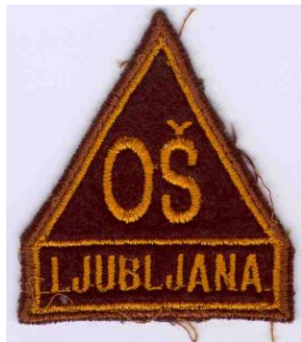
Območni štab LJ