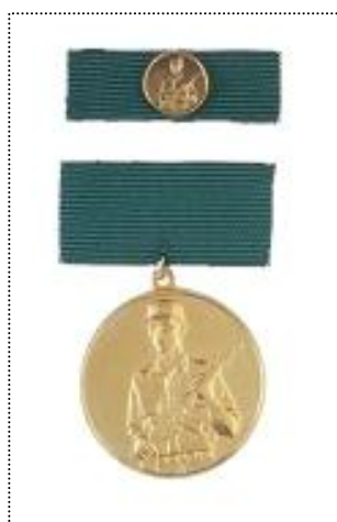
• zlata medalja najboljšega vojaka