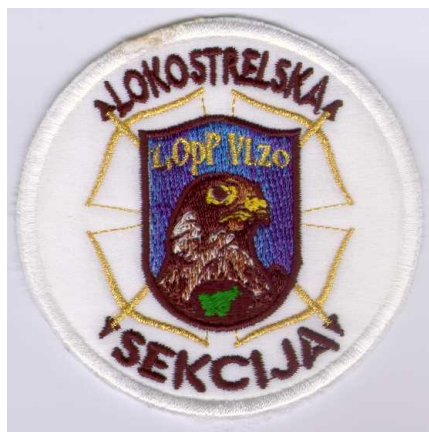
Lokostrelska sekcija – 1.OpP VLZO