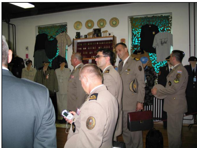
visoki časniki HV na ogledu v muzeju

Ko si je g. general ogledal zbirko je bil prijetno presenečen nad velikostjo in seveda tudi sam dodal (kamenček v mozaiku) namizno zastavico kopenske vojske Hrvaške, ki jo je moč sedaj videti v muzeju. ❖