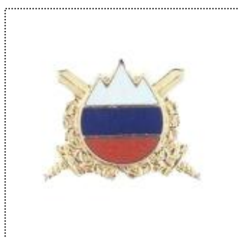
•zlati znak najboljšega vojaka

Priznanje ima tri stopnje in se podeljuje kot: