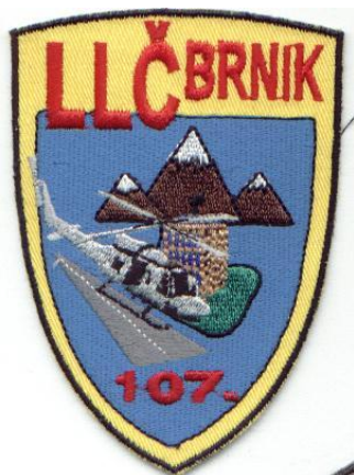
107. Log. Letalska četa