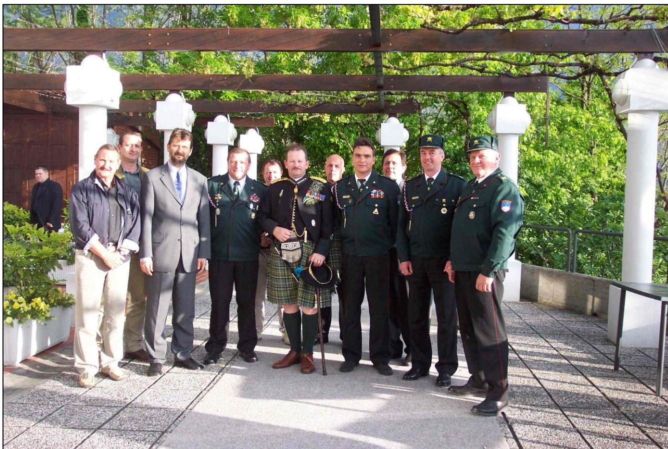
Z gostitelji na Svetem Marku