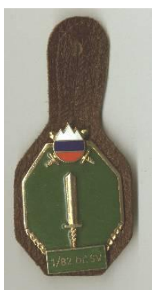
1/82 br SV