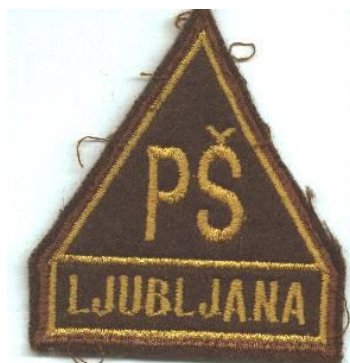
Pokrajinski štab LJ