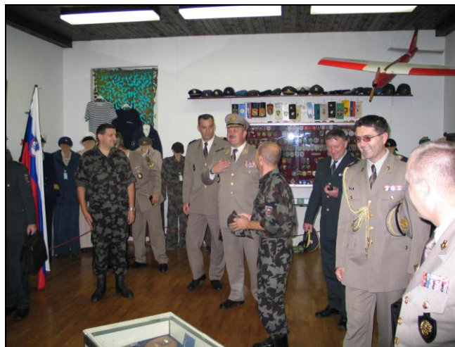
G. general v pogovoru z prisotnimi.