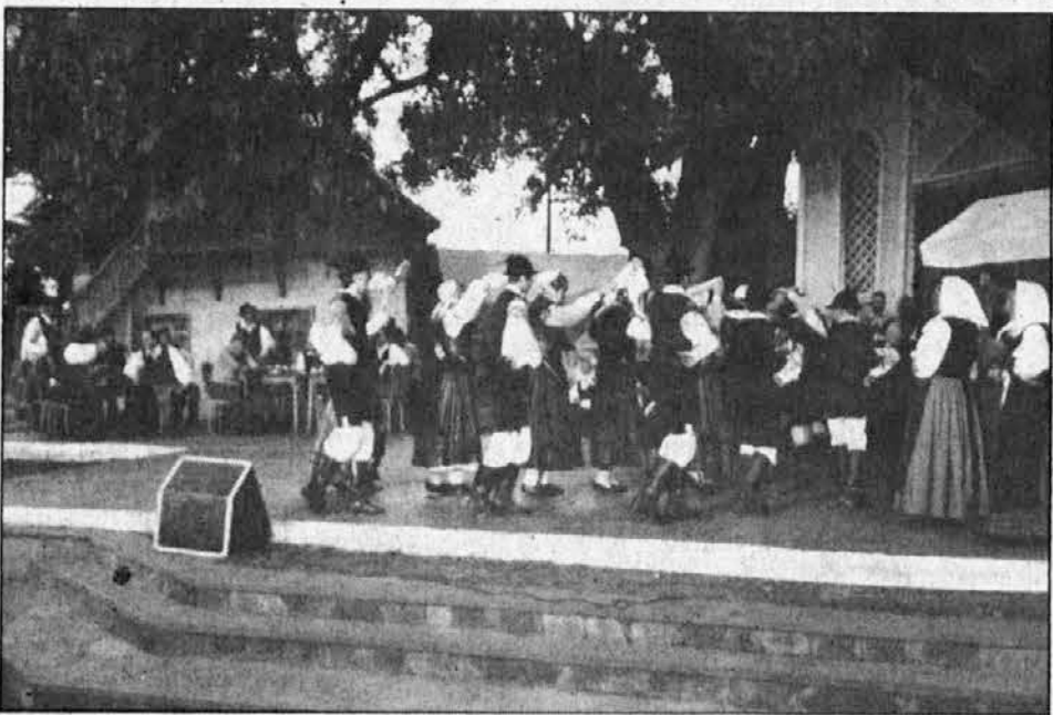
Pristavčani plešejo pod ombujem