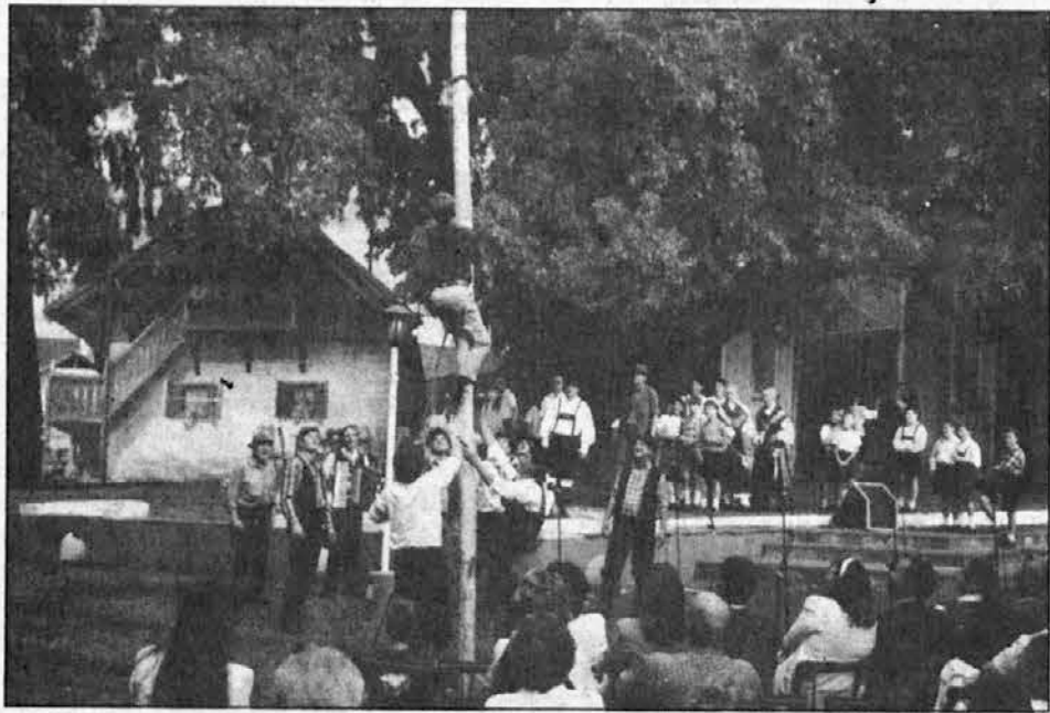
Na žegnanju postavljajo mlaj