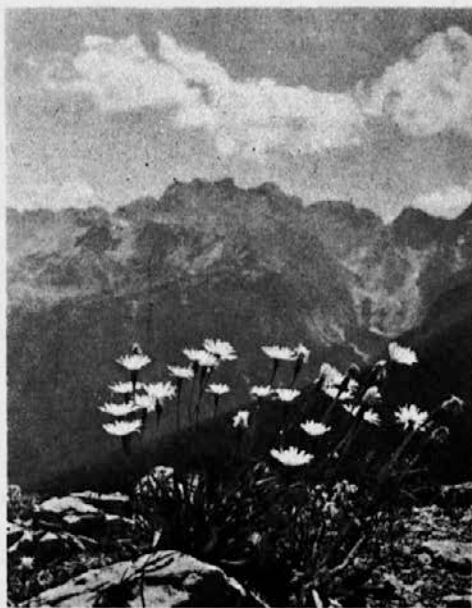
Pozdrav s slovenskih planin

V "novi" Jugoslaviji je bilo prepovedanih več knjig, kot pa v celotnem srednjem veku. (Mladina, glasilo socialistične mladine Slovenije)