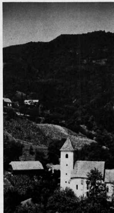
Sv. Lenart, podružnica Kostrivnice

milost, Gospod, me je obdržala zgoraj, da nisem potonil v močvaro, da sem se nekako obdržal in nosil tvojo luč v sebi, kljub napadom in viharjem, ki so prihajali od zunaj in kljub vrtincem zla, ki so grozili v meni samem.