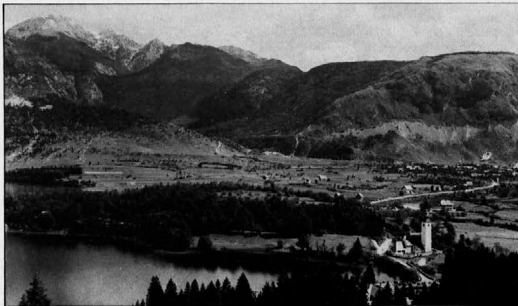
BOHINJSKI KOT s cerkvico sv. Janeza ob jezeru

In čudno smehljajoč se glas: "Veš, sem mu naro-