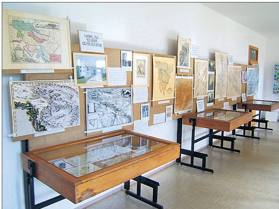
Utrinki z razstave