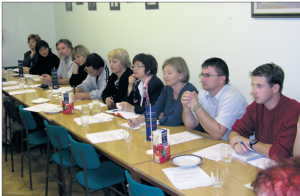
Sindikalni zaupniki vzgoje in izobraževanja so se sestali v Osnovni šoli Markovci.