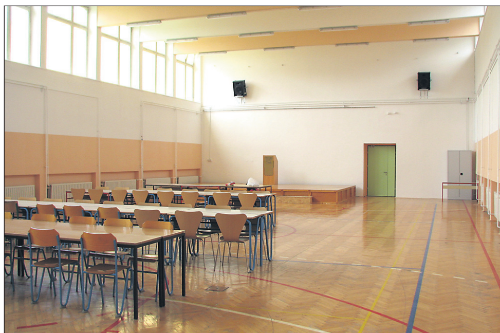
Stara šolsko telovadnico, ki je bilo deloma obnovljena in v zadnjem obdobju služi kot jedilnica (na posnetku), naj bi po zadnji odločitvi vodstva podlehniške občine porušili, na njenem mestu pa se bo gradil nov vrtec.

Ker se je glede na zahteve in kriterije petega javnega poziva za črpanje denarja iz RRP možno prijaviti le z že izdelanim projektom in gradbenim dovoljenjem, se občina na prvi rok ni mogla prijaviti, sicer pa je tudi iz časovne razpredelnice črpa-