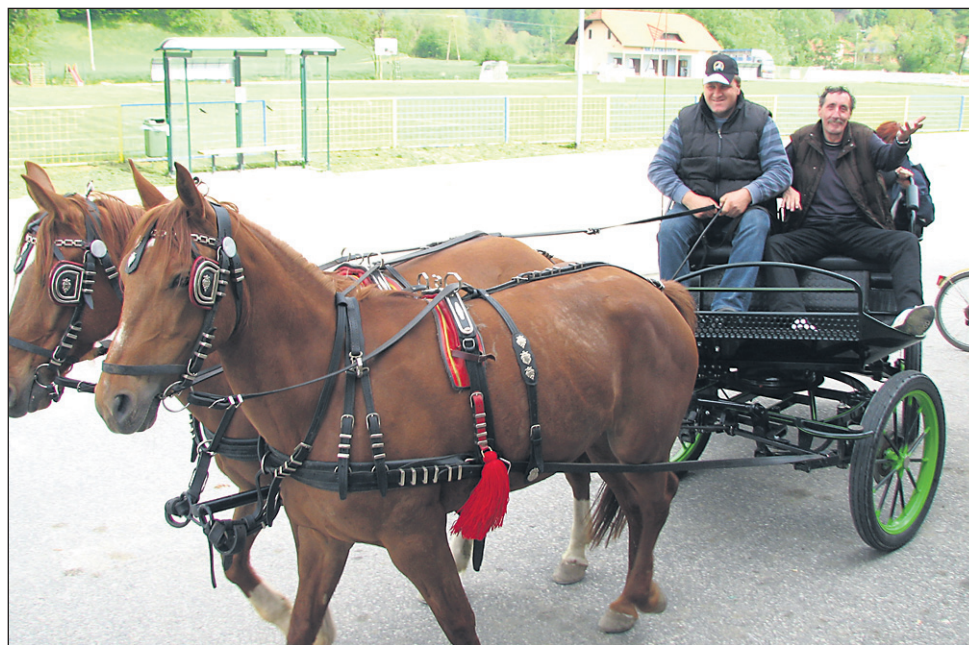
Kdo bo novi izvajalec šolskih prevozov v Vidmu, bo znano do konca meseca. (Fotografija je simbolična.)