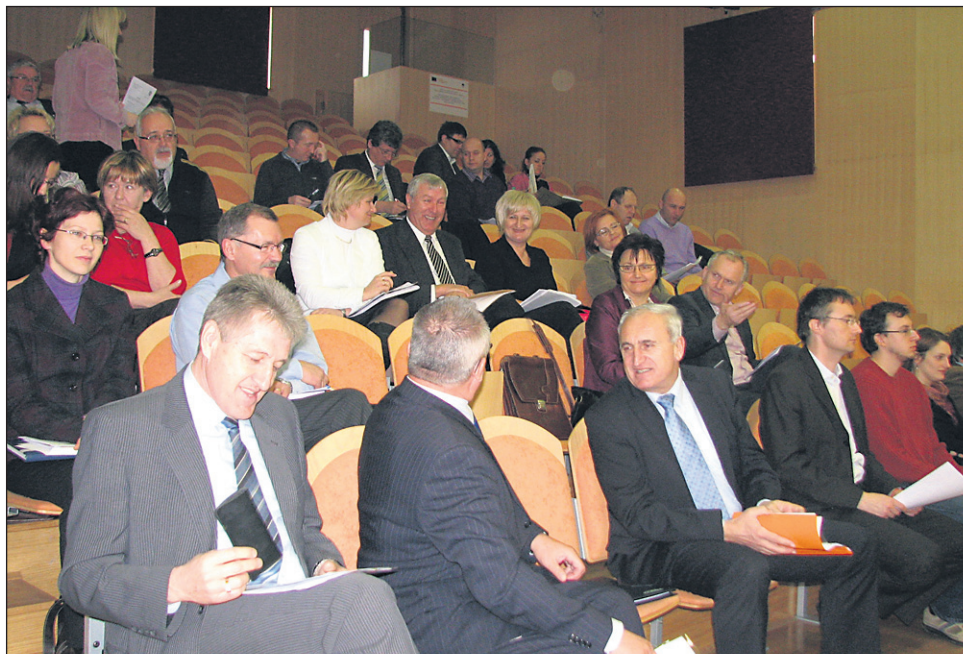
Predstavniki občin Podravja so sicer potrdili izvedbeni načrt za porabo kvot po občinah v sedanjem, petem pozivu RRP, sprejeli pa so tudi sklep, naj se čimprej razpiše popravek petega poziva z dodatnimi kvotami za občinske projekte, saj je varčevanje denarja za projekt pokrajinizacije nesmiselno.

proizvodne cone v Ormožu in na Tezmem ter Evropske univerze v Mariboru. Projekt je sicer opredeljen v Resoluciji