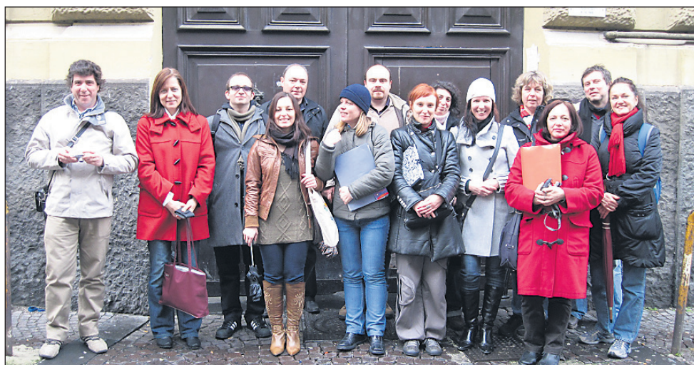
Udeleženci petega delovnega srečanja v Neaplju

jema področja ročnih spretnosti za ljudi s posebnimi potrebami ter terminološki besednjak, saj sodelavci v projektu opažamo, da prihaja pri obravnavanju teh oseb do velikega odstopanja v razumevanju tega, kako jih ustrezno umestiti v družbo.