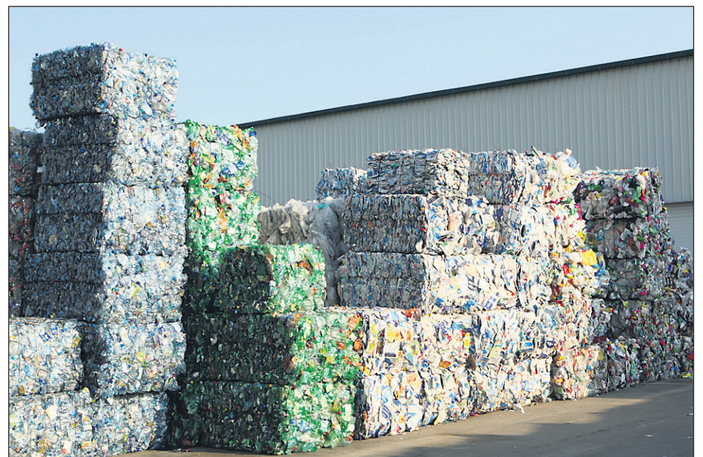
So Gajke res že od začetka premalo domišljen projekt?