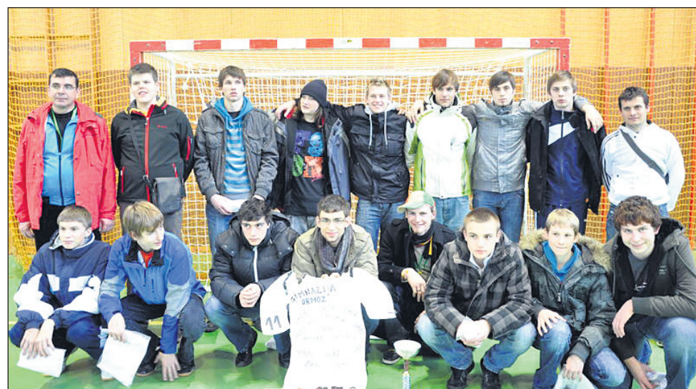
Ekipa Gimnazije Ormož, ki je v Ivančni Gorici osvojila 4. mesto.