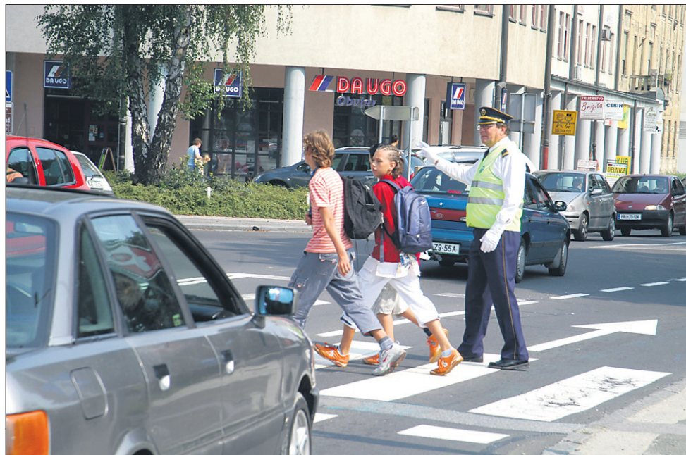
Ob pričetku šolskega leta člani ZŠAM Ptuj skrbi za varnost šolarjev na vseh prometnejših in nevarnih križiščih.