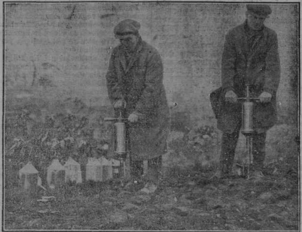
Na Angleškem so odkrili po vrtovih največjega krompirjevega škodljivca — kolorado hrešča. Uničevalca krompirja uničujejo z vbrizgavanjem karbon-bisulfata v zemljo.