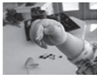
škarjasti prijem (32-40 tednov)