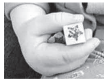
spodnji pincetni prijem (32-40 tednov)