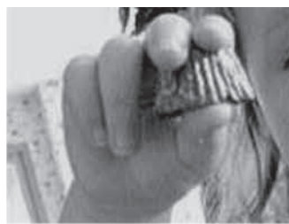
žarkasti prstni prijem (32-40 tednov)