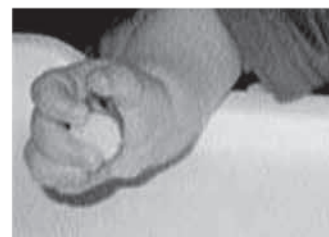
radialni dlančni prijem (24-32 tednov)