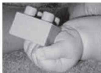
grob dlančni prijem (20-24 tednov)