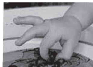
spretni pincetni prijem (44-52 tednov)