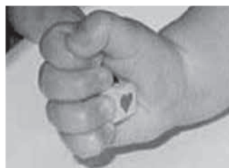
dlančni prijem (20-28 tednov)