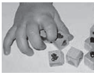
grabljasti prijem (28-36 tednov)