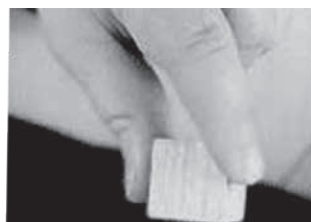
pincetni prijem (44-52 tednov)