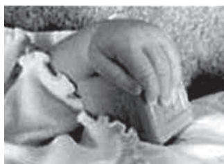
refleksni prijem (20 tednov)

Znano je, da je za pravilen in uspešno izpeljan prijem potrebnih več dejavnikov: načrtovanje gibanja, koordinacija med očmi in rokami, koordinacija udov, sodelovanje somatosenzoričnega sistema, predvsem taktilnega in proprioceptivnega sistema (6). Ko se otrok uči novega, nerefleksnega prijema, ga ne obvlada takoj. Sam ga ni sposoben ponoviti ter se ga naučiti samostojno. Prijem se prvič zgodi nepričakovano, ko otrok želi prijeti neko stvar (6).