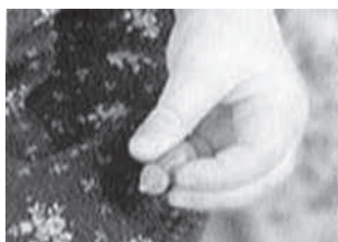
trojni prijem (44-52 tednov)