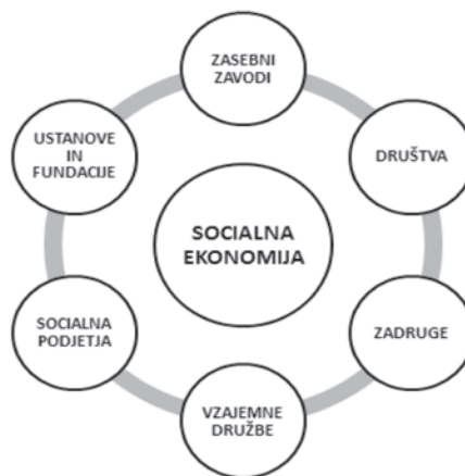
Slika 1: Prevladujoče formalne oblike socialne ekonomije v EU.

Po podatkih CIRIEC 1 (Monzón, Chaves 2012) 10 % vseh organizacij (z izjemo javnih) deluje v okvirih socialne ekonomije 2 . Te organizacije zaposlujejo 6,5 % (14,5 milijonov) vseh aktivno zaposlenih v EU 27 3 in navadno sodijo med mikro-, majhna in srednja podjetja 4 . V Evropski uniji kar 99 % vseh podjetij