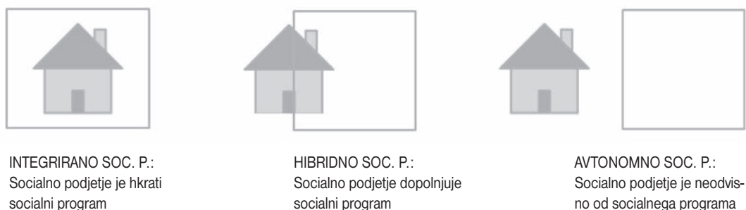
Slika 3: Tipologija socialnih podjetij (so. p.) (povzeto po Alter 2004).

Socialna podjetja hibridnega tipa kombinirajo socialne programe in socialno-podjetniške aktivnosti, ti programi pa se pogosto