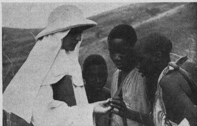
Misijonska sestra razlaga zamorecem čudodelno svetinjico.

Razlaga verskih resnic so zanjo najveselejše ure v tednu, tako se je izrazila. Z veseljem pričakuje slednjega pouka. Oskrbela si je veliki katekizem v sesuto-jeziku. Kar ji m. Dominika razloži, se nauči gladko za naslednjo uro. Dejala je: vsak večer, ko se vrne moj mož domov, me najprej izprašuje katekizem toliko časa, da znam vsa vprašanja. Sam o sebi pa je dejal, naj počakamo še nekaj časa, da bo dobro premislil. Prosila je za razpelo, rožni venec in kako sveto podobo. Svetega razpela slučajno ni-