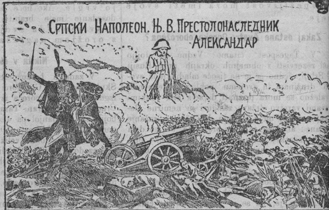
Eine serbische Postkarte, welche die durch den Krieg hervorgerufene Überhebung illustriert.

Lahke zmage nad demoraliziranimi Turki so šle Srbom precej v glavo. Zdaj se menda že res domišljujejo, da so bogve kakšna vele-vlast na svetu. Vso to smešno srbsko domišljavost kažejo razne dopisnice, ki jih agitatorji širijo tudi med avstro-ogrskimi Sibi. Eno teh dopisnic prinašamo danes. V ozadju krvavega bojišča se opazi podoba največjega vojskovodje Napoleona I. In v eni vrsti z njim — srbskega prestolonaslednika na konjičku. Kdo bi se tej prenapetosti ne smejal!