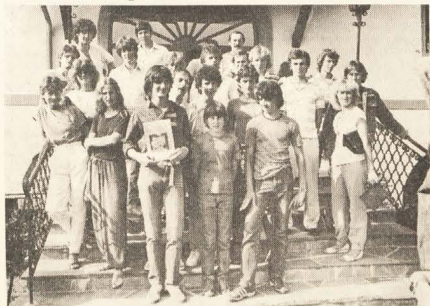
Po koncertu so se zbrali vsi nastopajoči kantavtorji

Z nastopom kantavtorjev, pevcev in popskupin na Radišah je po zaslugi Slovenske prosvetne zveze dobila slovenska mladina na Koroškem nove impulze v pevskem in glasbenem usvarjanju. Hkrati se je zaključil krog prireditev, ki se je začel letos februarja ob dnevih slovenske kulture v Trstu. Po nastopu v Trstu in Ljubljani so ti mladi zagnani pevci s kitaro in glasom na Radišah utrlji tej zvrsti svojo pot tudi na Koroškem.