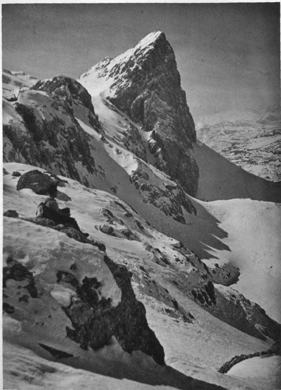
Zelnarica s Hribaric