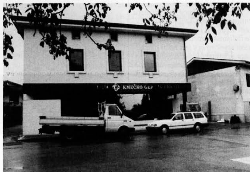
Nagrado »Šport in šola« so letos podelili v novih prostorih Kmečko obrtne hranilnice v Doberdolu

Predvsem zato, ker pri slovenskih društvih ne gojijo veliko drugih športnih panog, pa tudi, ker je delo tu bolj resno, saj imamo v teh dveh panogah že dolgoletno tradicijo. Osebnostno mi je bila odbojka že od malega všeč in sem