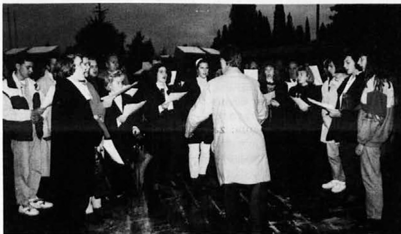
Na slovesnosti v Gonarsu je pel zbor Rupa-Peč