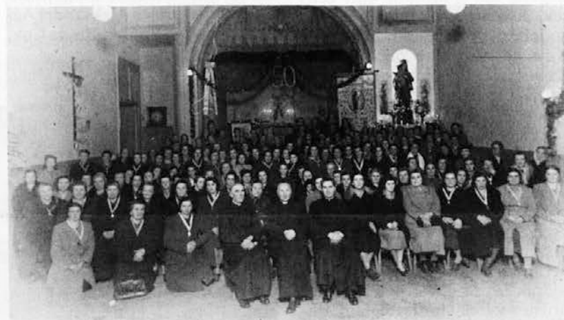
Posnetek s proslave 50-letnice Marijine družbe