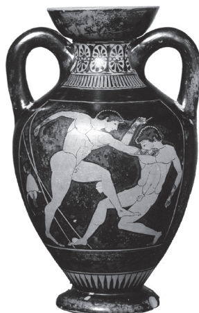
Slika 3: Boks, rdečefiguralni amforisk, začetek 5. st. pr. Kr. Atene, Narodni muzej Aten, inv. št. 1689.

K osrednjemu paru je Diezova prištel tudi mladeniča na levi, ki naj bi z zanimanjem sledil dvoboju. Opozorila je na njegovo gestikulacijo: na visoko dvignjeni desnici so vidni iztegnjeni palec, kazalec in sredinec, preostala dva prsta sta pokrčena. Drugo roko polaga na prsi. Primerljivo držo rok zasledimo na upodobitvah boksa v grškem vaznem slikarstvu od sredine 6. st. pr. Kr. in vse do poznega 5. st. pr. Kr., 12 kjer podoben položaj prstov označuje obrambno gesto oziroma je znak vdaje, t.i. ἀπαγορεύειν; poraženec dviga kvišku iztegnjeni kazalec, medtem ko so preostali prsti stisnjeni v pest (prim. sl. 3). 13