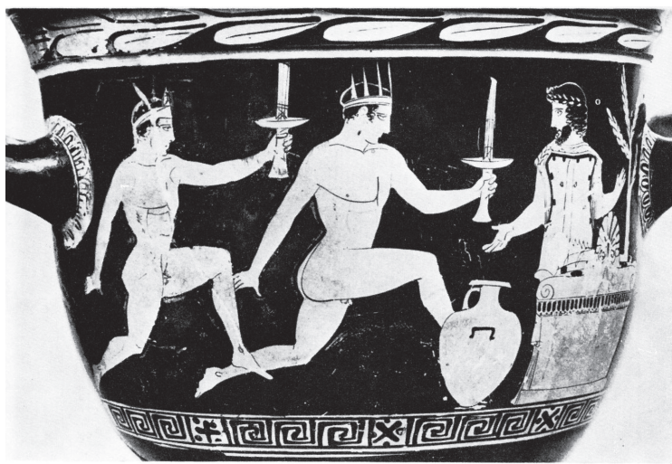
Slika 5: Λαμπαδηδρομία, rdečefiguralni krater, 430–420 pr. Kr. Cambridge Massachusetts, Fogg Art Museum, inv. št. 1960.344.

Tek z baklo v roki (λαμπαδηδρομία; sl. 5) je bil tipično grški šport, ki so ga gojili predvsem v Atenah. Značilen je bil za atiške praznike, sprva v čast Hefajsta in Prometeja, kasneje pa je postal tudi sestavni del slavij, povezanih s čaščenjem drugih božanstev ali slovesnosti v spomin umrlih. 20 Agon se je odvijal na stadionu in je bil zasnovan kot štafetni tek, pri katerem so si atleti (predvsem efebi) namesto štafetne palice izmenjevali baklo. Večkrat se je ta tek upodabljal v grškem vaznem slikarstvu iz 5. in začetkov 4. st. pr. Kr., najpogosteje pa je bil prikazan ključni trenutek predaje bakle. 21 Tekmovalci so nastopali goli, ponekod so nosili le naglavno okrasje v obliki svitka z izstopajočimi