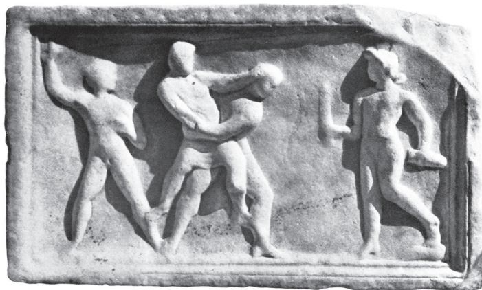
Slika 2: Relief spodnje leve bočne strani edikulne grobnice rodbine Gaja Spektatija Finita, konec 2. st./začetek 3. st. po Kr., Šempeter v Savinjski dolini.

trudi izviti iz prijema, toliko bolj, ker »prvemu napadalcu pomagata še dva.« 3 Moški na levi naj bi želel z v zrak dvignjeno desnico zamahniti proti upirajoči se ženski. Obema napadalcema naj bi na pomoč tekkel še neki lik. Klemenc je upodobitev hipotetično povezal z ugrabitvami žensk v grško-rimskem baje-slovju. Najbolj verjetna se mu je zdela Parisova ugrabitev Helene, saj »imamo v Šempetru kakor tudi Noriku še več reliefov, ki predstavljajo dogodke trojanskega mita.« 4 Ta par po Klemenčevem mnenju predstavlja skupina na sredini. 5