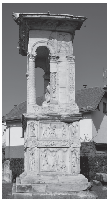
Slika 1: Leva bočna stran edikulne grobnice rodbine Gaja Spektatija Finita, konec 2. st./začetek 3. st. po Kr., Šempeter v Savinjski dolini.

Po odkritju leta 1953 se je interpretacije prizora prvi lotil Josip Klemenc. Za figuro v dokolenski tuniki je pre nagljesno sklepal, da je »ženska, ker ima edina od vseh na sebi obleko«. 2 Neuspešno se