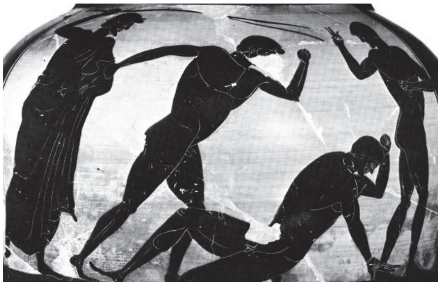
Slika 4: Boks, rdečefiguralna amfora, začetek 5. st. pr. Kr. Berlin, Staatliche Museen, inv. št. F 1833.

Boks je bil seveda že v homerskem času visoko razvita športna disciplina, ki je leta 688 pr. Kr. postala tudi sestavni del olimpijskih iger. Enako kot pri rokoborbi so bili tekmovalci razvrščeni v tri do pet razredov glede na starost. 16 Športniki so si vse do 4. st. pr. Kr. roke povezovali z usnjenimi trakovi, kasneje so to zaščito opuščali in jo nadomestili z neke vrste usnjenimi rokavicami ( σφαίραι ), ki so jih uporabljali zlasti pri vežbanju in spominjajo na današnje boksarske rokavice. Rimljani so na usnjene trakove na členkih običajno dodali še kovinski okov ( caestus ), s katerim so seveda lahko huje