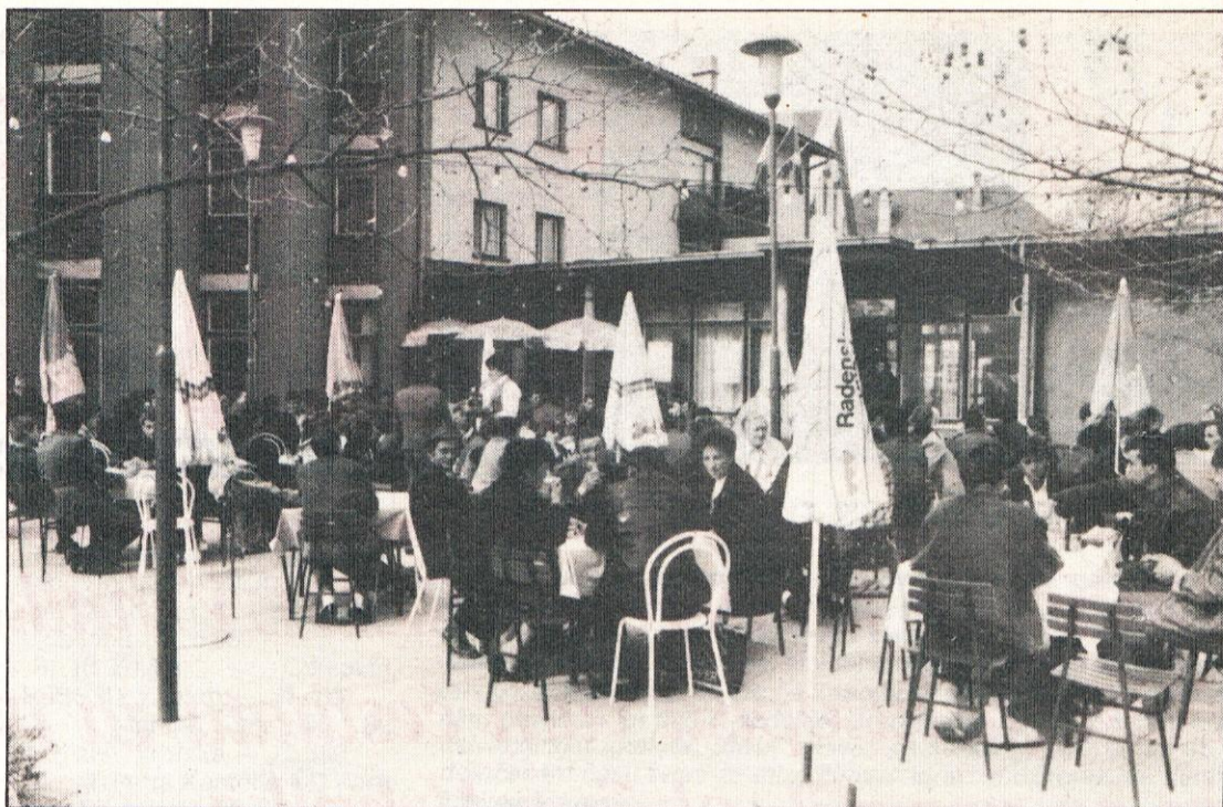
Množica pred Mantovo