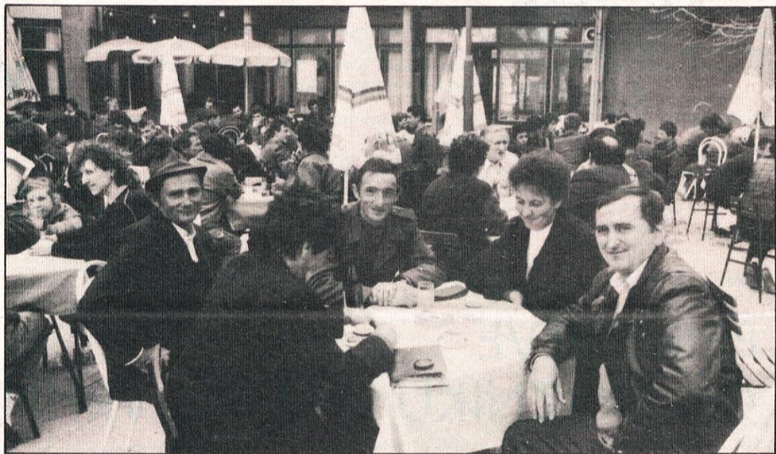
Družina Šmida iz Vrbovca