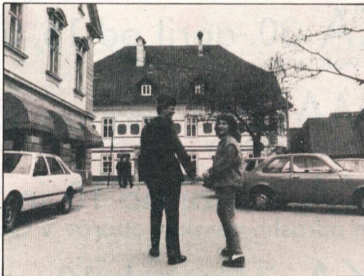
Prišlo je dekle.