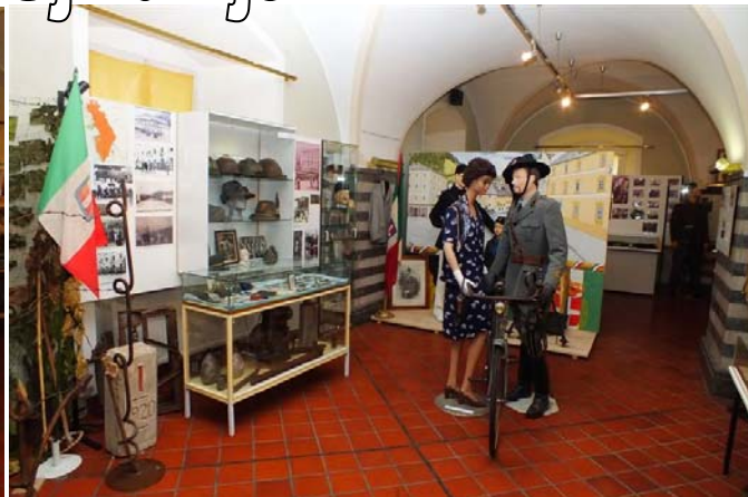
Italijanska okupacija Primorske – Idrija