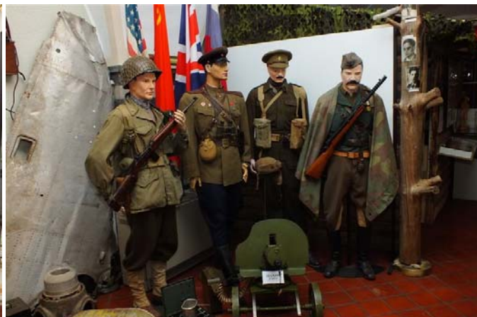
Zavezniki 2. svetovne vojne, uniforme USA, Britanija, Sovjetska in Jugoslovanski Partizan