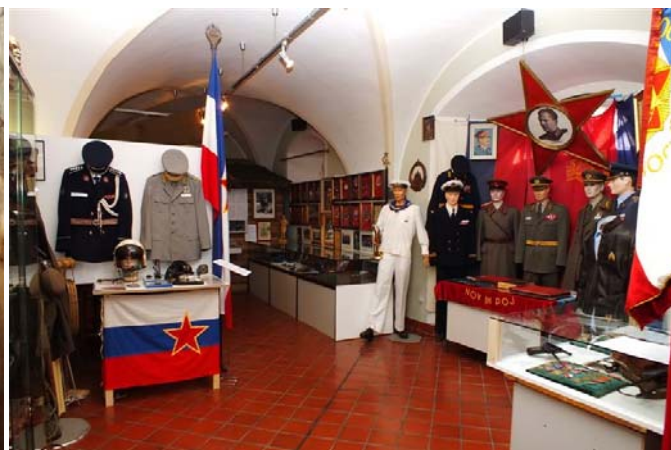
Jugoslovanske uniforme in eksponati Idrijčanov kot častniki v JNA