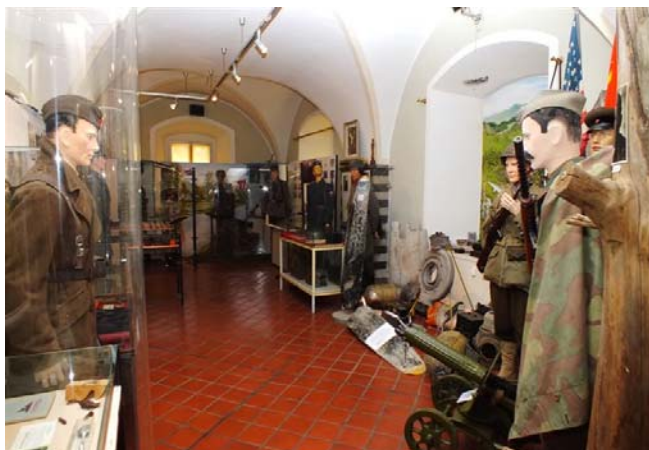
Eksponati, orožje odličja uniforme in ostanki letala 2. svetovne vojne