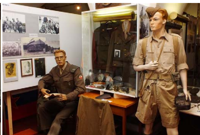
Primorci v zavezniški armadi (USA oskrbovalne čete in Brit. general kasneje v prekomorskih brigadah)