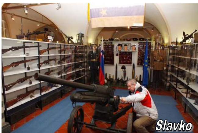
Osrednji prostor v vojnem muzeju kjer je razstavljeno orožje s katerim so se bojevali na našem področju v prejšnjem stoletju