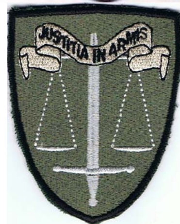
eksotična našitka pravne službe

Preverjeno, znak pravnikov kot našitek ni bil nikoli potrjen in tudi nikoli nošen na uniformah SV. Oba znaka na fotografiji sta torej poskus nečesa neobstoječega. Se pa sama po sebi ponuja tudi razlaga, kako so lahko nastali, vsaj eden od prikazanih. Ob neki priložnosti so si pravniki (gre za majhno število predstavnikov te stroke) na lastne stroške naročili športne majice, na katerih je bil tudi znak pravne službe SV. Od tega izdelka do vezenja na drug material v obliki našitka je pa majhen obrtniški korak.