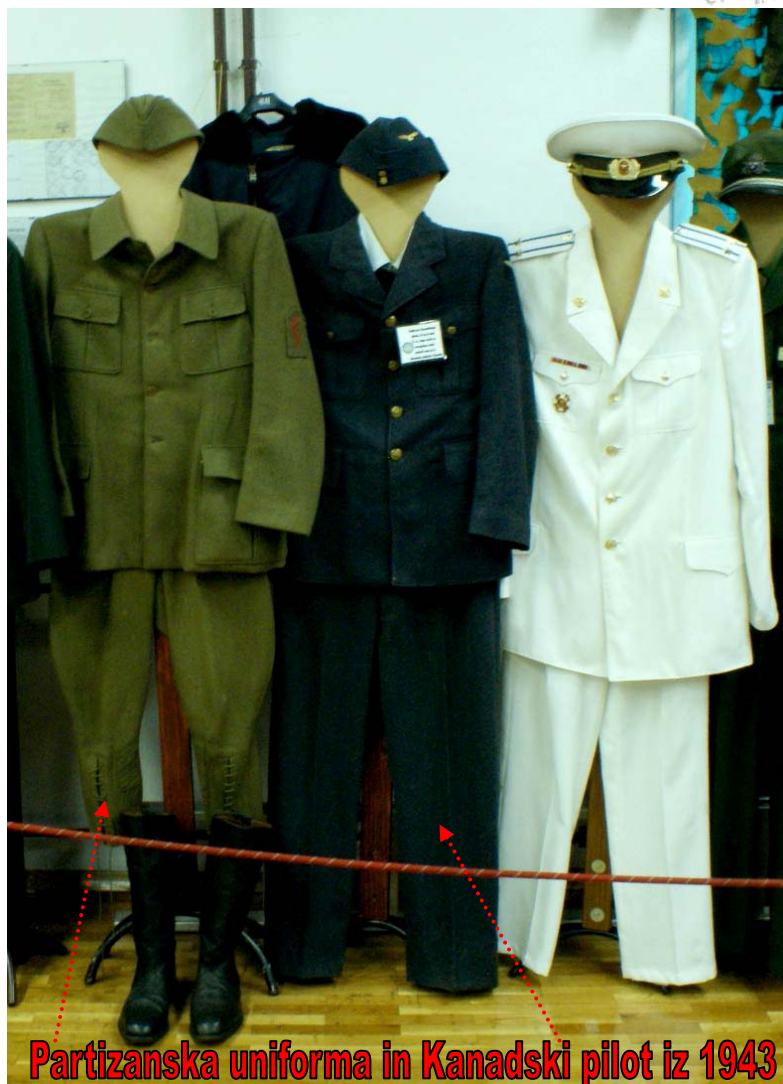
Partizanska uniforma in Kanadski pilot iz 1943