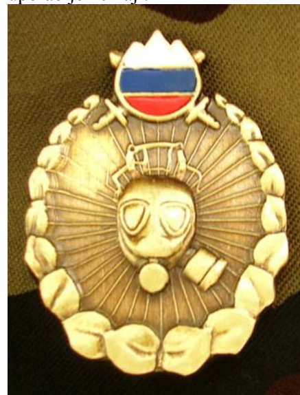
znak pripadnosti / usposobljenosti z masko

zaščitno masko. Pred slabim letom se je začel pojavljati na elektronskem tržišču (»bolha«...) kot izredno redek znak SV. Na pojav tega znaka sem bil opozorjen in naprošen, da preverim, od kje izvira. Povprašal sem vse znane in možne pripadnike SV, ki bi lahko kaj vedeli o tem znaku, pa so vsi odgovorili enako: »Neobstoječe, nikoli videno, niti ne kot poskusni znak...«. Videl sem več različic tega znaka, enega celo izdelanega iz aluminija, znak SV je grobo barvan. Obstajajo tudi lepše izdelani, s plastificiranim znakom SV, na nobenem znanem pa ni uporabljen emajl.