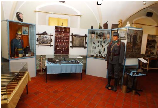
Predstavitev 1. svetovne vojne