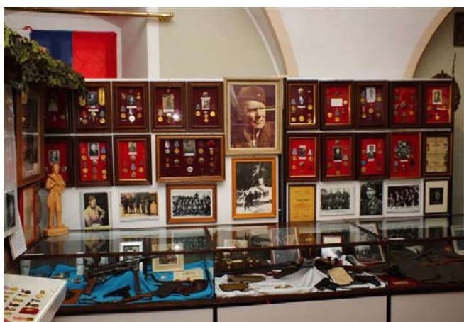
Partizanska odličja Idrijčanov in osebna oprema ter orožje znanih in hrabrih borcev NOB, med njimi tudi Levičnik