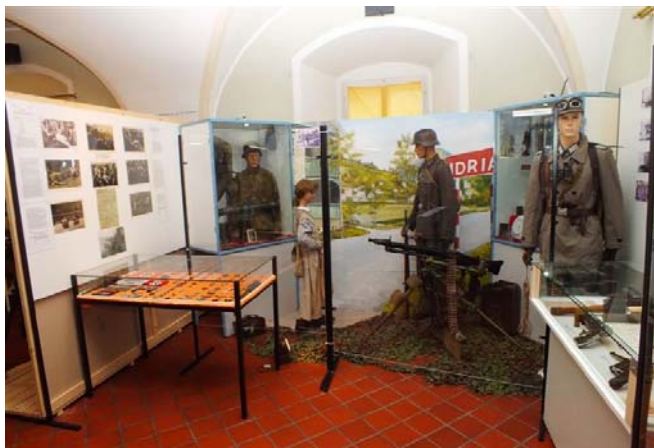
Nemška soldateska v Idriji (polk 139 gorskih lovcev in SS policijski bataljon) orožje, odlikovanja in slikovno gradivo