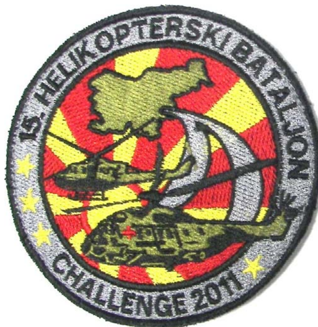
2. »enotovni« našitek 15. HEB

razumemo kot »IZZIV 2011, TAKTIČNA VAJA – BOJNO STRELJANJE«. Prstan z napisom je širok 10 mm, torej je premer centralnega kroga 70mm. V centralnem polju dominira barvni znak BRZOL (Brigada zračne obrambe in letalstva), pod znakom pa se stikata zastavi Republike Slovenije in Republike Makedonije kot države gostiteljice. Še nižje v spodnjem delu je rumena silhueta Makedonije z rdečo piko na desni strani. Slednja ponazarja lokacijo dogodka. Našitek ima zadaj prišitega »mačka« za pripenjanje na uniformo.