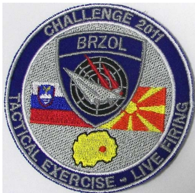
1. osnovni oz. skupni našitek BRZOL

Za zbiralce je seveda zanimivo in pomembno tudi dejstvo, da je poleg strokovnih dosežkov vaja pustila tudi »zbiralski« pečat. Tokrat je s tega vidika vaja še posebej zanimiva, saj je bil poleg osnovnega našitka izdelan še »enotovni« našitek, torej našitek ene od enot, udeleženih na vaji.