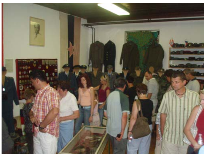
Military Museum Martin