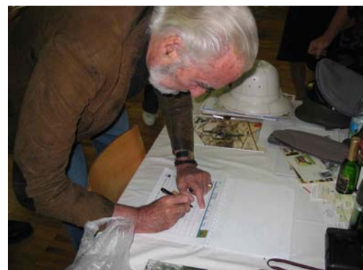
Christopher LEE v muzeju