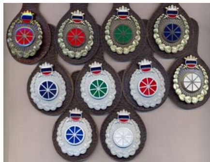
znak pripadnosti / usposobljenosti logistike

Podoben primer je znak »logistikov« SV. Že v osnovi je poimenovanje tega znaka napačno, saj ga večina zbiralcev opisuje kot novejši znak »voznikov«, kar pa seveda ne drži. Kovinski znak novejša izvedba je t.i. enovit, znak SV je integriran, ne lepljen, ter barvan in lakiran. Na ovalni osnovi z vencem lipovih listov je v sredini pritrjeno zlato stilizirano kolo z rdeče pobarvanim jedrom. To je uradni znak pripadnikov logističnih služb SV (med katere seveda spadajo tudi vozniki).