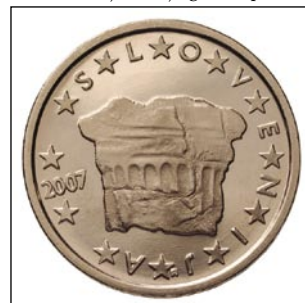
Na slovenski 2 centaj geste koroški kamen

»Hribernikova tisa« je visika deset mejterov, kaulivrat ma obseg 3 mejtere. Ne vej se djenu, kak stara je, ka tisa tak rasté, ka iz menjši stebel edno bole kusto vküprzrasté. Čednjaki računajo, ka má 8-900 lejt. Edna stara ženica iz bližanje vesi je gnauk pravla: