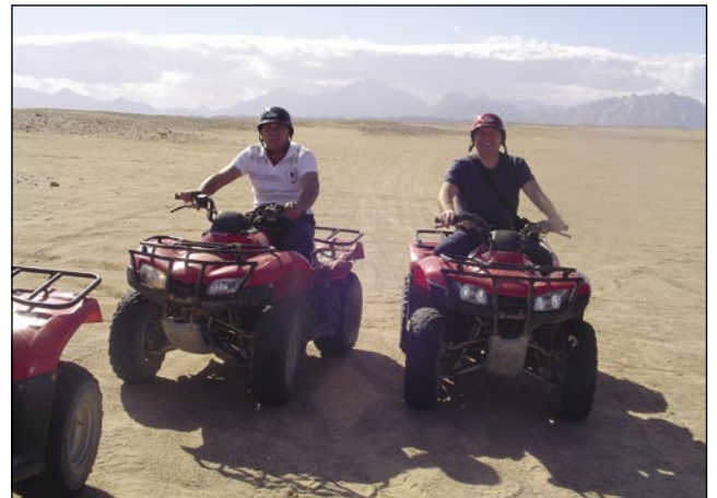
Dva Djaužina v puščavi

Zavolo tauga niške ne napravi strejo, dapa ranč nej trbej, zato ka rejdko majo dež. Če pa pride, te je cejla katastrofa. Tašoga reda nejga telefona, nejmajo kanalizacijo, zato ka če dež dobijo, tisti je te že čüdež tam pri nji. Gda sva müva tam bila, te se je ta čüda zgaudila, pa smo leko vidli, kak je tau pri nji, gda dež dé. Takša zanimivost je ešče za nas tau, ka majo pet fele policij. Majo vaško stražo, turistično policijo, redno policijo, kriminalistično policijo v civili