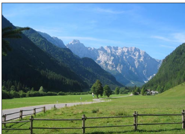
Med viskimi bregami vauska Logarska dolina

Šteri so že dostakrat bili na Koroškom, pravijo, ka je krajina, štera je trnok ovaška od vsej drügi. Má vnaugo drauvni, dosta vrejndi lepote, med njenimi modernimi fabrikami pa se skrivajo drtinje divdjine. Kak lik bi bila na konci sveta, zmejs pa je na veukom križpautji Evrope.