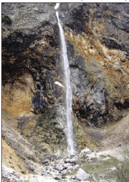
80 m viski slap, pri vretini Savinje

»Po Koroškem, po Kranjskem že ajda zori...« - se začne slovenska ljudska pesem. Za Slovence pa je nej dina tista, zavolo štere se radi spominajo na malo koroško krajino na sovernom tali gnešnje Slovenije, ali zavolo štere večkrat gorpoiškejo vauske doline pa viske bregauve blüzi avstrijske grajnec. Zvün lepote koroške narave jim na pamet pride, ka se je med temi bregami pred gezero štiristau lejtami nika začnilo... Stari starci Slovincov so na zemlau gnešnje Avstrije prišli v 6. stoletji. Stau lejt kisnej so že meli svoj rosag z imenom Karantanija , štera je bila prva sama svoja slovanska država. Tistoga ipa so največkšoga slovanskoga prejdnojga, kneza simbolično vöodebrali slovanski pavri. Gda je stari knez (fejedelem) mrau, so na Gospovetskom pauli (v gnešnji Avstriji, pri Krnskom jezeri) naravnali navovoga v paverski gvant pa klabük.