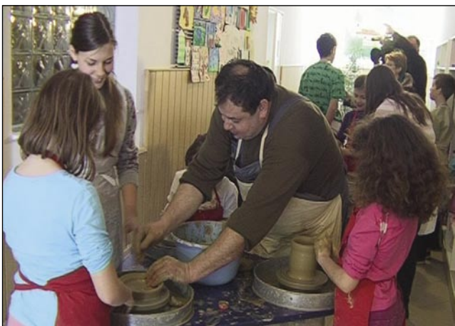
Tudi deklice rade delajo z glino

ga mentorja več novih besed in izrazov. Potrebni material za lončarjenje nabavi šola. Pri delu z glino se razvijajo otrokove ročne spretnosti in pa tudi občutek za obliko. Otrokom je delo z glino pravo