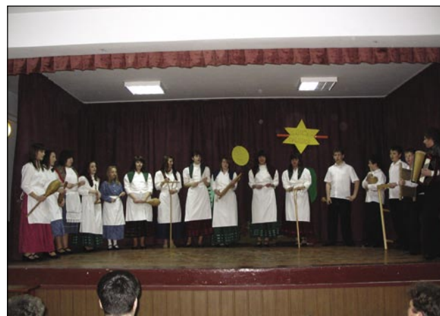
V programu je sodelovala skoraj vsa šola

Program je trajal eno uro in v tej eni uri smo videli, kaj vse znajo učenci! So igrali, recitali, peli, plesali moderne plesse, igrali na instrumentih... Nastopali so od najmlajših do največ-