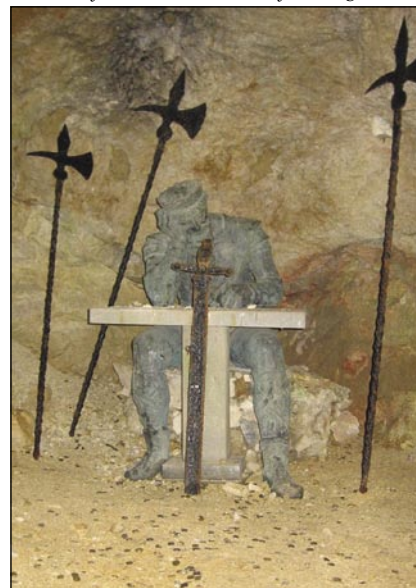
Eške dosta trbej čakati, ka keca zraste

V bregaj Vzhodne Karavanke rasteša dvej trnok stari drejvi .