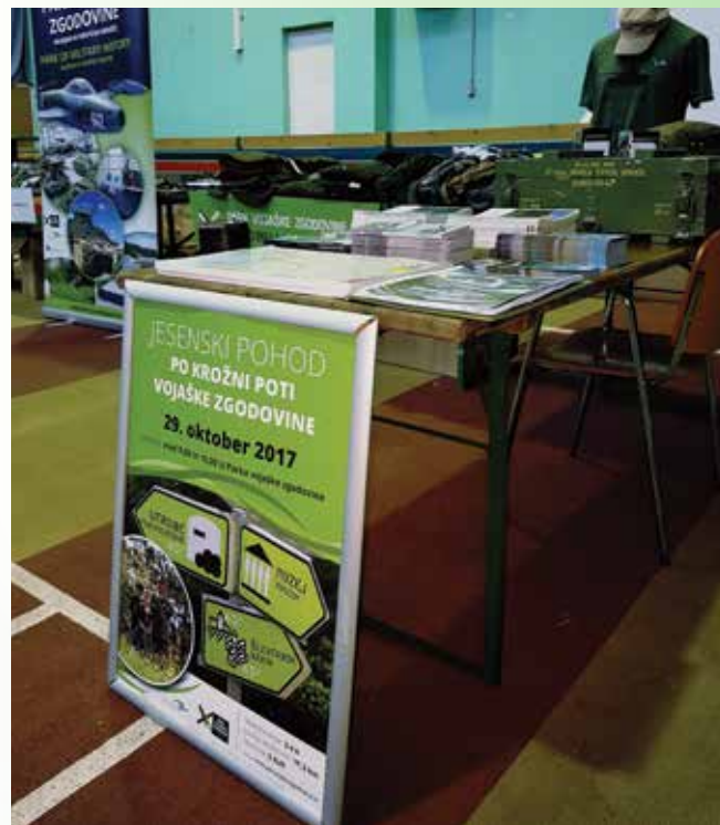
Park vojaške zgodovine na sejmu militarij v Šempetru pri Gorici