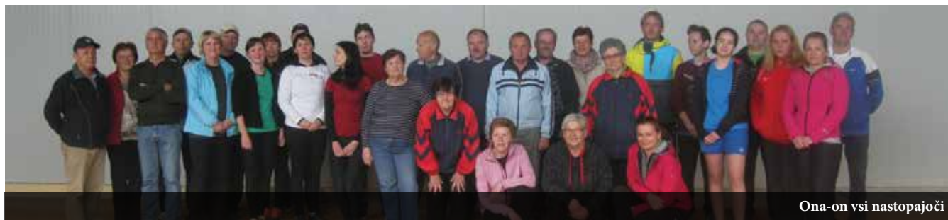
Ona-on vsi nastopajoči