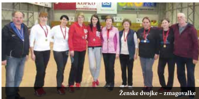
Ženske dvojke – zmagovalke

Balinarski klub Orlek ORO MET Pivka je tudi letos kot vsako leto organiziral za svoje člane klubska tekmovanja. Ta tekmovanja so