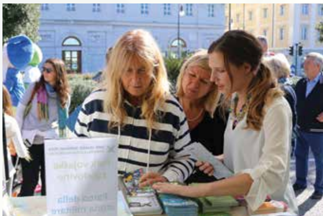
Park vojaške zgodovine na prireditvi Barcolana 2017