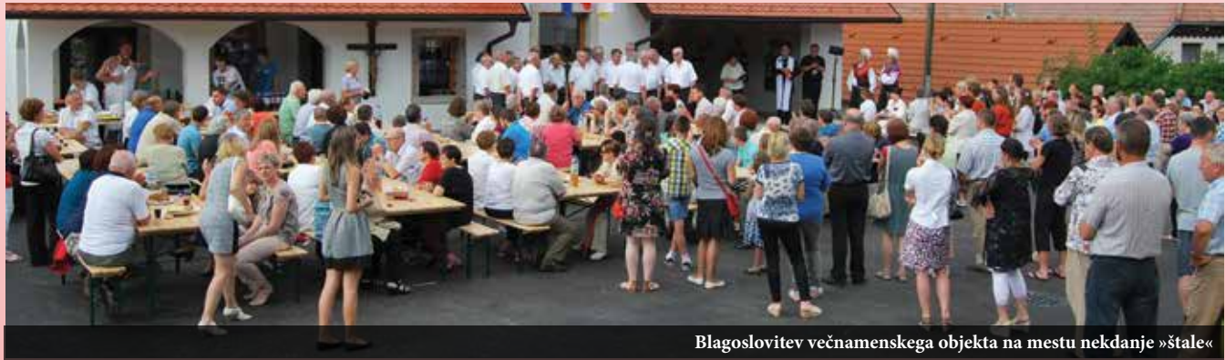
Blagoslovitev večnamenskega objekta na mestu nekdanje »štale«