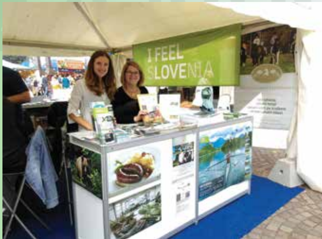
Park vojaške zgodovine na kulinarčni prireditvi Obmejni okusi 2017 (Gusti di frontiera)