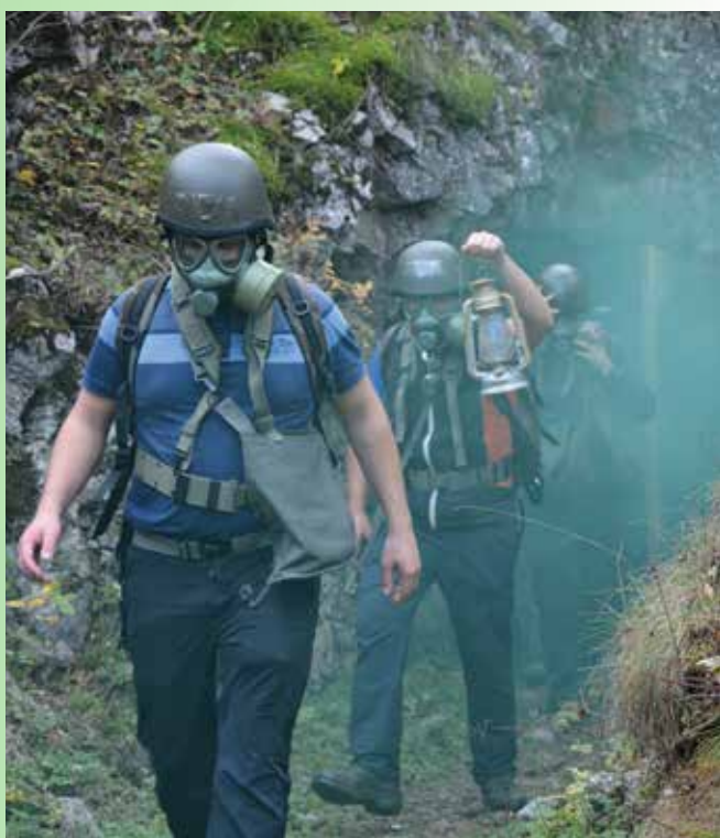
Teambuilding v Parku vojaške zgodovine