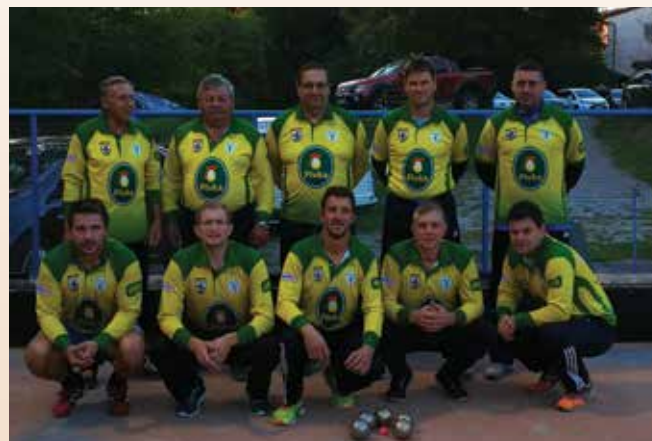
Balinarski klub Košana

BK Košana bi se rad zahvalil zvestim navijačem in podpornikom kluba za spodbudo na tekmah. Zahvala pa gre predvsem glavnemu pokrovitelju Pivka Perutninarstvu ter ostalim sponzorjem in Občini Pivka za pomoč pri delovanju kluba. Upamo, da vas bomo še naprej razveseljevali z uspehi in upravičili vaše zaupanje.