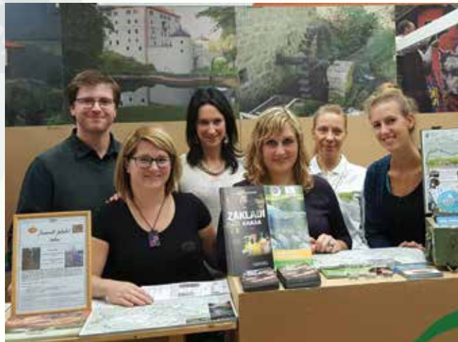
Park vojaške zgodovine na Festivalu za tretje življenjsko obdobje 2017