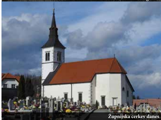
Župnijska cerkev danes

je zapisal »za večne čase«. Prispevki vernikov so povzeti po pogodbi ob ustanovitvi kaplanije (1807). To je bilo 18 kubičnih metrov drv, 17 kvintalov pšenice in 10 kvintalov rži. V dekretu so tudi natančno določene meje nove župnije. Župnija Št. Peter obsega »poleg svojega središča Št. Petra še sledeče vasi - Gradec, Petelinje, Radohovo vas in Hrastje pri Št. Petru«. Kasneje je bila v župnijo vključena še Slovenska vas.