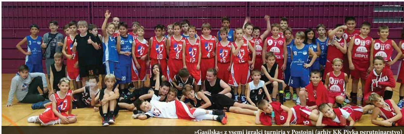
»Gasilska« z vsemi igralci turnirja v Postojni