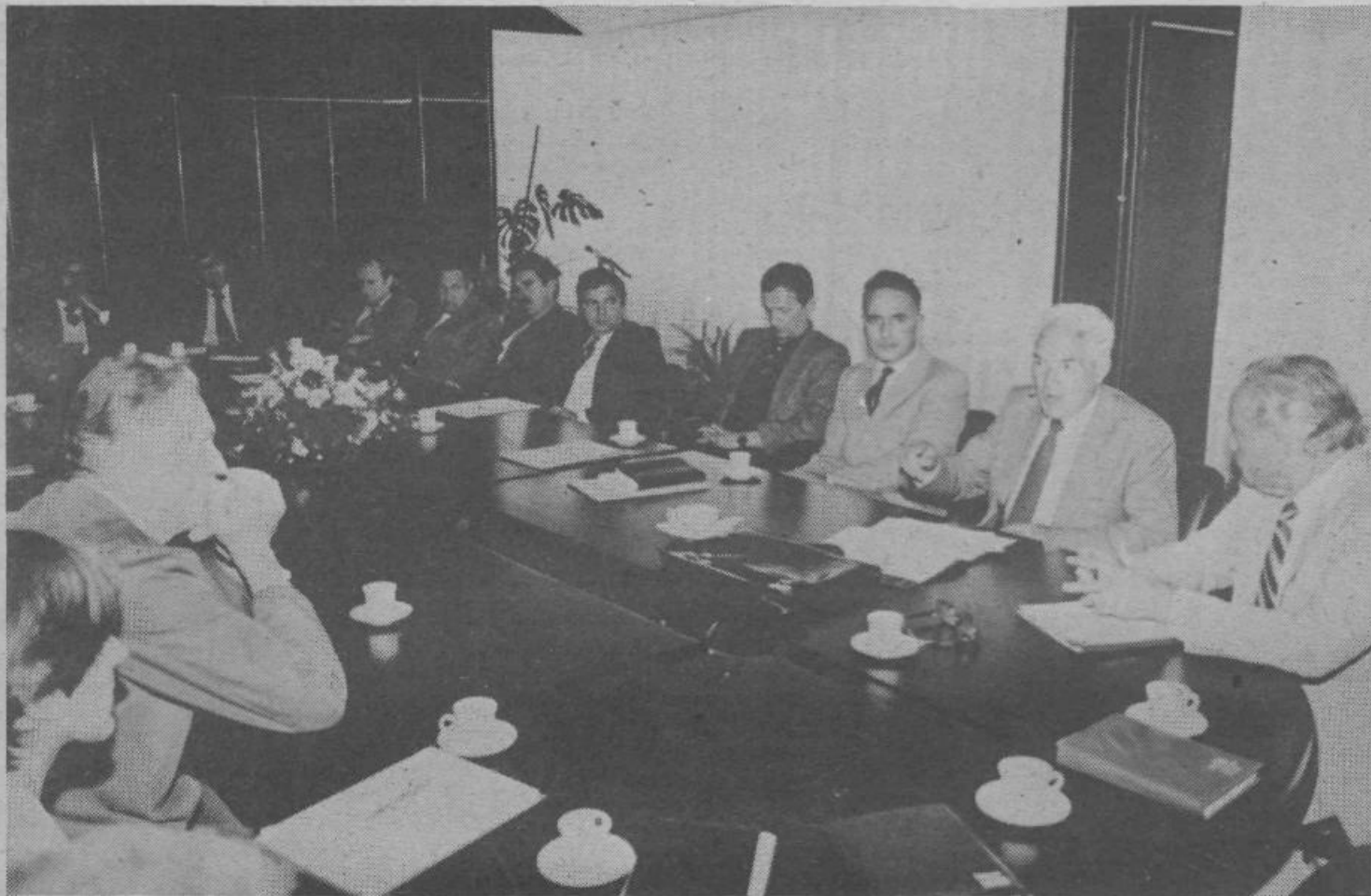
Tov. Hafner na razgovoru v DO IMP „Viktor Koleča“ v Ivančni gorici.