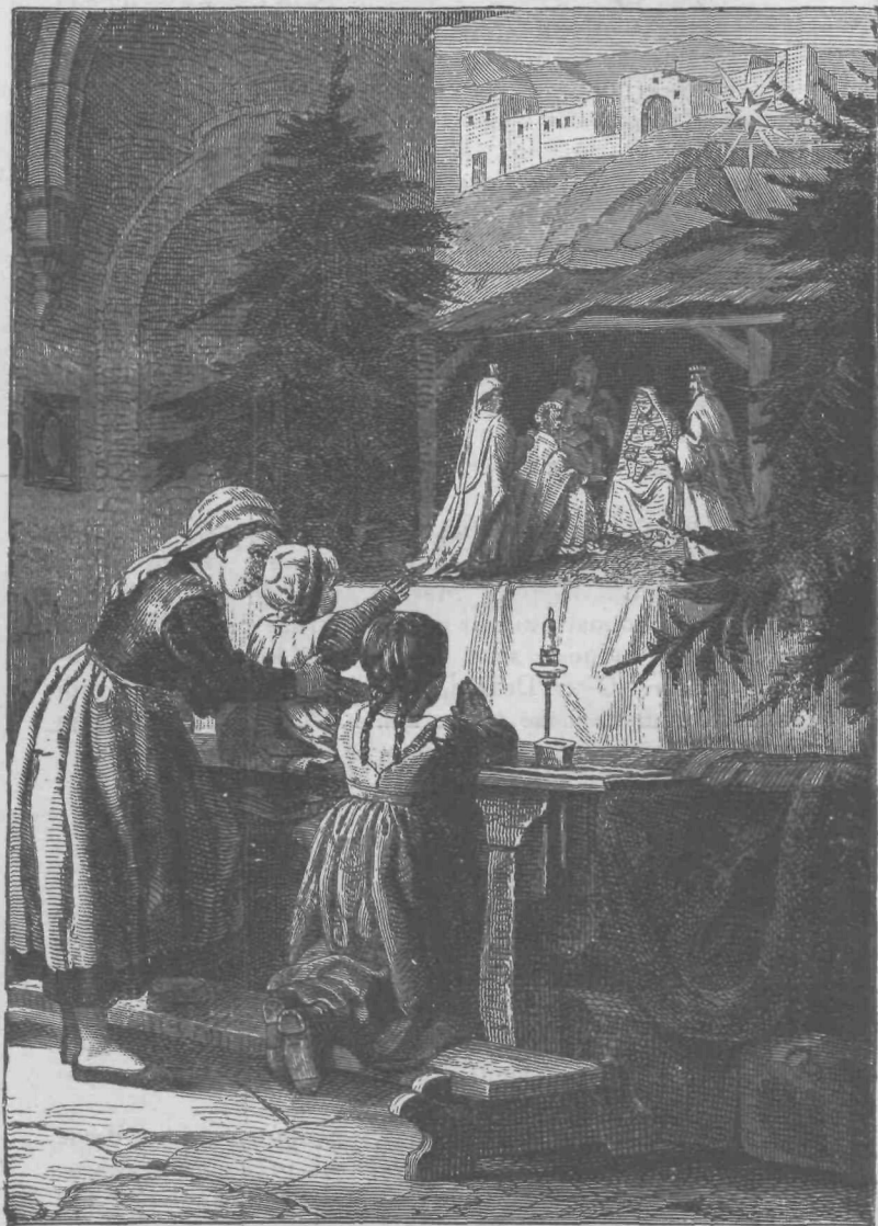
Zvezda je obstala zgoraj nad krajem, kjer je bilo Dete. Mat. 2, 9.