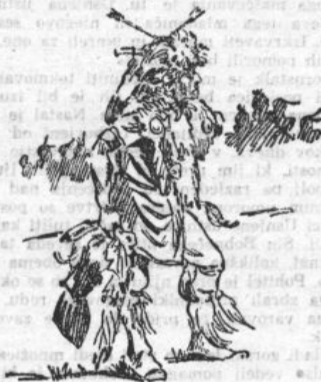
Čarovnik je zdajci dvignil roko

niso imeli dosti opravka, kajti oblačila indijanskih fantičev so bila tako poenostavljena kakor najpreprostejše kopalne hlačke današnjih mladih kopalcev. Tekumze je torej nastopil, poprijel je z obema rokama prečno palico, nagnil se je naprej — in zdaj ga je poleg njega stoječi bojevnik z vso močjo tako dolgo udrihal po hrbtišču, da je imel namesto smrekovih vejic le še tri kratke štrklje v rokah.