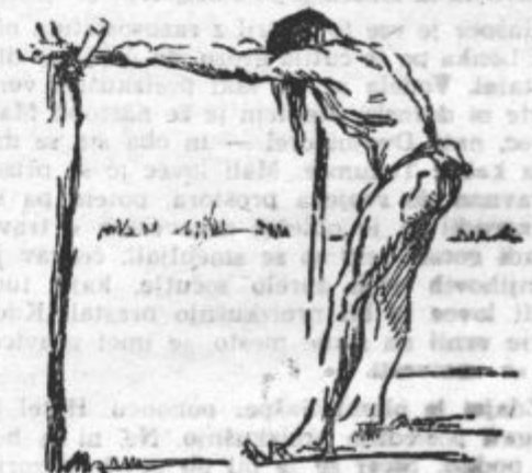
... ter se ni več ganil niti za las

več ganil niti za las. Tako je ostal tudi še potem, ko ga je bojevnik že prenehal udrihati.