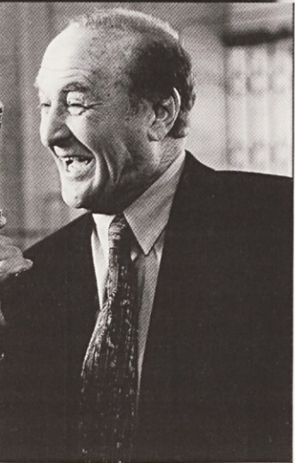
1. Robert Blake 2. Robert Loggia