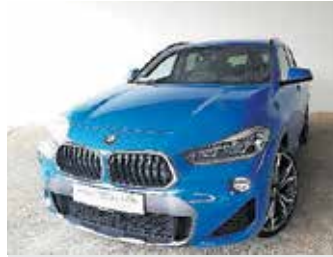
BMW X2 2.0 XDrive M paket, letnik 2018, 50.000 km, 1. lastnik, avtomatski menjalnik