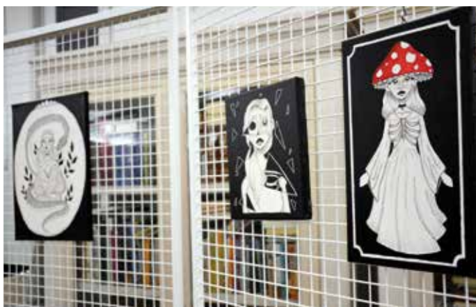
Razstavljenih je bilo dvanajst del.

Gorenjski glas je najbolj bran regionalni časopis v Sloveniji.