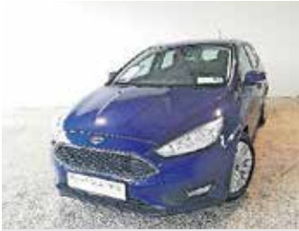
Ford Focus 1.5 TDCI Automatic, letnik 2017, 95.000 km, navigacija