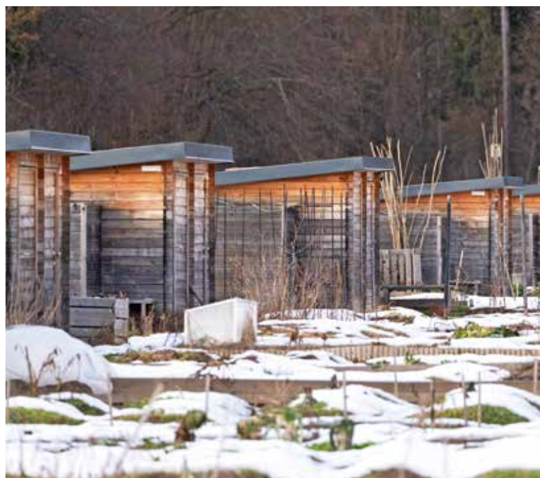
Zanimane za najem vrtičkov na Svetju vabijo, da svoj interes sporočijo do 20. februarja.

Del območja s 40 vrtički je občina uredila že v letu 2019 in je za obdelavo na voljo takoj. Prednost pri oddaji teh imajo pod enakimi pogoji obstoječi zakupniki vrtičkov. Del območja z 28 vrtički bo urenjen v naslednjih mesecih in bodo na voljo predvidoma od aprila letos. Dokumenti, vključno z obrazcem prijave na namero, so objavljeni na občinski spletni strani.