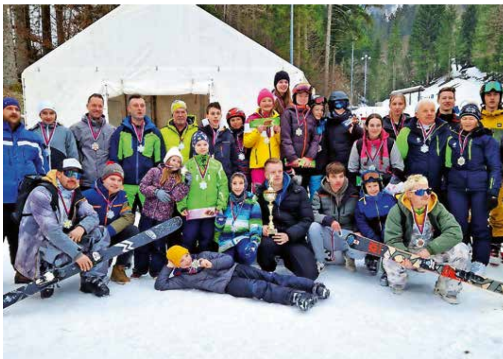
Gasilci ohranjajo tradicijo tekmovanja v smučanju.

V vseh kategorijah od pionirjev do starejših članov se je pomerilo 44 tekmovalcev iz petih društev Gasilske zveze Medvode (Smlednik, Sp. Pirniče - Vikrče - Zavrh, Preska - Medvode, Zg. Pirniče in Sora). Tekmovanje je vsebovalo tudi preverjanje znanja gasilskih veščin, saj je moral tekmovalec na ustrezno označenem delu veleslalomске proge opraviti praktično nalogo, in sicer pionirji in pionirke prenos cevne nosilca od označenega mesta do vedra, mladinci in mladinke spenjanje ročnika s tlačno C-cevjo, pripravniki in pripravnice ter vsi člani in članice pa izvesti tkalski voz. Skupni pokal je šel v roke gasilcem PGD Smlednik.