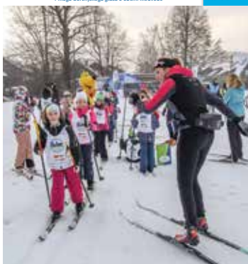
Akcija Šolar na smučih v NC Bonovec Medvode