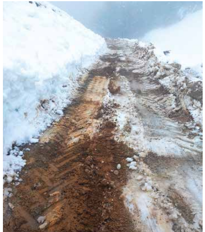
Cesta od kmetije Kozomer proti Žlebam po pluženju

Obrnili smo se na Občino Medvode, tudi z vprašanjem, kakšni so načrti glede urejanje te ceste. Odgovore je pripravil Primož Bajželj iz Oddelka za okolje, prostor in razvoj. »Glede na napisano in opravljen ogled je koncesionar za vzdrževanje občinskih cest v januarju na makadamski cesti, ki poteka večji del po hribovitem območju, izvajal zimsko službo. Pluženje po makadamskem cestišču ob tako veliki količini snega je bilo težko, saj so bile razmere res izredne zaradi velike količine snežnih padavin, ki so se izmenjavale z dežjem. Zato je bila tudi sama cesta zelo razmočena, kar je še dodatno oteževalo pluženje in posipanje. Pri samem pluženju je zato na nekaterih delih prišlo do več poškodb zgornjega cestnega ustroja, kar pa je povsem običajno za hribovite predele makadamskih cest. Poškodbe, ki so bile narejene na cesti, bo koncesionar saniral, ko bodo za to ustrezne vremenske razmere (poškodovani odvodniki se bodo vgradili nazaj, izvedla se bo sanacija brežin in celotnega makadamskega cestišča,« je pojasnil in v nadaljevanju dodal: »Na tej makadamski cesti, ki je dolga okrog 2,5 kilometra, poteka zelo malo prometa, saj vodi le do dveh hiš na Topolu, zato redno vzdrževanje ceste za Občino Medvode predstavlja velik strošek in bi bila rekonstrukcija in asfaltiranje smiselno, pri čemer se je treba zavedati, da govo-