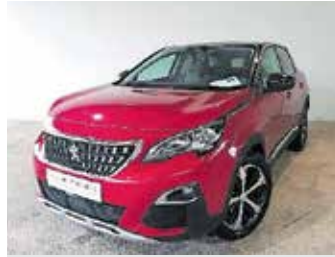
Peugeot 3008 1.2 Allure 130 KM, letnik 2018, 74.000km, kamera, PDC, navigacija