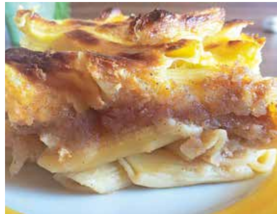
Okusen makaronov narastek z jabolki

Star bel kruh narežemo na kocke in damo v visoko skledo, prelijemo z vročim mlekom, da se kruh napoji. Na maslu prepražimo čebulo, malo česna in peteršilj in prelijemo čez kruh, premešamo in ohladimo, dodamo tri jajca, dobro premešamo in pustimo, da se vse