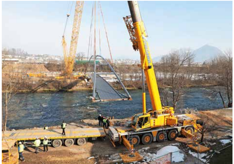
Brv čez reko Savo so namestili na njeno mesto. Premik z levega brega, kjer so jo sestavili, si je ogledalo kar nekaj radovednih opazovalcev.