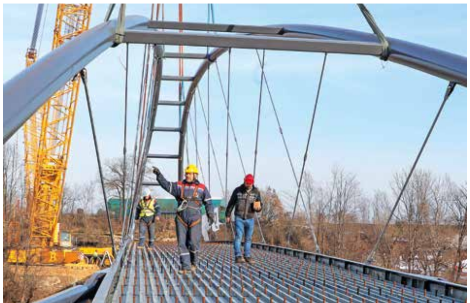
Delo na brvi še niso končana. Uradno odprtje naj bi bilo v začetku julija.