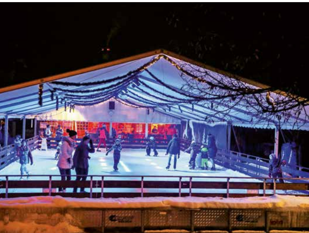
Na dršališču v Medvodah lahko drsate še do nedelje, 12. februarja.