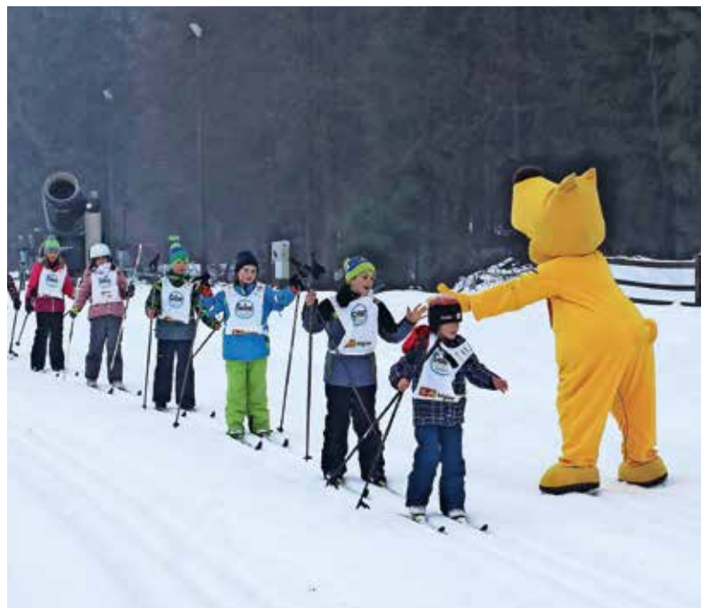
Učenje teka na smučeh je zabavno.