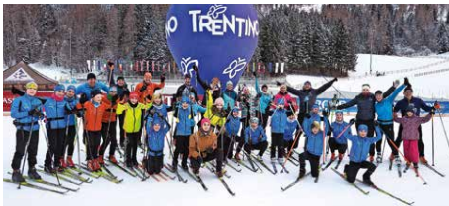
Tekači NŠD Medvode so se izkazali tudi na tekmovanju Skiri Trophy.