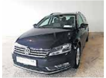
Passat Variant 1.6 TDI, 105 KM, 209.000 km, avt. klima, servo volan, el. stekla, ABS, ESP