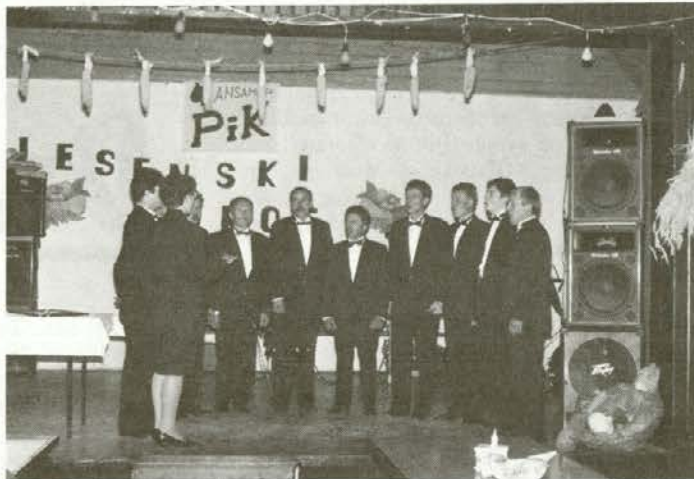
"Šempeterski pavri" so bili prijetna popestritev večera.