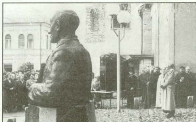
Ob stoletnici rojstva in ob 30-letnici smrti župnika in pisatelja Franca Ksaverja Meška so v Slovenj Gradcu odkrili njegov doprnski kip.

VOŠČIMO VAM VESEL BOŽIČ IN VELIKO ZDRAVJA TER USPEHOV V LETU 1995