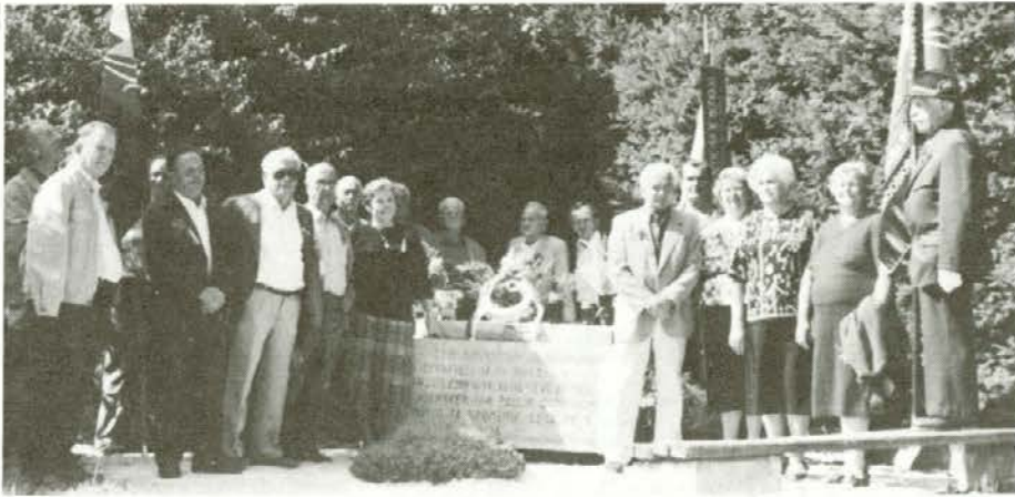
Takole so se zbrali okrog spomenika na Razboru preživeli nekdanji borci na kraju borbe Tomšičeve brigade 6. oktobra 1994. leta. Še danes radi obujajo spomine