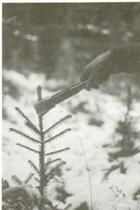
Zaščita s kemocolom in lastno izdelana priprava za mazanje ...