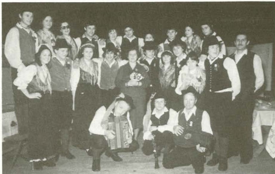
Od vasovanja do ohcetnih šeg Mislinjske doline

uvrstila na državno srečanje ljudskih pevcev in godcev v Laškem