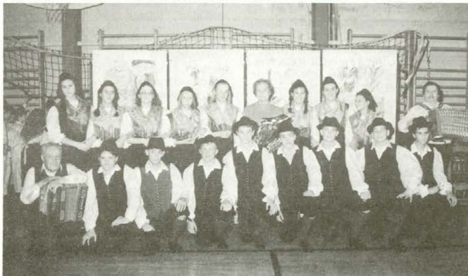
Folklorna skupina Pastirji KD Podgorje, nastop v Mislinji.

Srčno si želimo, da bi krajani znali ceniti in čuvati vse, kar je bilo narejenega. Ne smemo pozabiti tudi na urejanje okolice KD, čemur bomo tudi v bodoče posvečali vso pozornost, da bo naš kulturni dom in kulturno delovanje v ponos vsakemu krajanu. Želimo, da bi naša prizadevanja našla na več posluha tudi v bodoči lokalni samoupravi, saj je lahko na naše delo s podeželja ponosna.