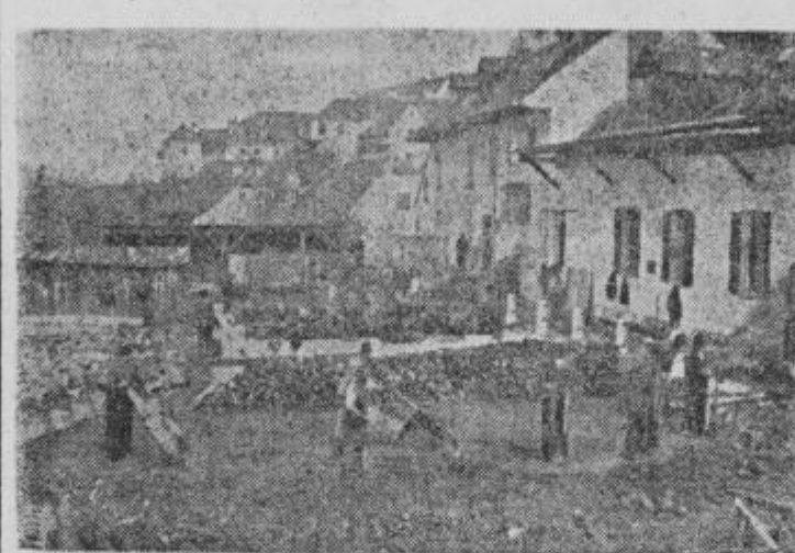
Preurejanje mestnega kopaljšča

adaptacijo zaprtega kopaljšča, za fasado klavnice, za zgraditev sejmišča, javnega stranišča v parku ter stopnišča pod gradom, nadalje dograditev stanovanjskega četvorčka ob Ljutomerški cesti (1.800.000), zgraditev odvodnega kanala bolnice (1.000.000), ureditev mrliške veže na pokopaljšču (730.000),