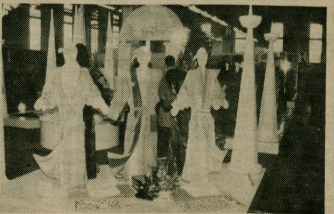
Razkošje barvitih Svilanitovih kopalnih plaščev in brisač