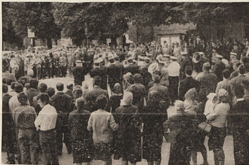
Bratsko srečanje v Ajdovščini. Sp rejem v mestu, kjer je bila ustanovljena prva, slovenska vlada.