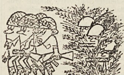
«Vietnamsko ljudstvo je za nami».