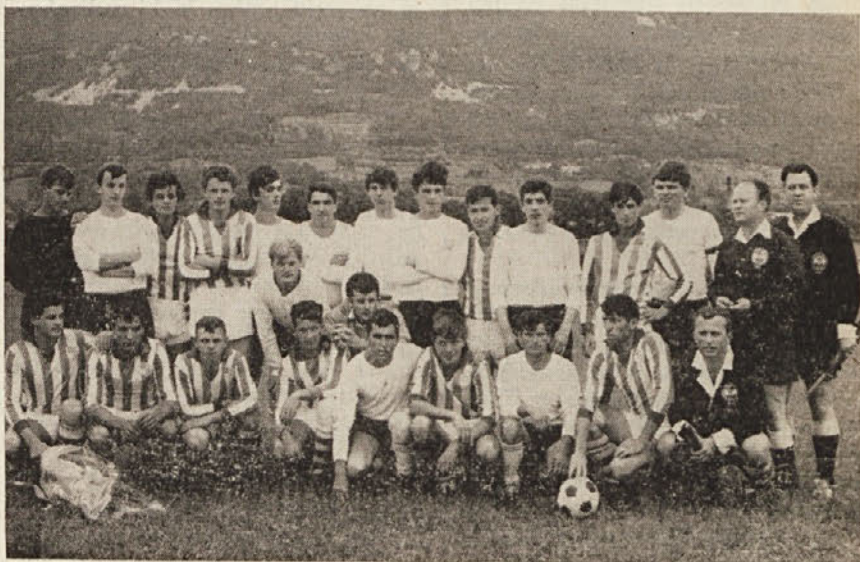
Prijateljsko nogometno srečanje med ekipama »Primorca« iz Trebč in »Primorja« iz Ajdovščine. Izid tekme je bil 2:2.

Risbe je izročiti na sedežu Združenja za kulturne stike s Sovjetsko zvezo, ki ima svoj sedež v Trstu - U. San Nicolò 11, do 15. septembra letos.